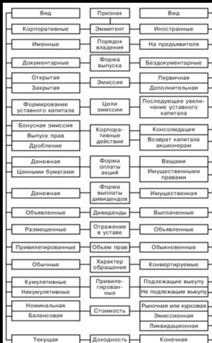
Рис. 4.3. Классификация акций