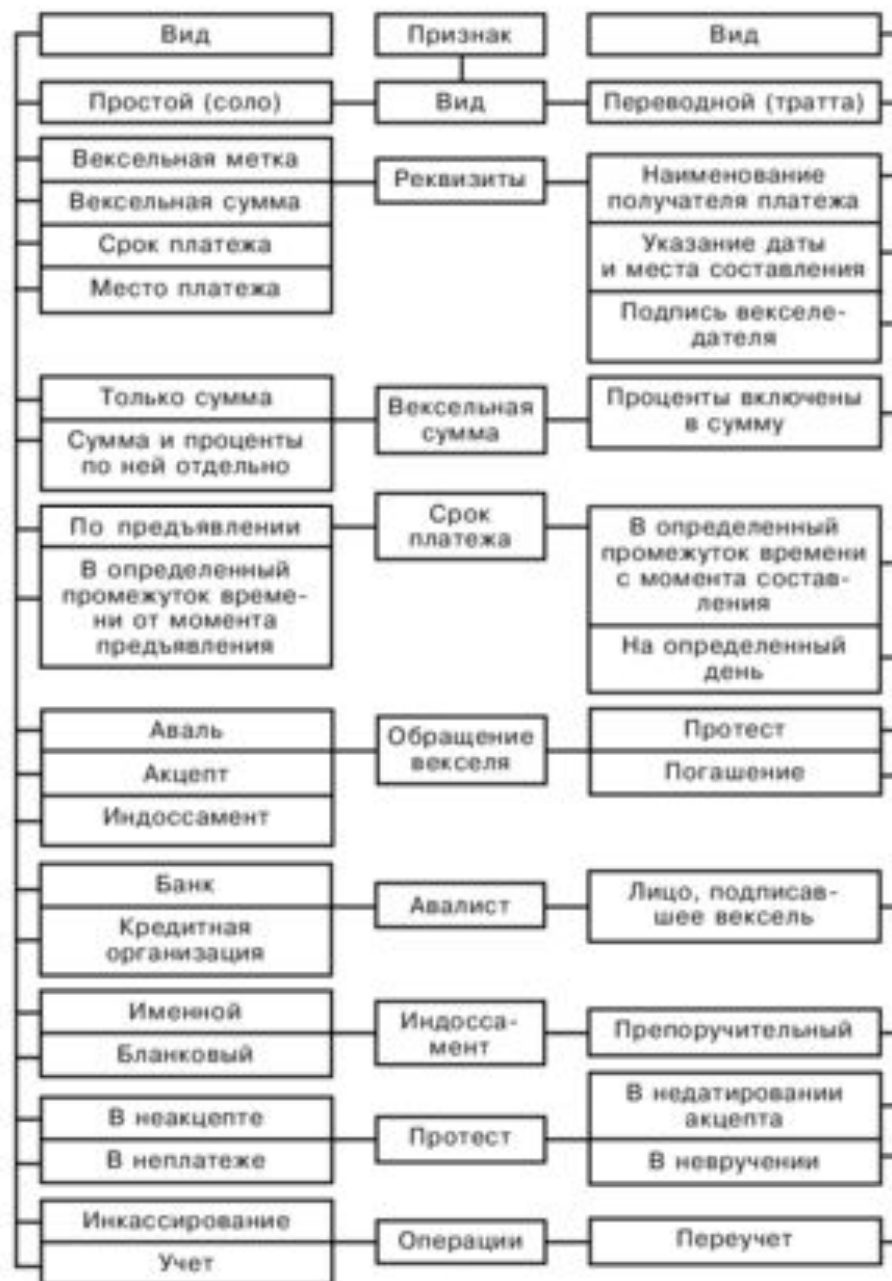
Рис. 4.5. Классификация векселей