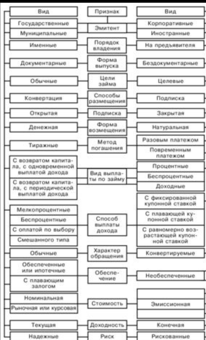
Рис. 4.4. Классификация облигаций