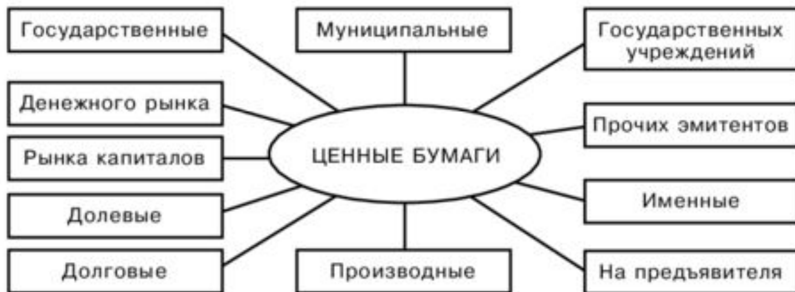
Рис. 4.1. Классификация ценных бумаг

Государственная регистрация выпуска ЦБ — присвоение выпуску ЦБ государственного регистрационного номера.