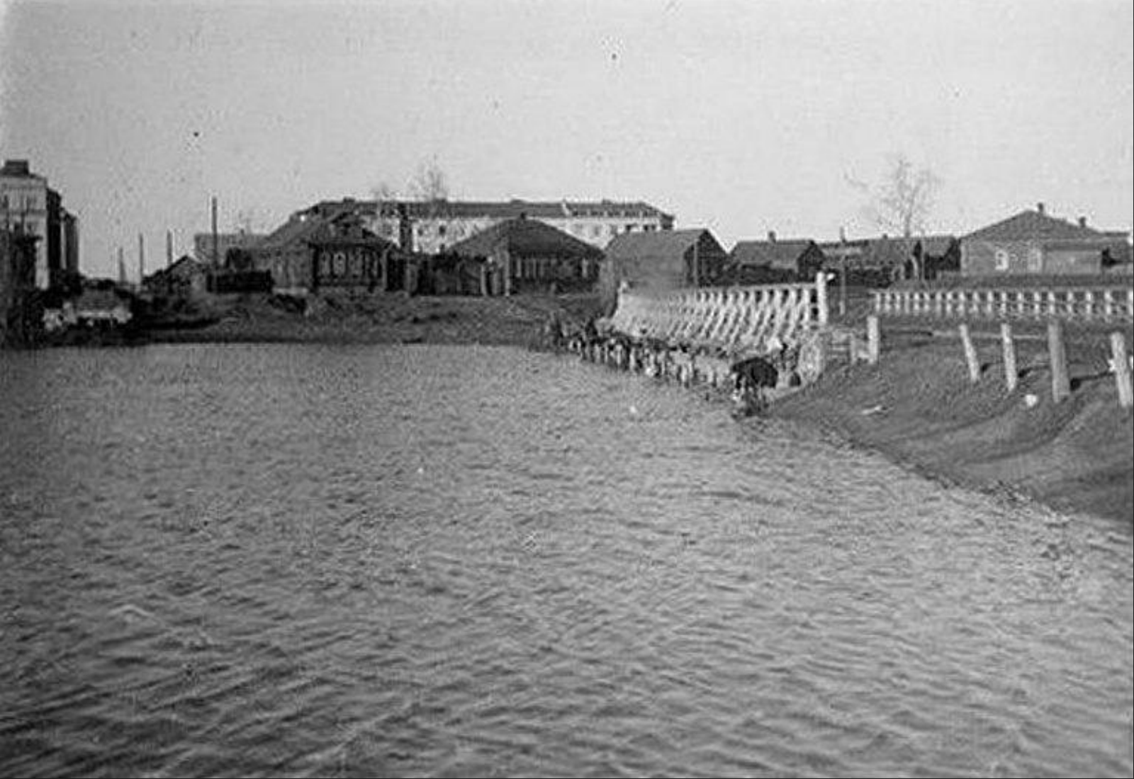
Старый мост через Тверцу