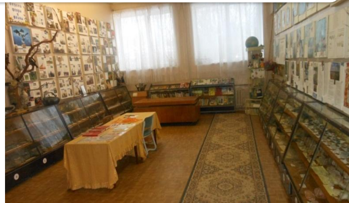
Музею охр природы -45 л