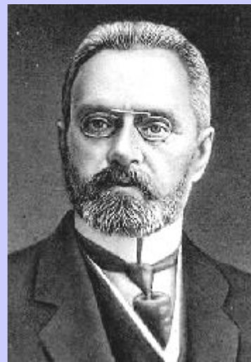
П.Н.Миллюков и А.И.Гучков

Кадеты опирались в основном на интеллигенцию. В это же время возник «Союз 17 октября» (А.И.Гучков). Октябристы добивались единства России, неприкосновенности частной собственности, уравнивания крестьян в правах с др. сословиями, наделение их участками за счет продажи государственных земель, ограничение стачек и введение рабочего законодательства. Октябристы опирались на крупную буржуазию и поме-