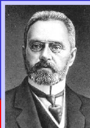
П.Н.Миллюков и А.И.Гучков

Кадеты опирались в основном на интеллигенцию. В это же время возник «Союз 17 октября» (А.И.Гучков). Октябристы добивались единства России, неприкосновенности частной собственности, уравнивания крестьян в правах с др. сословиями, наделение их участками за счет продажи государственных земель, ограничение стачек и введение рабочего законодательства. Октябристы опирались на крупную буржуазию и поме-