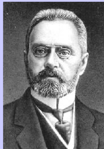
П.Н.Миллюков и А.И.Гучков

Кадеты опирались в основном на интеллигенцию. В это же время возник «Союз 17 октября» (А.И.Гучков). Октябристы добивались единства России, неприкосновенности частной собственности, уравнивания крестьян в правах с др. сословиями, наделение их участками за счет продажи государственных земель, ограничение стачек и введение рабочего законодательства. Октябристы опирались на крупную буржуазию и поме-