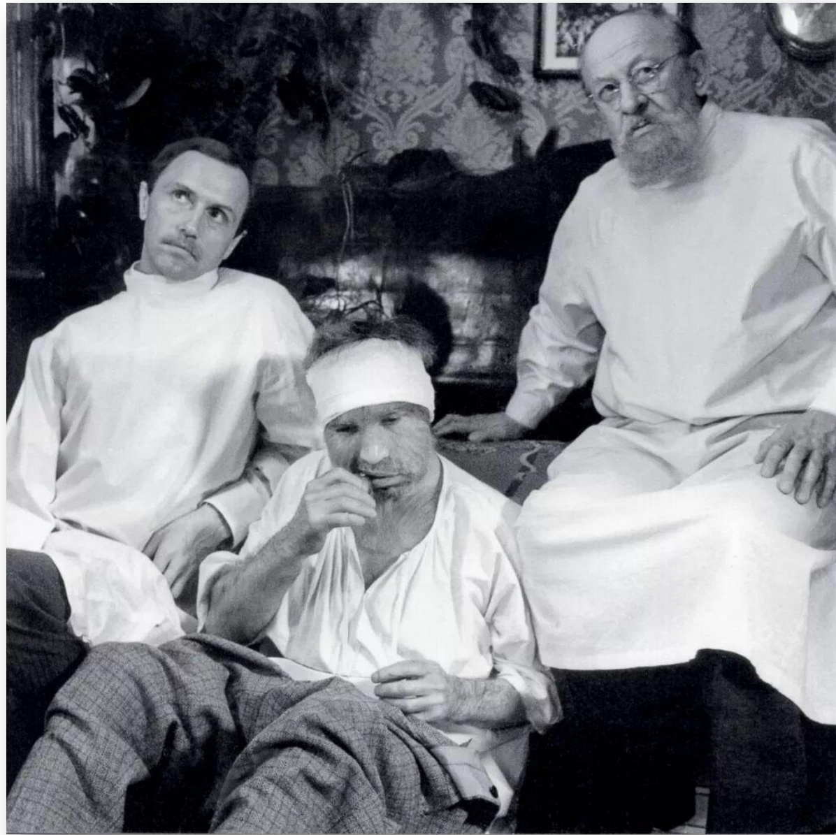
Кадр из фильма – «Собачье сердце», 1988

Так в чем же ценность нравственности? Если она не дает богатства, власти, возможностей? Она делает человека истинно красивым! Если безнравственный человек отвратителен, то духовный отражает красоту Создателя. В конечном итоге, я думаю, именно высоконравственный останется на этой планете. Тогда как «Шариковы» - явление временное, как эксперимент, сотрется с лица