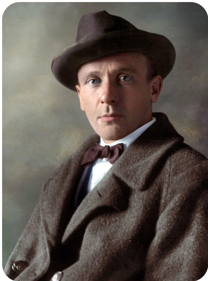
Михаил Афанасьевич Булгаков (1891–1940)

Ироничная повесть Булгакова, в которой писатель «открылся» обществу в своих взглядах на революцию вышла в свет только после его смерти. Это во многом объясняет ситуацию в стране. Был страх перед расправой над теми, кто смеет мыслить открыто.