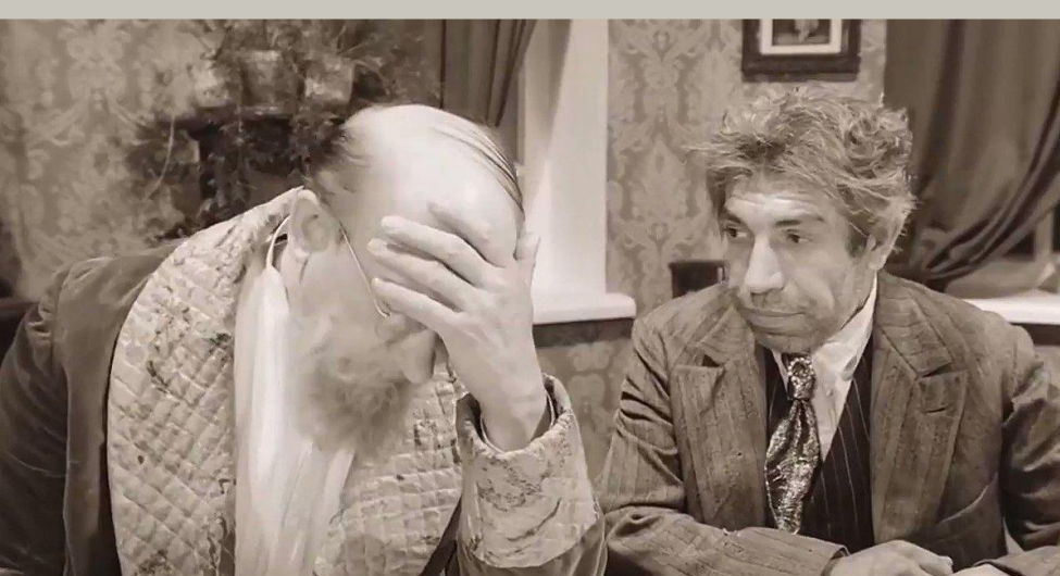
Кадры из фильма – «Собачье сердце», 1988