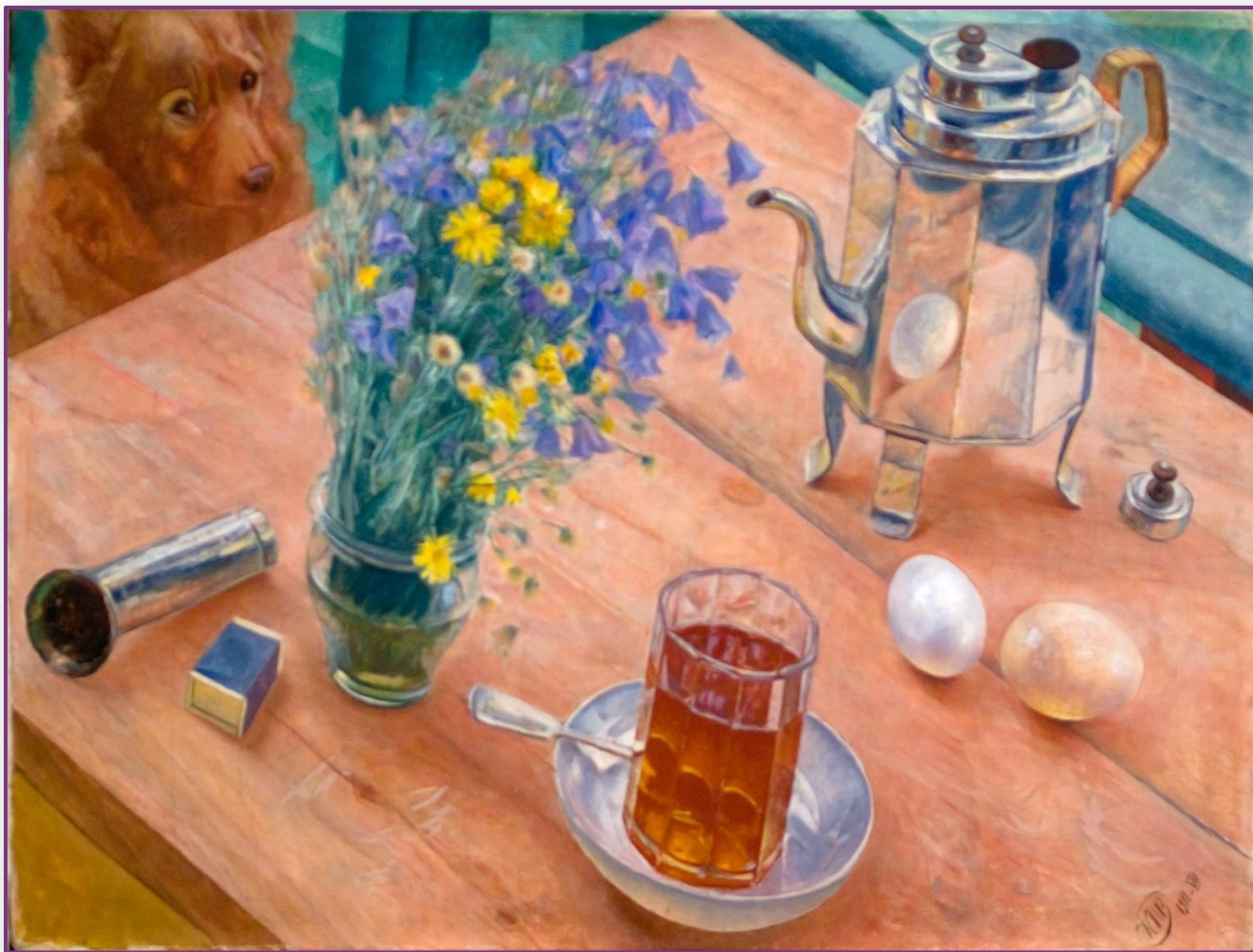
Утренний натюрморт. 1918 г.