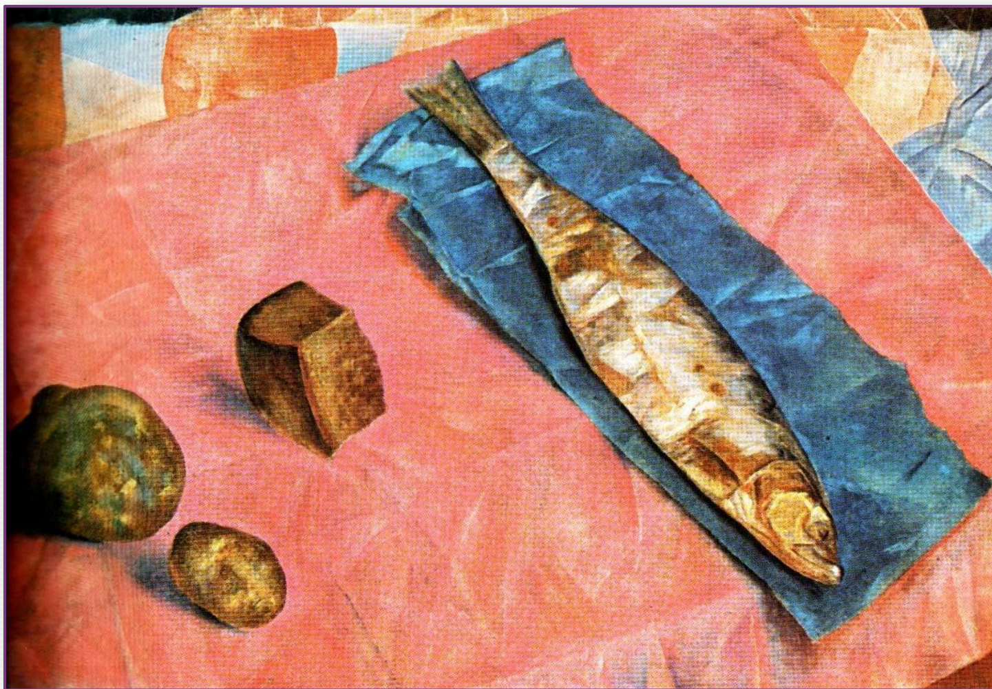
Селёдка. 1918 г.