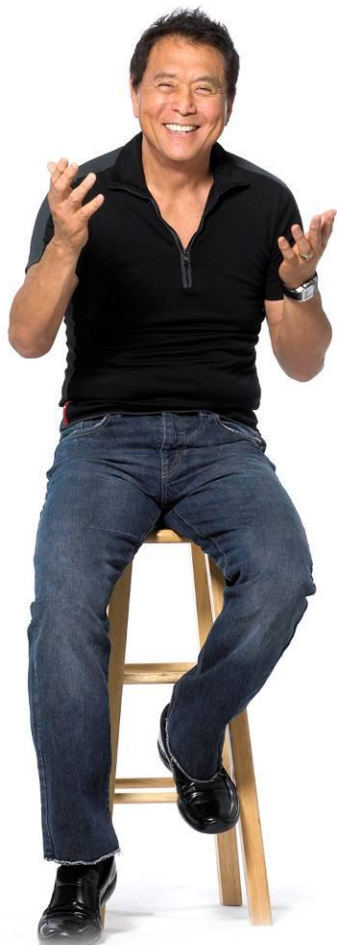
Роберт Кийосаки предприниматель, инвестор, бизнес-тренер, писатель