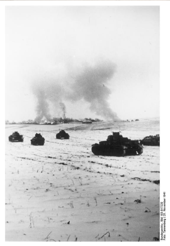
Рязанский, Вит. 1974-81:220 Рос. Иллюстр. 1. 21. Ноябрь 1941

«Защитим Москву!» - был уверен каждый советский воин