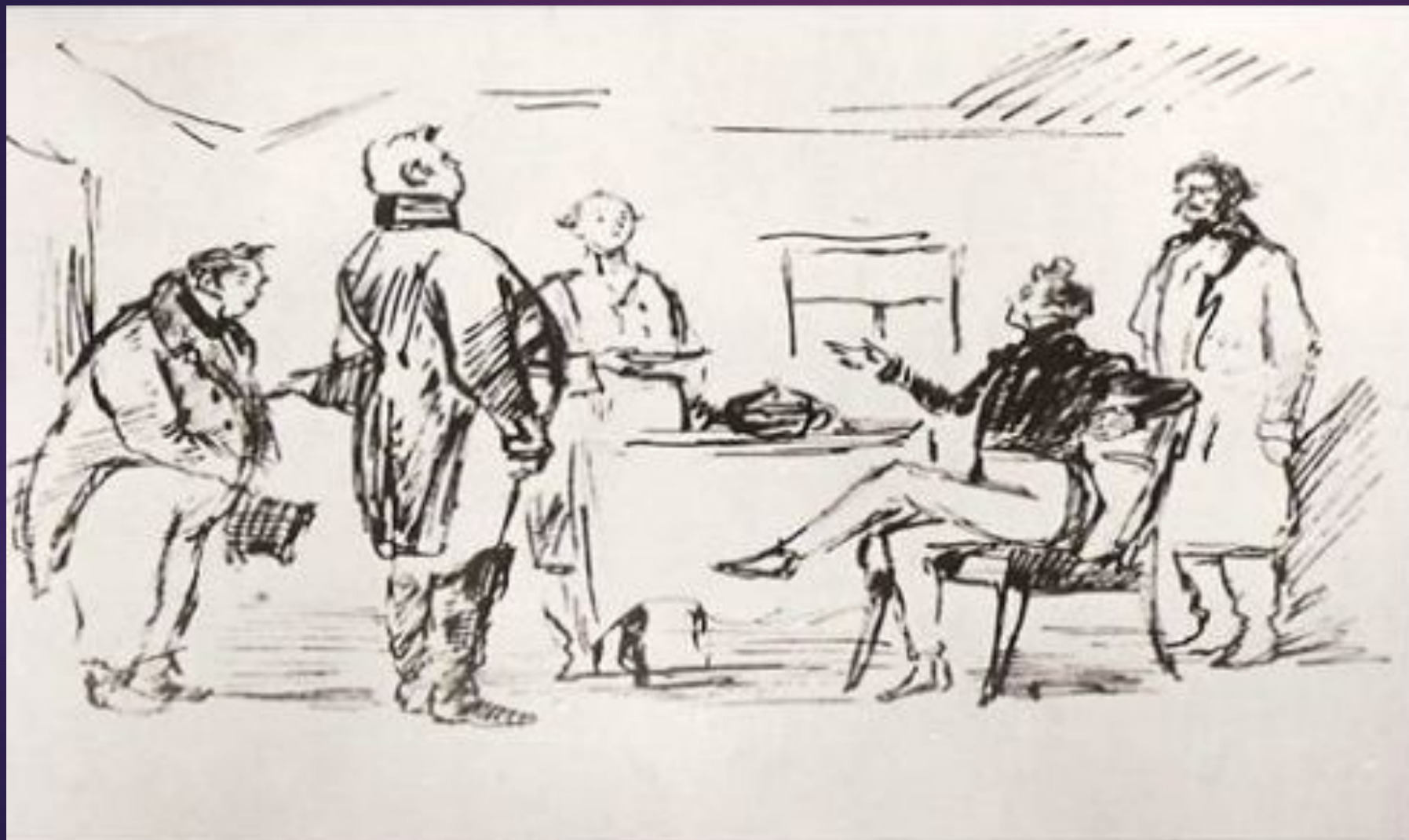
Хлестаков и городничий в гостинице.

В ТРАКТИРЕ ПРИ ОТСУТСТВИИ ДЕНЕГ МОЖНО ПОЛУЧИТЬ ОБЕД ИЗ ДВУХ БЛЮД, КАКОЙ И ПРИНЕСЛИ ХЛЕСТАКОВУ. ПРАВДА, В СУПЕ «КАКИЕ-ТО ПЕРЬЯ ПЛАВАЮТ ВМЕСТО МАСЛА», А ЖАРКОЕ БОЛЬШЕ ПОХОЖЕ НА «ТОПОР ЗАЖАРЕННЫЙ».