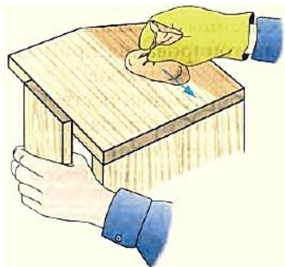
Нанесение лака тампоном

Лак можно наносить тампоном или кистью. При лакировании тампоном на рабочую руку должна быть надета резиновая перчатка.