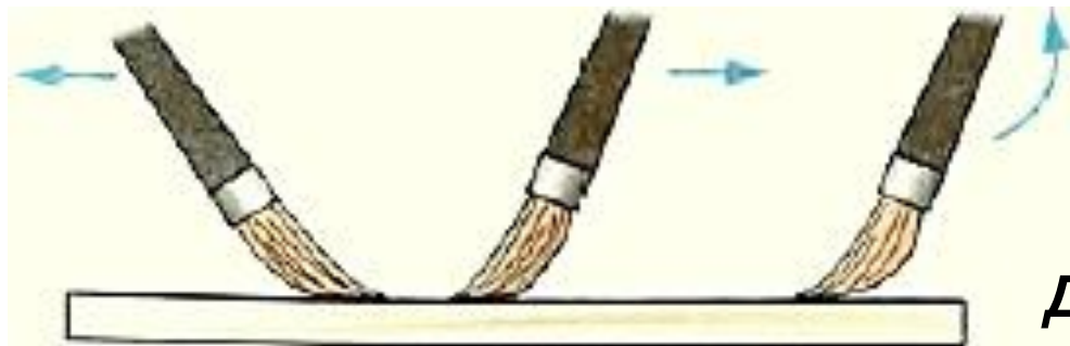
Движение кисти при лакировании