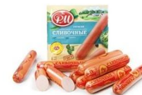
Сосиски, сардельки →