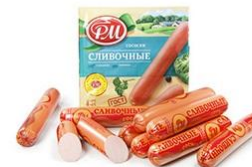
Сосиски, сардельки →