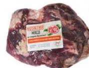
Мясной ассортимент →