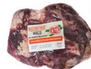
Мясной ассортимент →