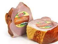
Ветчины и окорока →