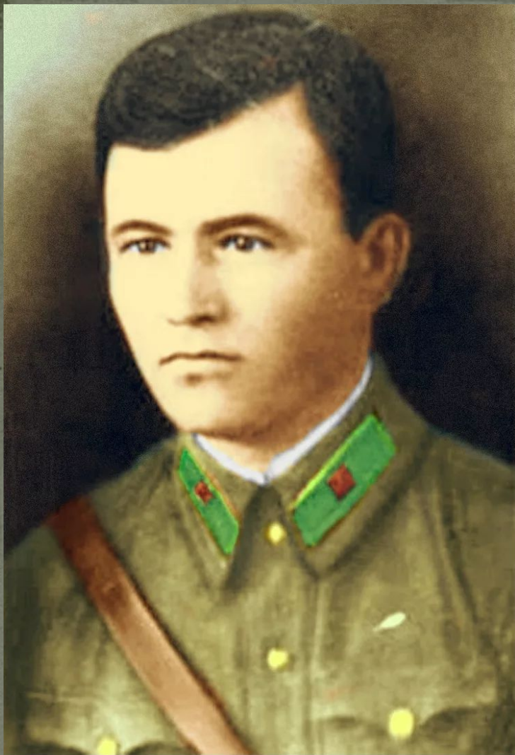
Лейтенант КИЖЕВАТОВ Андрей Митрофанович

22 июня 1941 года лейтенант А. М. Кижеватов возглавил оборону заставы и был первый раз ранен. 23 июня, когда от здания заставы остались одни руины, со своими бойцами перешёл в подвалы находящейся рядом казармы 333-го стрелкового полка, где сражалась группа бойцов под командованием старшего лейтенанта А. Е. Потапова. В последующие дни продолжал вместе с Потаповым руководить обороной казарм 333-го полка и Тереспольских ворот. 29 июня, когда боеприпасы были почти истрачены, было принято решение предпринять последнюю отчаянную попытку прорыва. Потапов возглавил группу прорыва, а 17 раненых бойцов во главе с уже тяжелораненым лейтенантом Кижеватовым остались для прикрытия в крепости. Лейтенант Кижеватов погиб в этом бою.