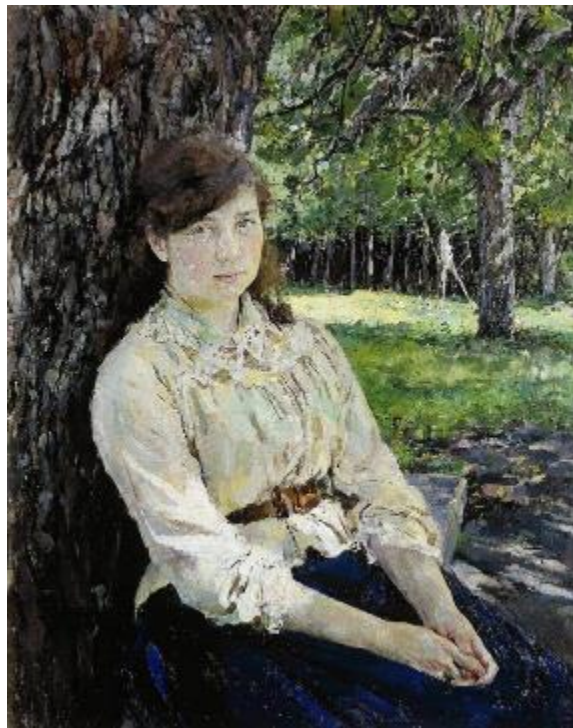
В.А.Серов Девушка, освещенная солнцем