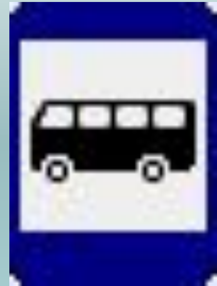
Остановка автобуса, троллейбуса