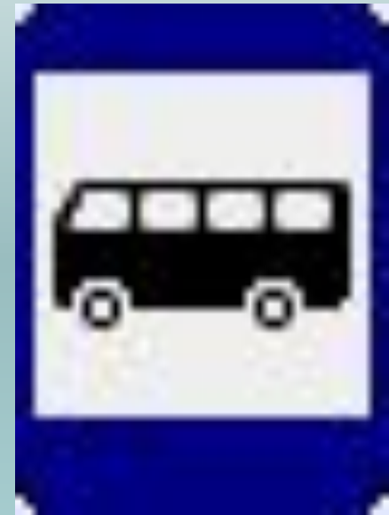
Остановка автобуса, троллейбуса