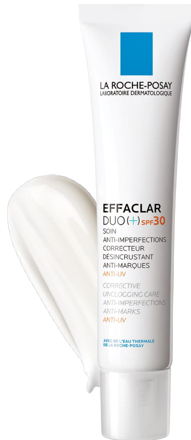
ДОГЛЯД ВДЕНЬ Ефаклар Дуо(+) SPF30