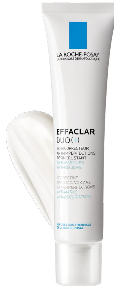
НОЧНОЙ УХОД Эфаклар Дуо(+)