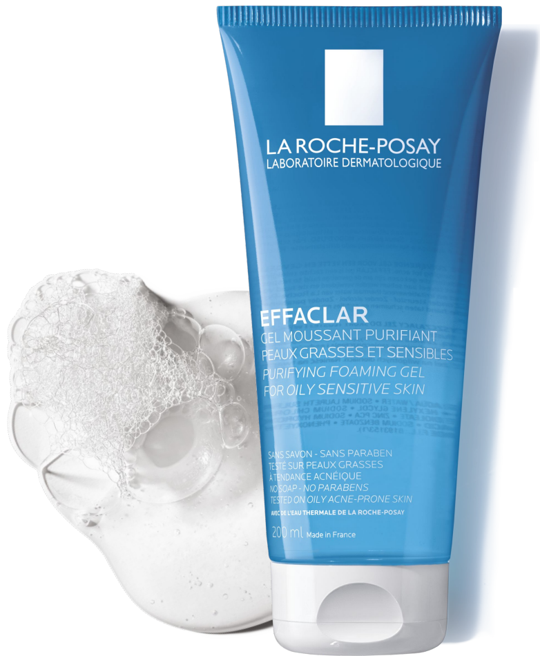
ОЧИЩЕНИЕ Гель-мусс Эфаклар