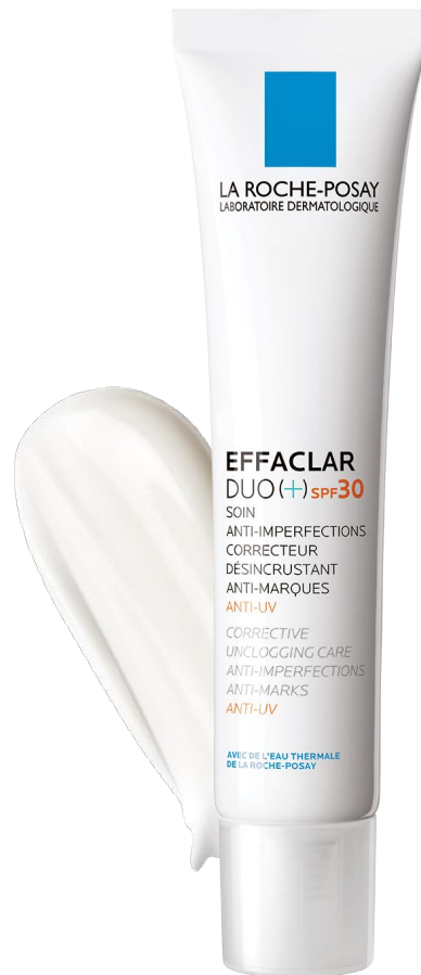
ДНЕВНОЙ УХОД Эфаклар Дуо(+) SPF30