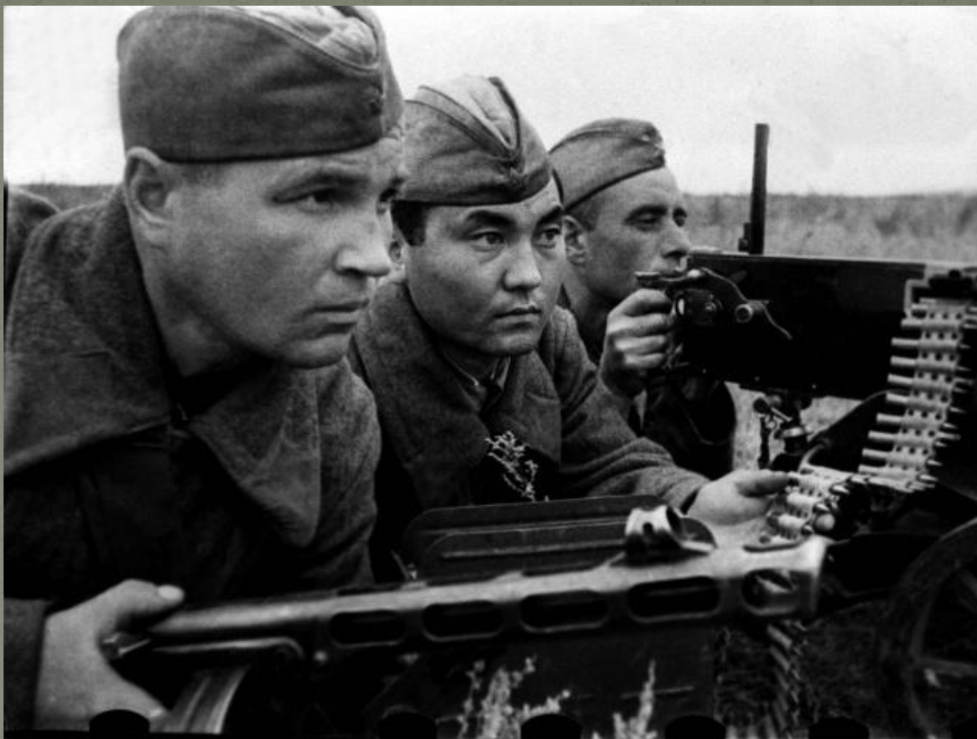
Пулемётный расчёт: русский, казах, украинец