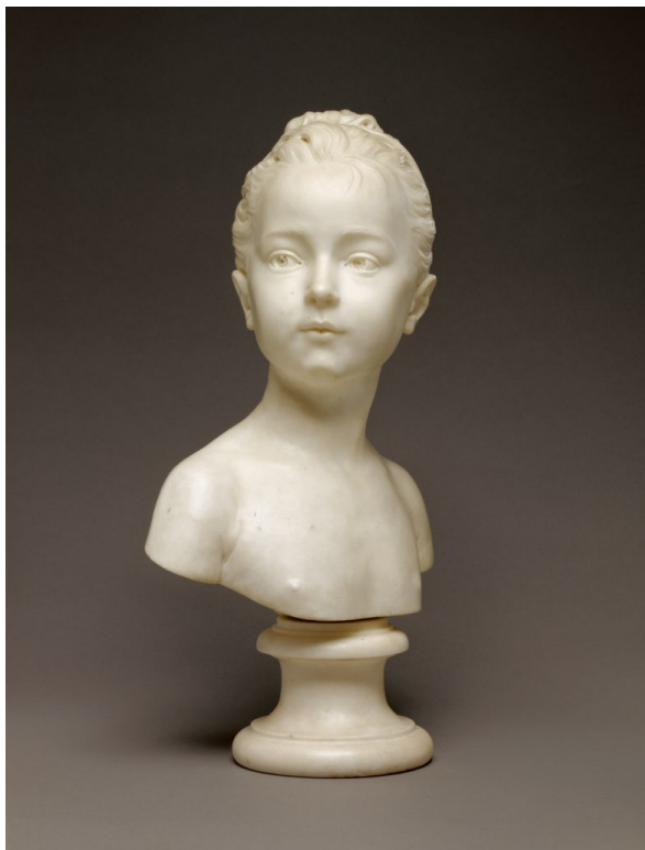
Бюст Луизы Бронниар 1777г.

Более всего Гудона увлекала пластическая анатомия, освоением которой он, по его собственным словам, занимался на протяжении всей жизни. Находясь в Италии, мастер каждый день бывал в анатомическом театре, и это пристальное отношение к анатомическим особенностям человека в дальнейшем позволило ему стать настоящим виртуозом в портретной скульптуре. Именно портреты известных деятелей разных стран, которые он передавал не только с большой живостью и точностью, но и с глубоким пониманием личности человека, прославили его на весь мир и обеспечили крупными заказами от знатных особ.