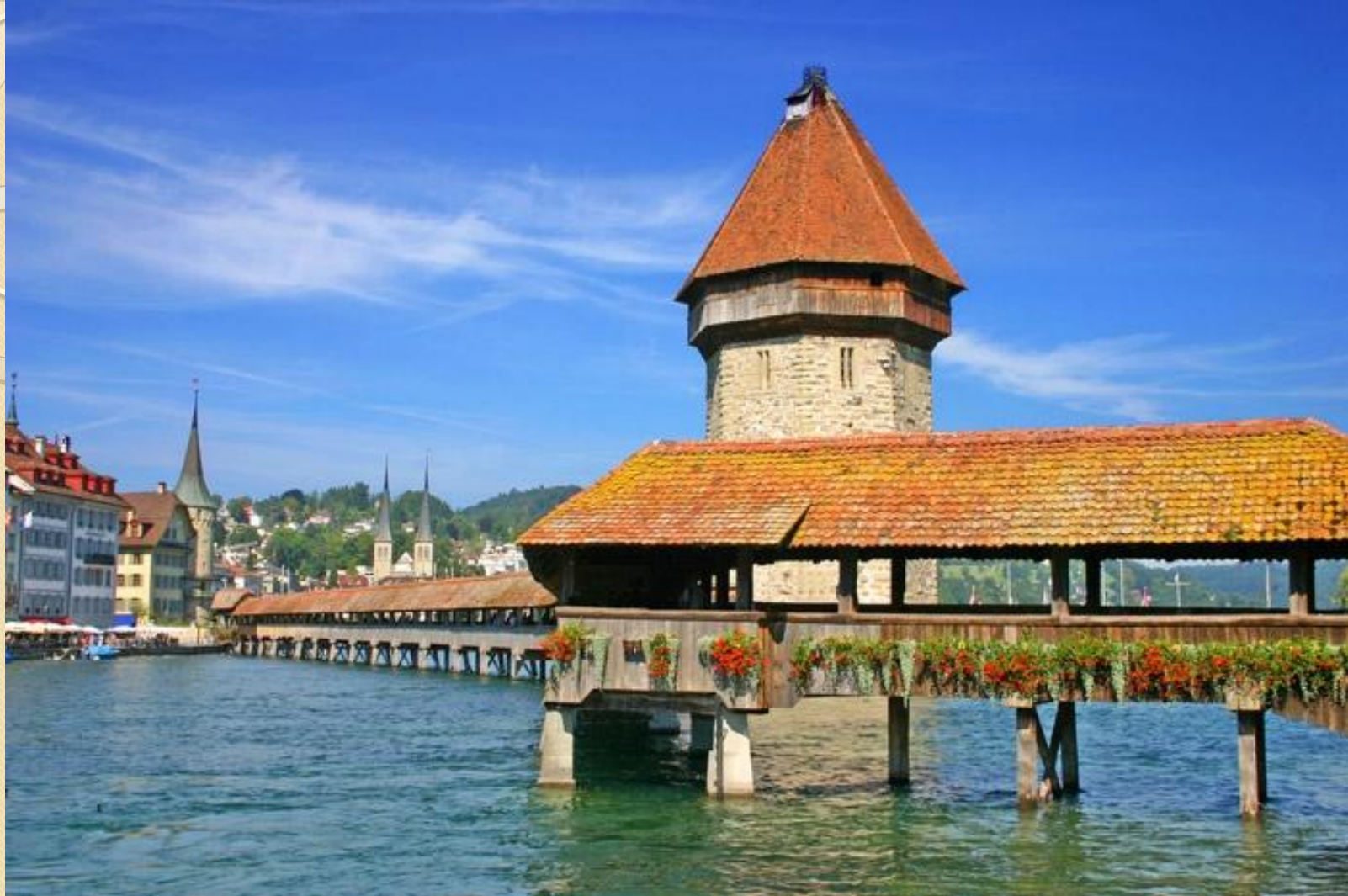
Часовенный мост Капельбрюкке в Люцерне

У Люцерна есть много захватывающих достопримечательностей для туристов и путешественников, но все же Часовенный мост остается одним из наиболее посещаемых мест назначения в городе. Самый старый деревянный мост на континенте, он был построен в 14 столетии, как средство защиты от нападений преступников. Сегодня интерьер его немного изменился, здесь проводятся художественные и исторические выставки, которые привлекают сотни посетителей.