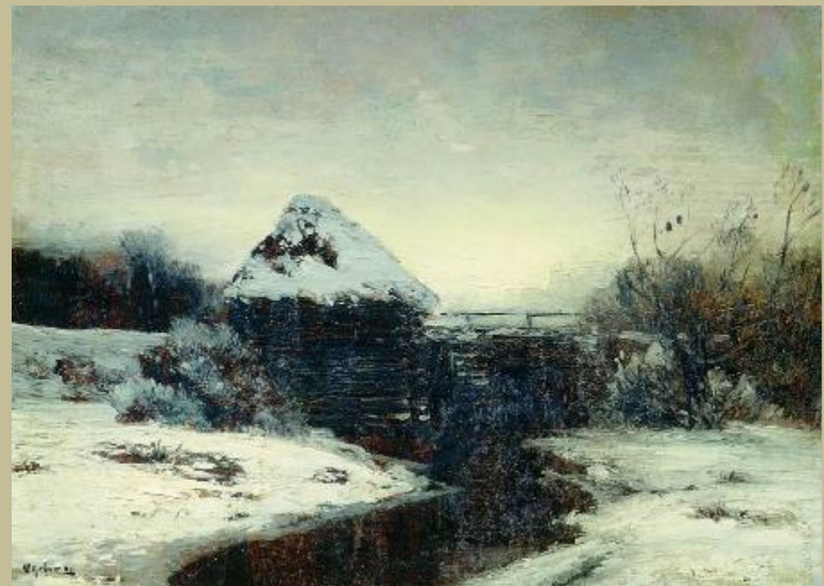
И.Левитан. Зимний пейзаж с мельницей. 1884г.