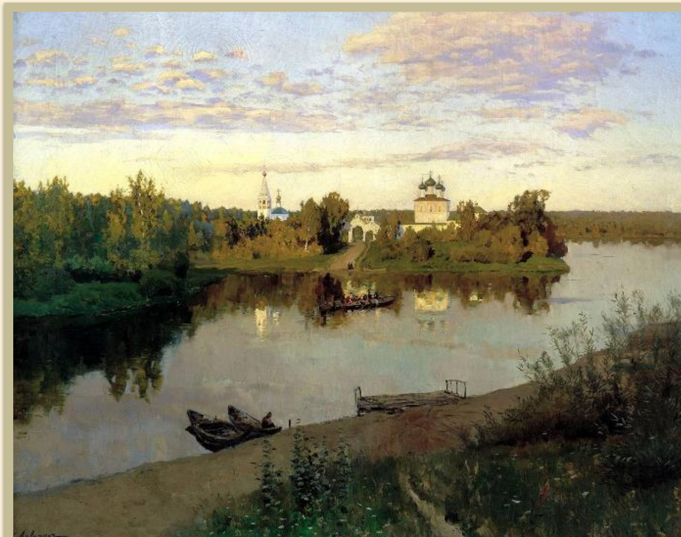
И.И.Левитан. Вечерний звон. 1892г.