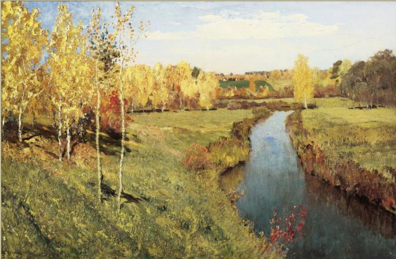
И. Левитан "Золотая осень", 1895 год