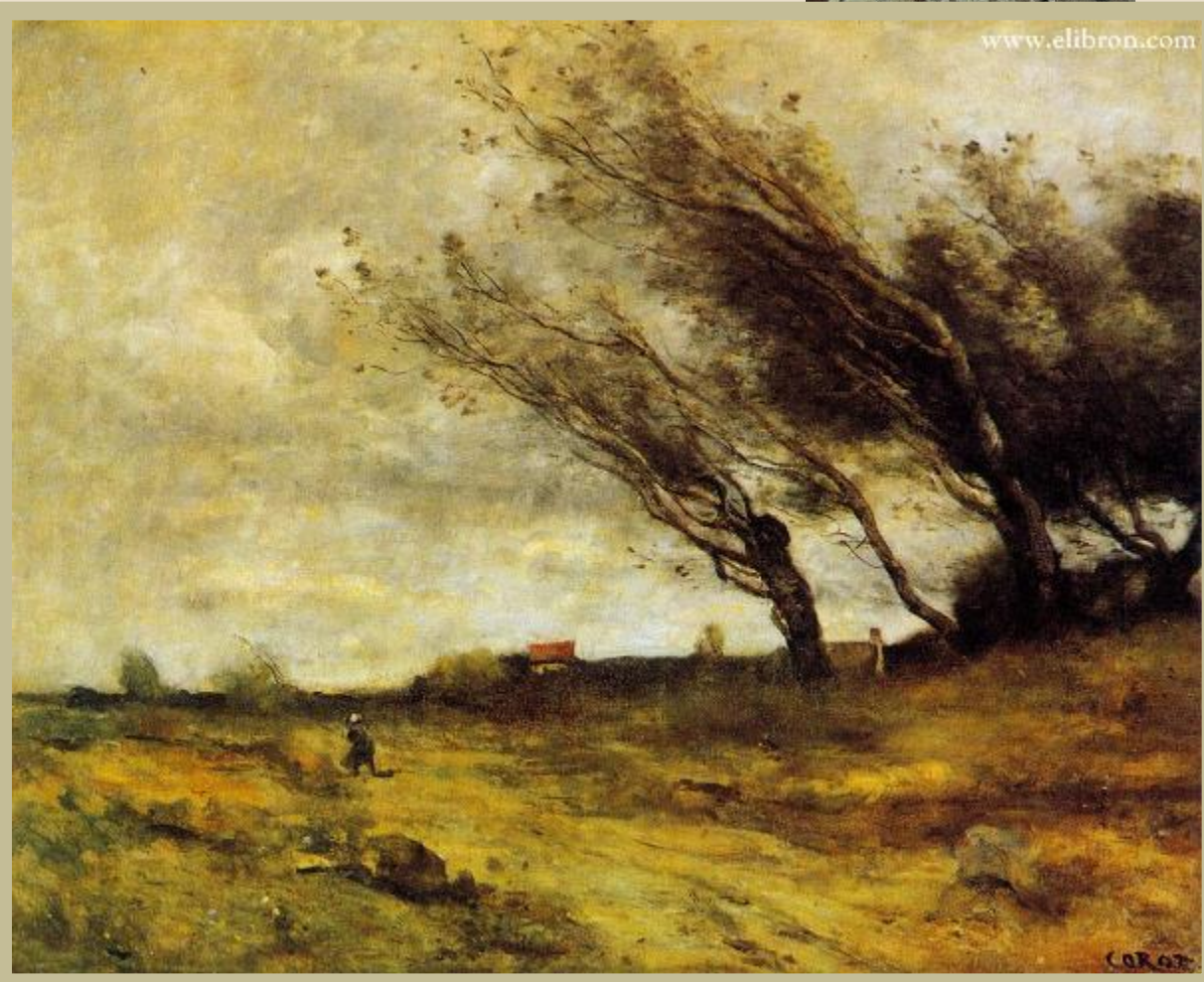
К.Коро. Порыв ветра. 1870г.

художник передает тревожную атмосферу приближающейся бури, создает образ природы, полный экспрессии и драматизма.