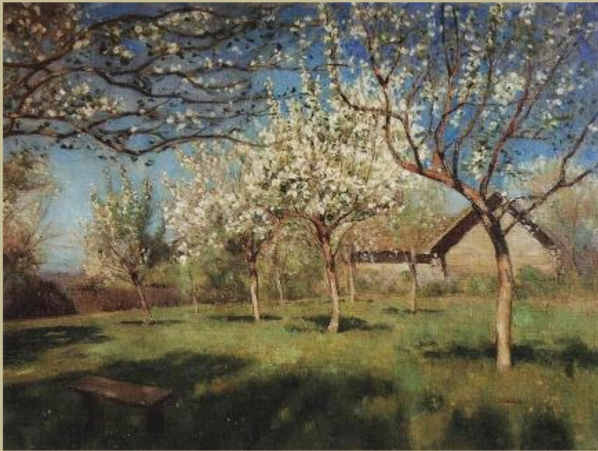
И.Левитан. Цветущие яблони. 1896г.