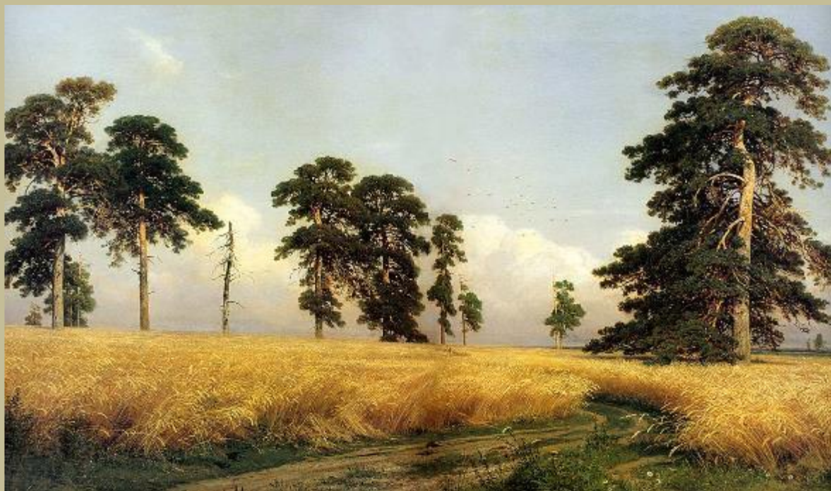
И.И.Шишкин. Рожь. 1878г.

Пейзажи живут в нашем сознании как задушевные картины природы и погружают в мир прекрасных чувств, глубоких мыслей, вечных духовных ценностей. Каждый из художников-пейзажистов был самобытным живописцем, создавшим свой уникальный образ