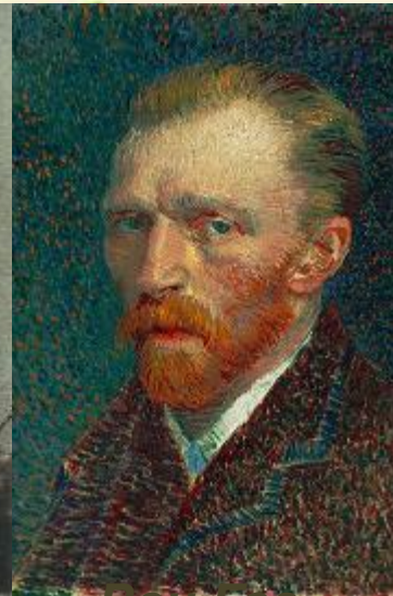
Ван Гог (1853-1890)