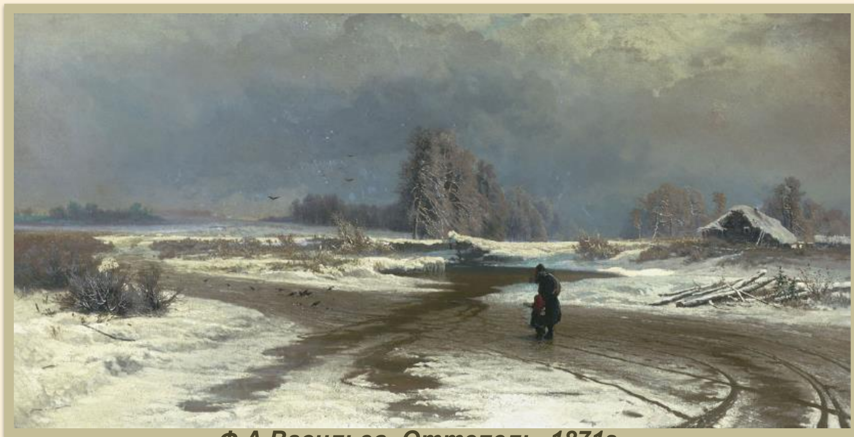
Ф.А.Васильев. Оттепель. 1871г.