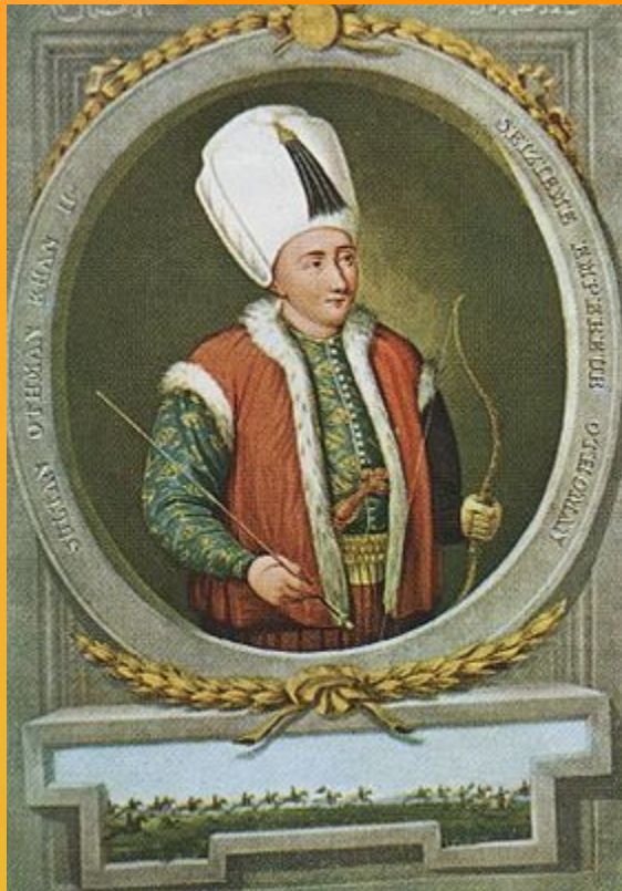
Осман II (1618-1622)