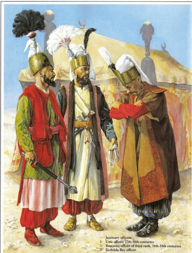
Janissary officers 1: Usta officer, 17th-18th centuries 2: Başçavuş officer of third rank, 16th-18th centuries 3: Kethüda Bey officer