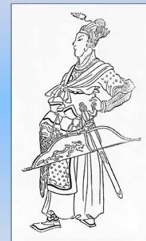
Батый, хан Золотой Орды, сын Джучи и внук Чингисхана