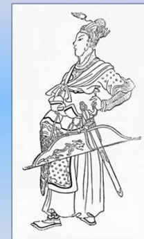
Батый, хан Золотой Орды, сын Джучи и внук Чингисхана