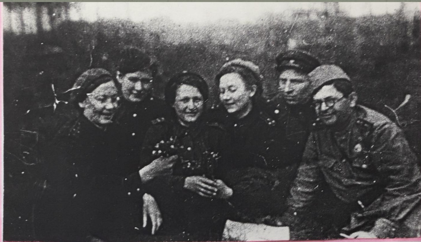
Ярцево, Смоленская область,

Довольно быстро эшелон с госпиталем прошёл путь от Свердловска до станции Дурово, между Вязьмой и Ярцево.