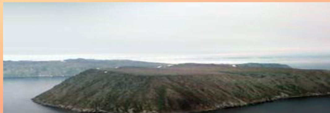
Остров Крузенштерна (Малый Диомид)