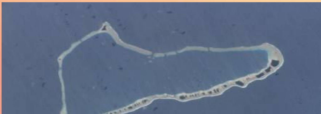
Атолл Крузенштерна, Пискадор