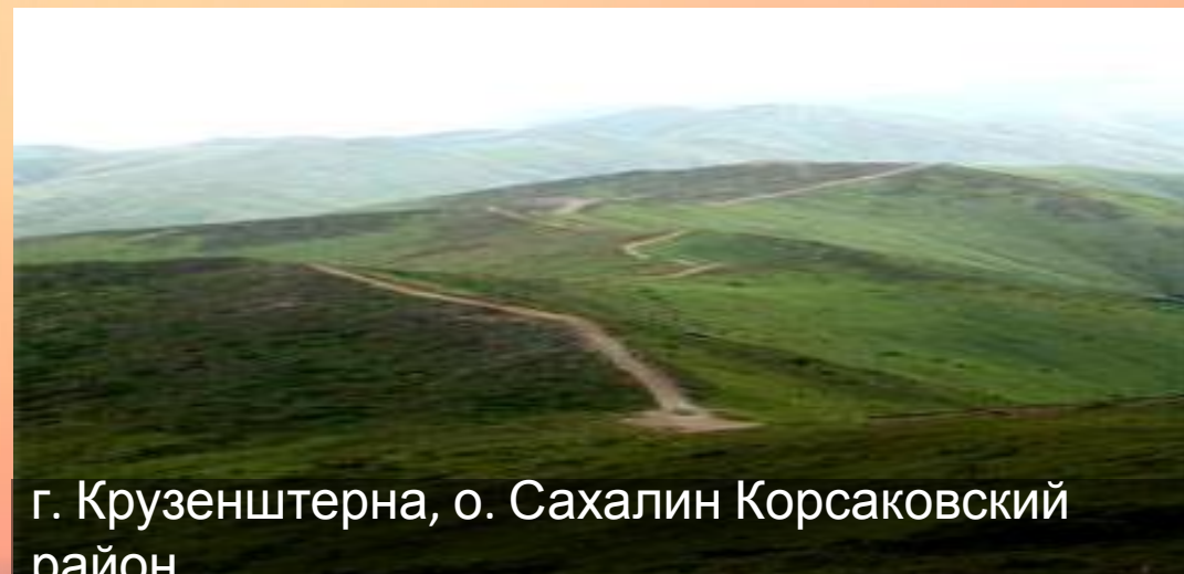
г. Крузенштерна, о. Сахалин Корсаковский район