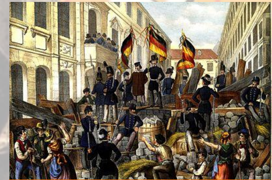
На улицах Вены, 1848 год