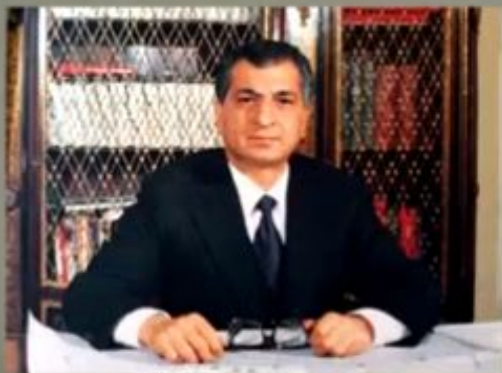
Бабрак Кармаль (1929 – 1996 гг.)

Однако, «Ограниченный контингент советских войск в Афганистане» (ОКСВ) не смог изменить ситуацию в стране. Напротив, это лишь ужесточило гражданскую войну в Афгане. А участие советской группировки в ней ударило по авторитету СССР и усилило его международную изоляцию.