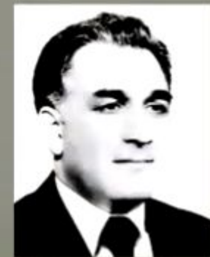
Хафизулла Амин (1929 - 1979 гг.)

Вечером 27 декабря 1979 года советские спецподразделения штурмом овладели президентским дворцом, где находился Хафизулла Амин, сам Амин погиб.