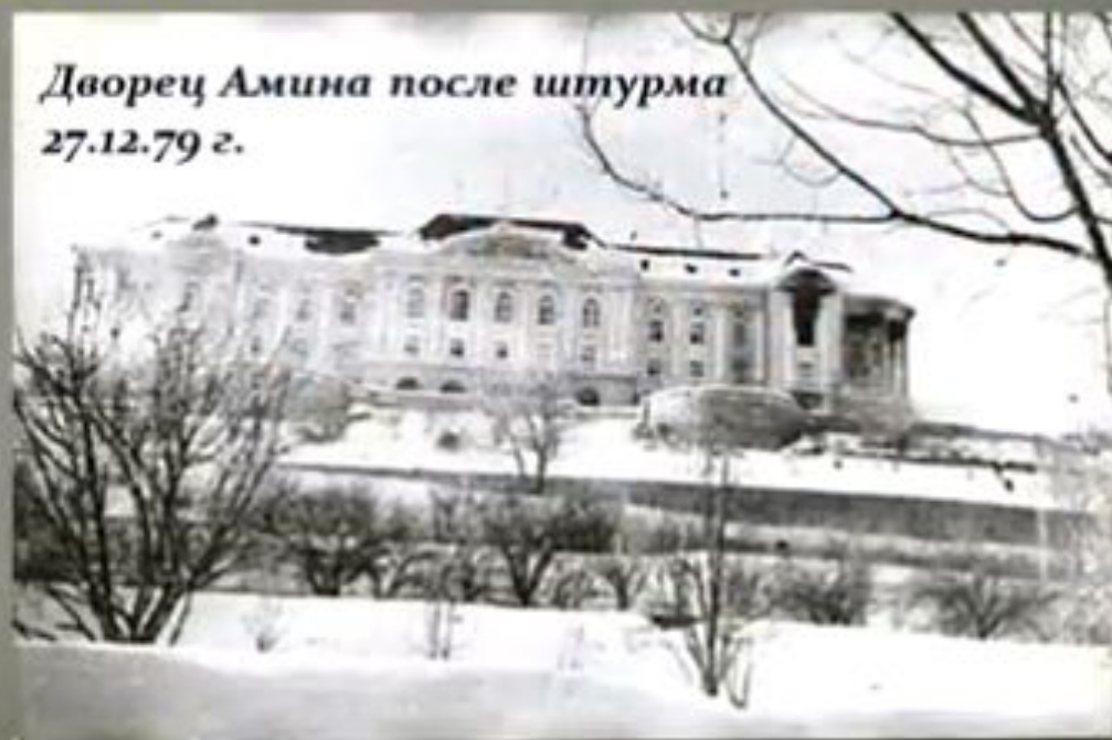
Дворец Амина после штурма 27.12.79 г.

В этих условиях Политбюро ЦК КПСС 12 декабря 1979 года приняло решение ввести советские войска в Афганистан.