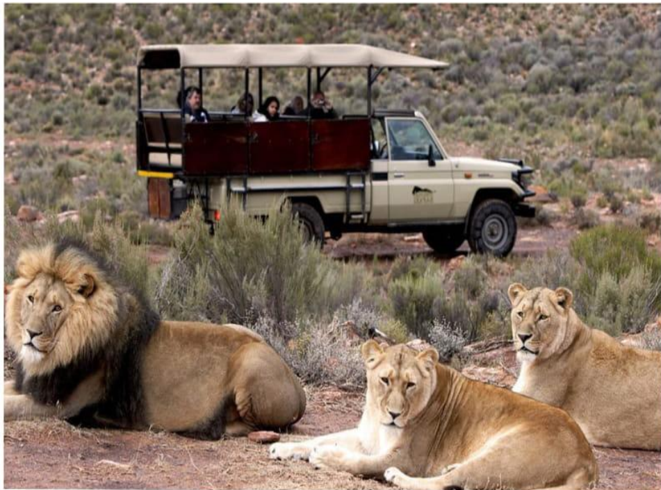
Саваннада туристерді арнайы көліктермен ғана аралатады.