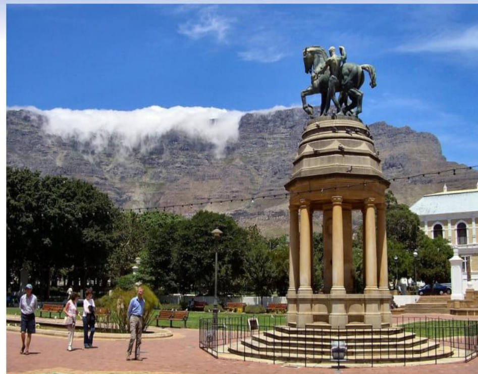
Қаланың орталық алаңдарының бірінде. Алыстағы бұлт басқан биік — Үстел тауы.

Қол босағанда қаланың көрікті ғимараттарын тамашалап, кемелері жарқыраған порттарымен, ондаған шақырымға созылған құмдауыт жағажайларымен, ежелгі тас қамалдармен, алуан мақсаттағы мұражайларымен шама-шарқымызша танысумен болдық. Мұражай демекші, теңіз жағасында «Қос мұхит аквариумы» атты туристердің көп келетін сүйікті орны бар екен. Аквариумда үш мыңға тарта мұхит жануарлары жинақталыпты. Жеті галереяға бөлінген осы аквариум ішінде түрлі акулалар, балықтар мен тасбақалар, моллюскалар мен шаяндар толып жүр. Атлантика мен Үнді мұхитта-