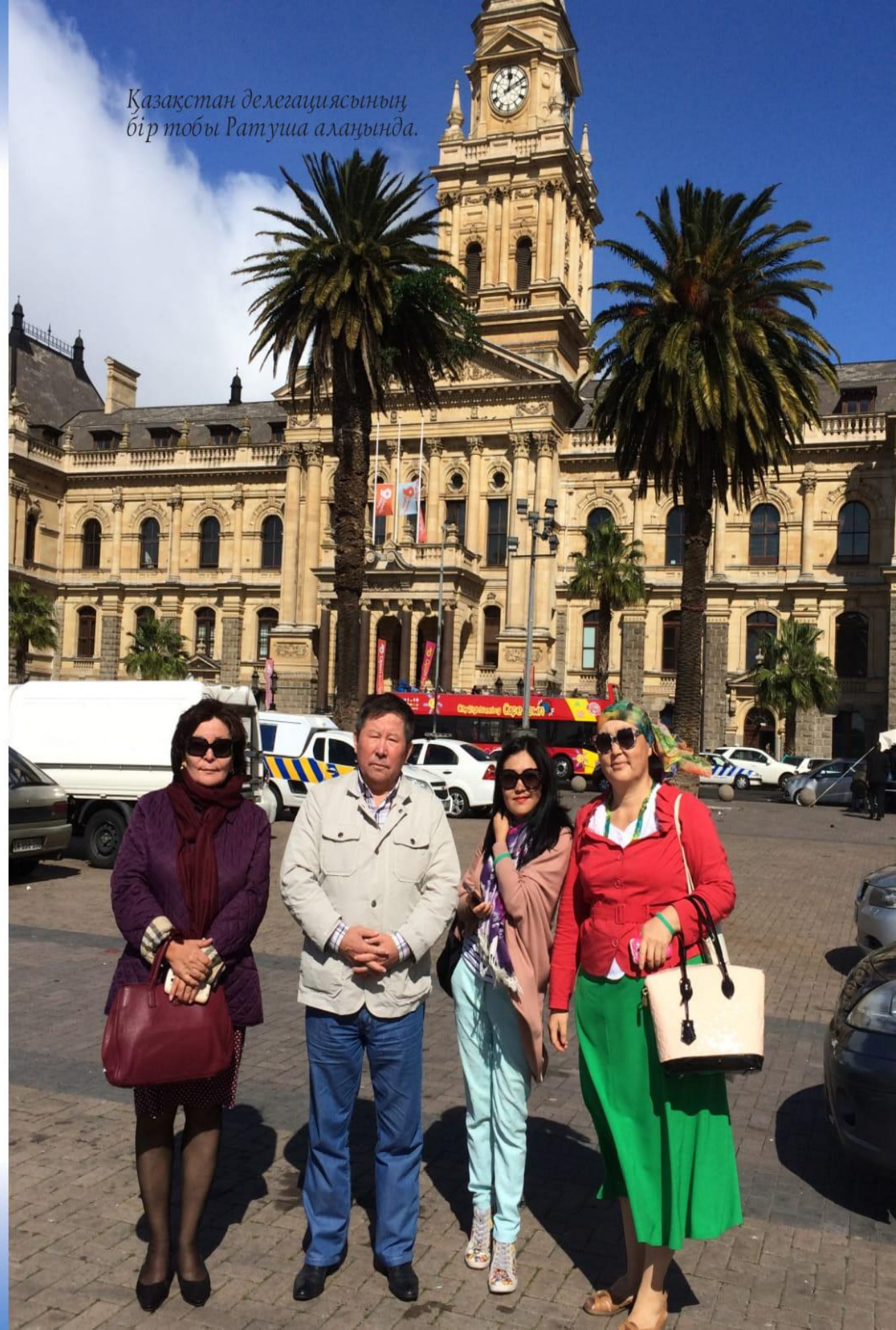
Қазақстан делегациясының бір тобы Ратуша алаңында.

Қаланың түстігінде «Столовая гора» атты биігіне сабырлы салтанат ұялатқан мұз жалды ерекше тау сілемі бар екен. Біз оны «Үстел тауы» деп қазақшалаған болдық. Күн сайын таңертең осы Үстел тауын белдеулеп бозала тұман кілкі қалатыны қандай ғажап.. Бұл тау аймақтың туында да бейнеленіп, Кейптаун қаласының мәртебелі символы саналатын тәрізді. Алып атандай шөгіп жатқан жалпақ таудың үсті тақтайдай жазық, алыстан қараған жанға расымен үстелден аумай қалған. Бұл тауға жаяу шығатын жол жоқ, жан-жағы шақырымға созылған күз-жартас, қарасаң басыңдағы бөркің түседі. Тасқа өрмелеуші бірер альпинистің арқан салып, тырмысып жоғарыға шығып бара жатқанын көрдік. Былайғы жұрт пен қаптаған туристер шапшыма жартасқа аспалы вагонеткамен тігінен көтеріліп жатты. Жүз қабатты ғимаратқа лифтімен заулап шыққандай миымыз аузымызға тығылған. Тау биігінен етекте кең көсілген ажарлы қала мен шырайлы шығанақ барша келбетімен жайыла көрінді.