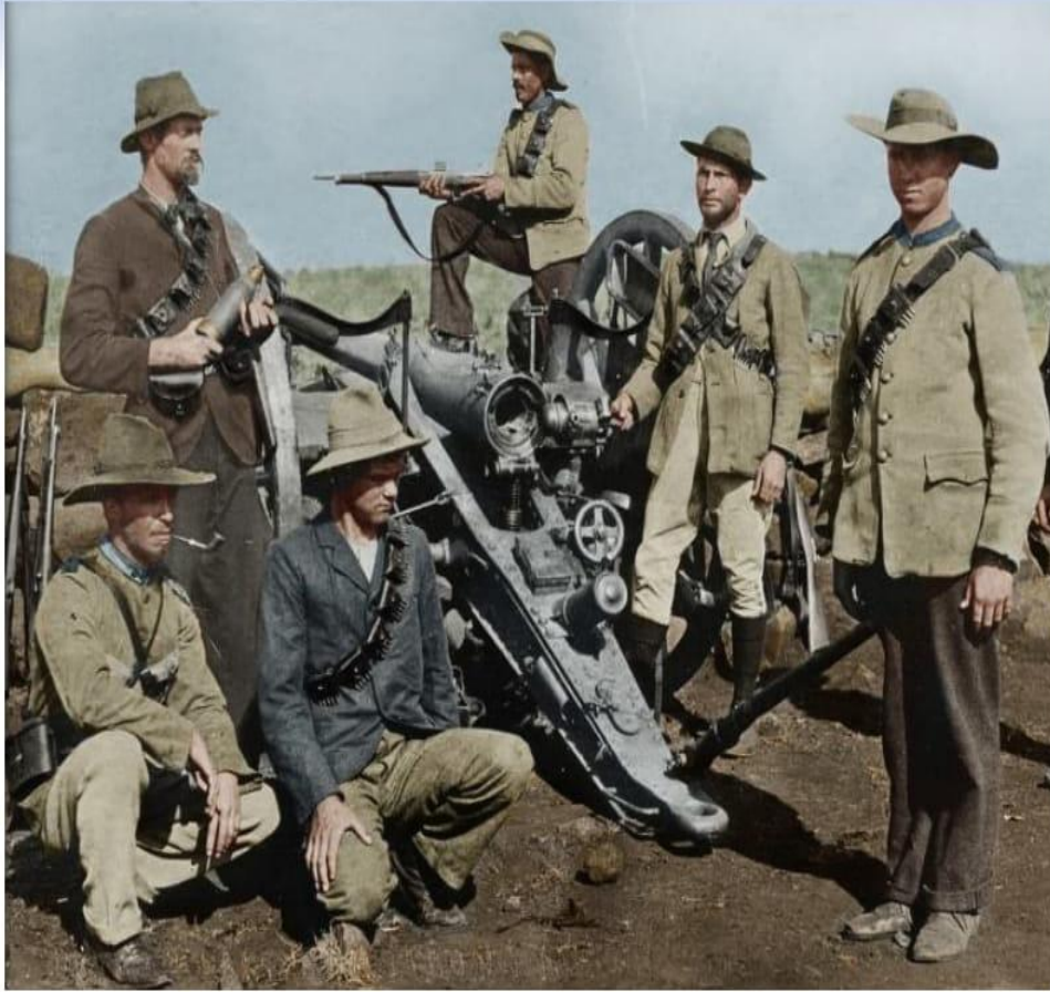
Ағылшын басқыншыларына қарсы күрескен бур еріктілері.

уға кіріседі. Соның арқасында аймақтың тасы өрге домалап, қалашық жыл санап емес, ай санап қарқындап дамиды. Байсалды, бәтуалы мекенге, берекелі, мерекелі қалаға айналады. Арада жүз жыл өткенде бұл мекендегі құлдардың саны еркін тұрғындардың санынан аса бастайды. Осылайша Кейптаун Еуропадан қоныс аударған ақ нәсілділердің меншіктенген өз қаласына айналып кете барады.