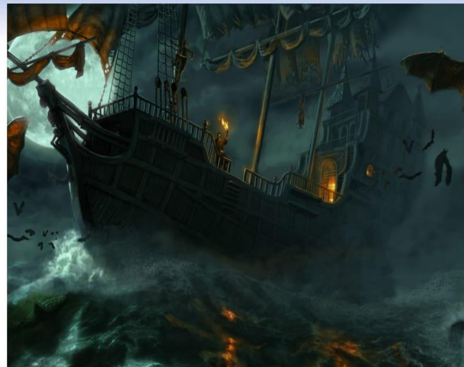
Теңізшілердің үрейін алған «аруақ кемені» бір суретші осылай бейнелепті.

1939 жылы Үміт мүйісінің етегінде жағажайда демалып жатқан 60 адам тып-тынық теңіз бетімен қалқып бара жатқан «аруақ кемені» айқын көреді.