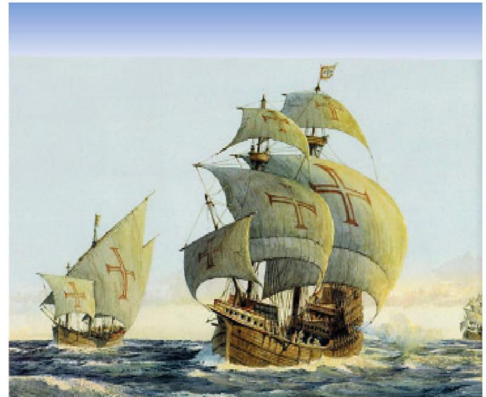
Үндістанды ашқан португал кемелері.

Мұхит суларының сырын кейін білдік... Антарктидадан ескен ызғарлы жел, Бенгель деп аталатын суық ағыс Атлант мұхитын қыста да, жазда да салқындатып тұрады. Оның суы жаздың өзінде 12 градустан жоғары көтерілмейді екен. Ал, Үнді жағы бұйығы, жаз айларында 24 градусқа дейін жылиды. Әсіресе ұшақ биігінен түсірілген суреттерде екі мұхиттың екі түске боялған