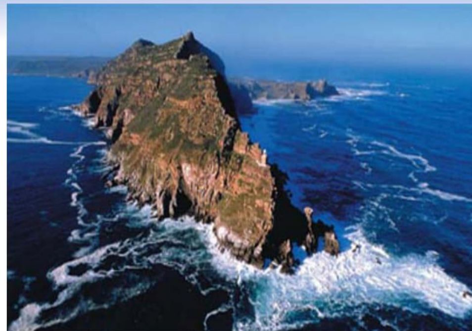
Ұшақ биігінен қарағандағы — Қайырымды Үміт мүйісі.

Қорықта «бабуин» дейтін мінезі шатақ, еркінсіп елді әбден басынған маймыл бар екен. Бәтшағарың күдірейген күдіс жон, түр-тұлғасы сүйкімсіздеу жа-