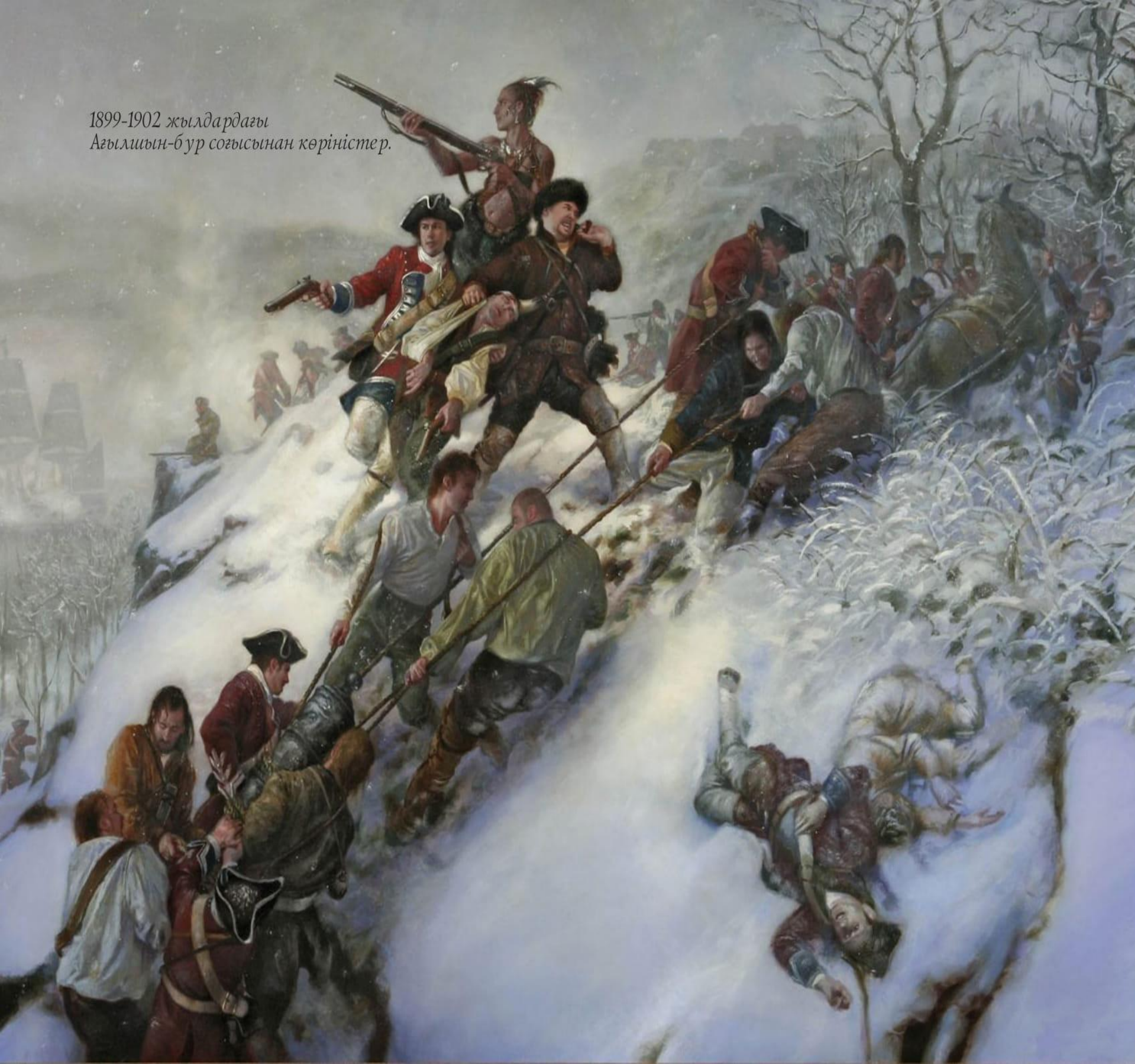
1899-1902 жылдардағы Ағылшын-бур соғысынан көріністер.