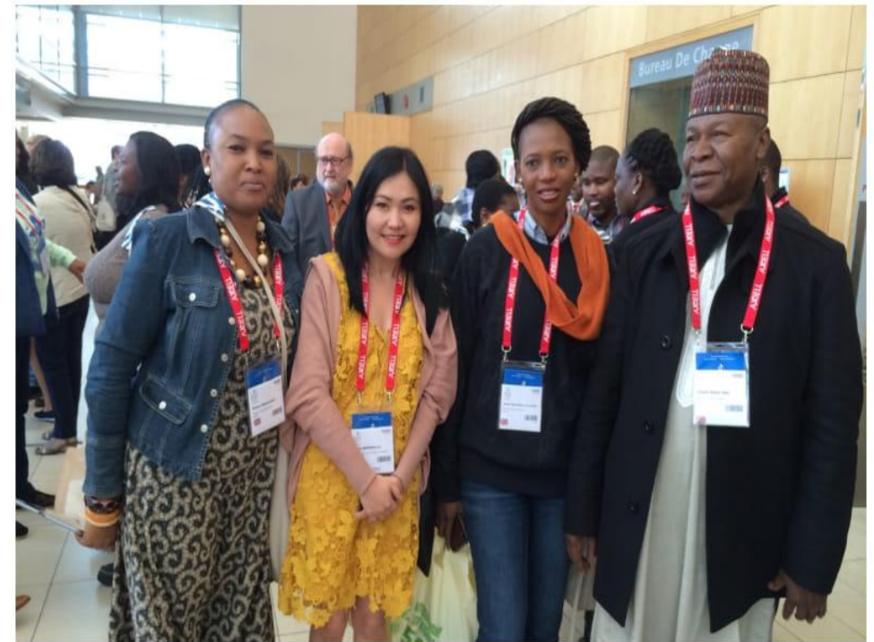
Әлем кітапханашылары Кейптаунда бас қосты.