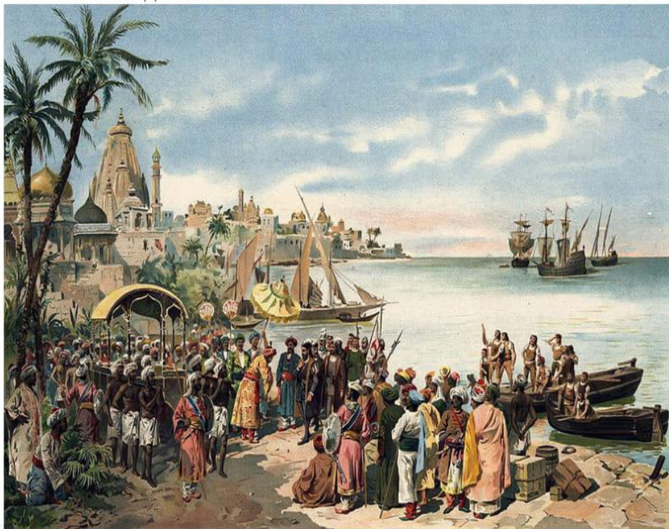
Таңғажайып Үнді жері осылай ашылды.

Әсіресе бізді қызықтырған — қанаттарын қомдап балпаңдаған пингвиндер болды. Өздері жағалауда тым көп екен. Анау аязы ақырған Антарктидадан пингвиндердің мынау маңайға қалай келгені әлі күнге жұмбақ. Біреулер арадағы екі жарым мың шақырымды жүзіп өткен десе, келесі топ «ол мүмкін емес» деп бастарын шайқасады. Екінші топтың тұжырымынша, пингвиндер мұнда «Королева Мод» жағалауындағы мұздықтардан құлаған алып айсбергтермен ілесіп келіп қалған. Содан осы араның жаймашуақ ауа райына ғасырлар бойы бейімделіп кеткен.