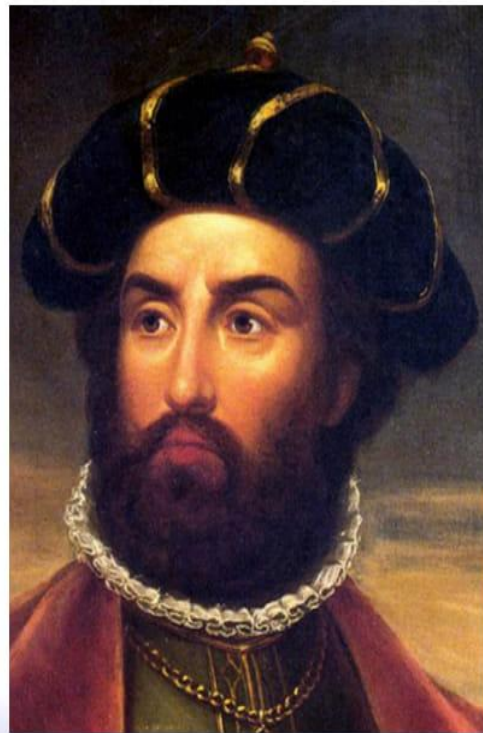
Васко да Гама.

Негізінде Қайырымды Үміт мүйісі (Мыс Доброй Надежды) Африканың оңтүстігіндегі ең шеткі нүкте саналмайды екен. Ең оңтүстік нүкте – Инелік мүйісі (мыс Игольный) деседі. Картадан Инеліктің осы Үміт мүйісінен ондаған шақырым шығыс жақта жатқанын көрдік. Алайда, алып Африка құрылығының таусылып бермес жағалауы дәл осы