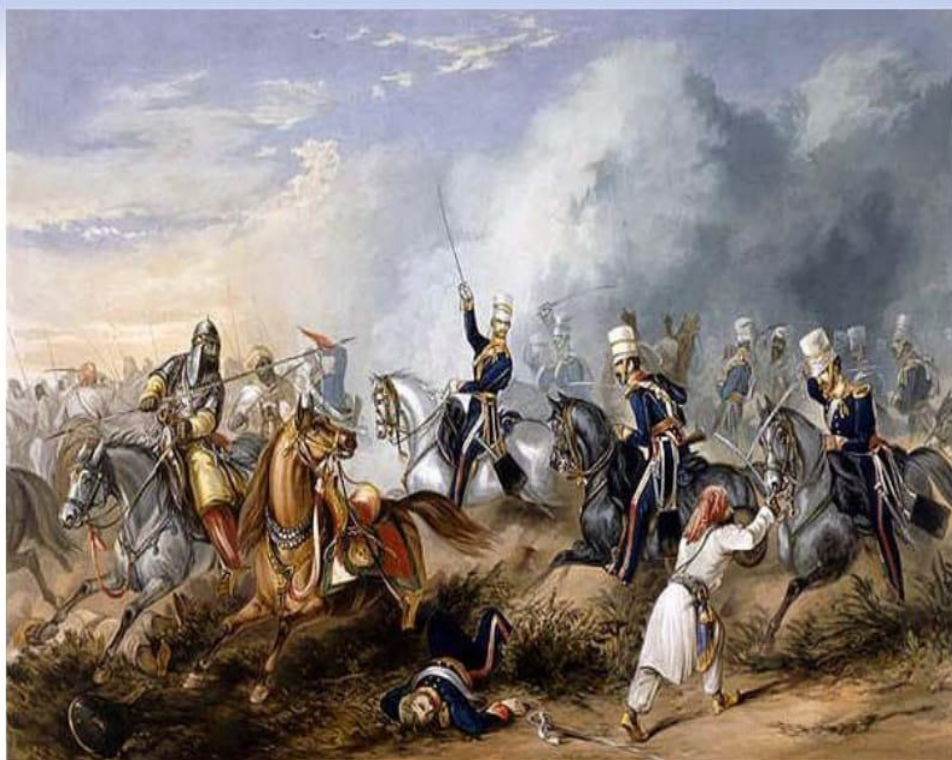
1899-1902 жылдардағы Ағылшын-бур соғысынан көріністер.

деген айып тағып, қыран мінез нар жігіттерімен қоса оны қамауға алады. Осылайша Мандела 27 жыл түрмеде отырады.