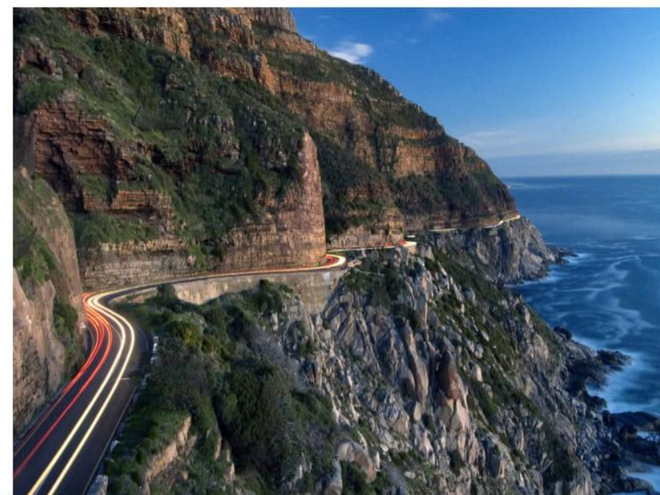
Үміт мүйісіне апаратын жолдың бірі мұхит жағалап кетеді.

Бұлардан басқа Алан Пейтон, Эскиа Мфаделе, Антджи Крог деген де жазушылардың шығармала-