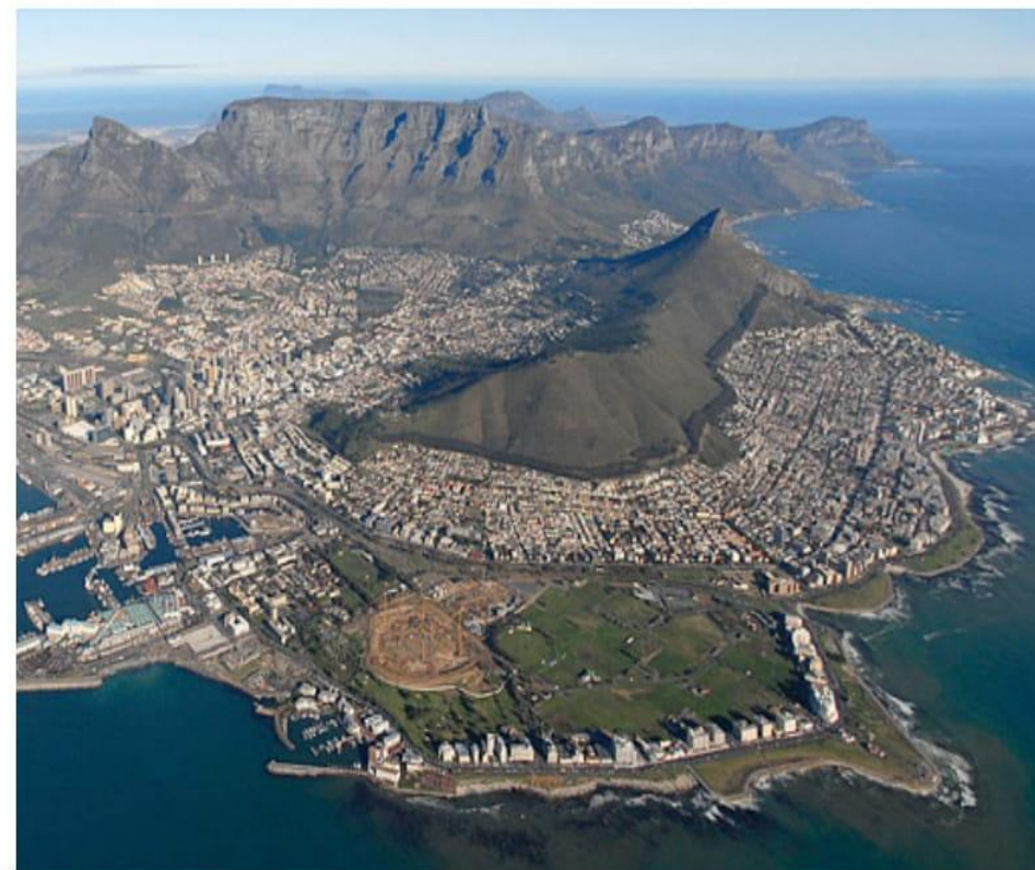
Мұхит жағалаған Кейптаун қаласының ұшақтан көрінісі.

Әрине, арадағы 4 миллион жылдың тылсым жұмбағын шешу оңай дейсің бе! Содан, осы өңірдегі «Восходящая Звезда» атты үңгір түкпірінен тағы адам кейпіндегі көптеген сүйектер табылады. Зерттей келе олар австралопитек пен бүгінгі адам арасындағы өтпелі кезеңнің түрі болып шығады. Бұдан 2 миллион жыл бұрын өмір сүрген бұл гоминид адамзат тарихындағы жаңа бет, ғылымдағы жарқын жаңалық деп таныла-