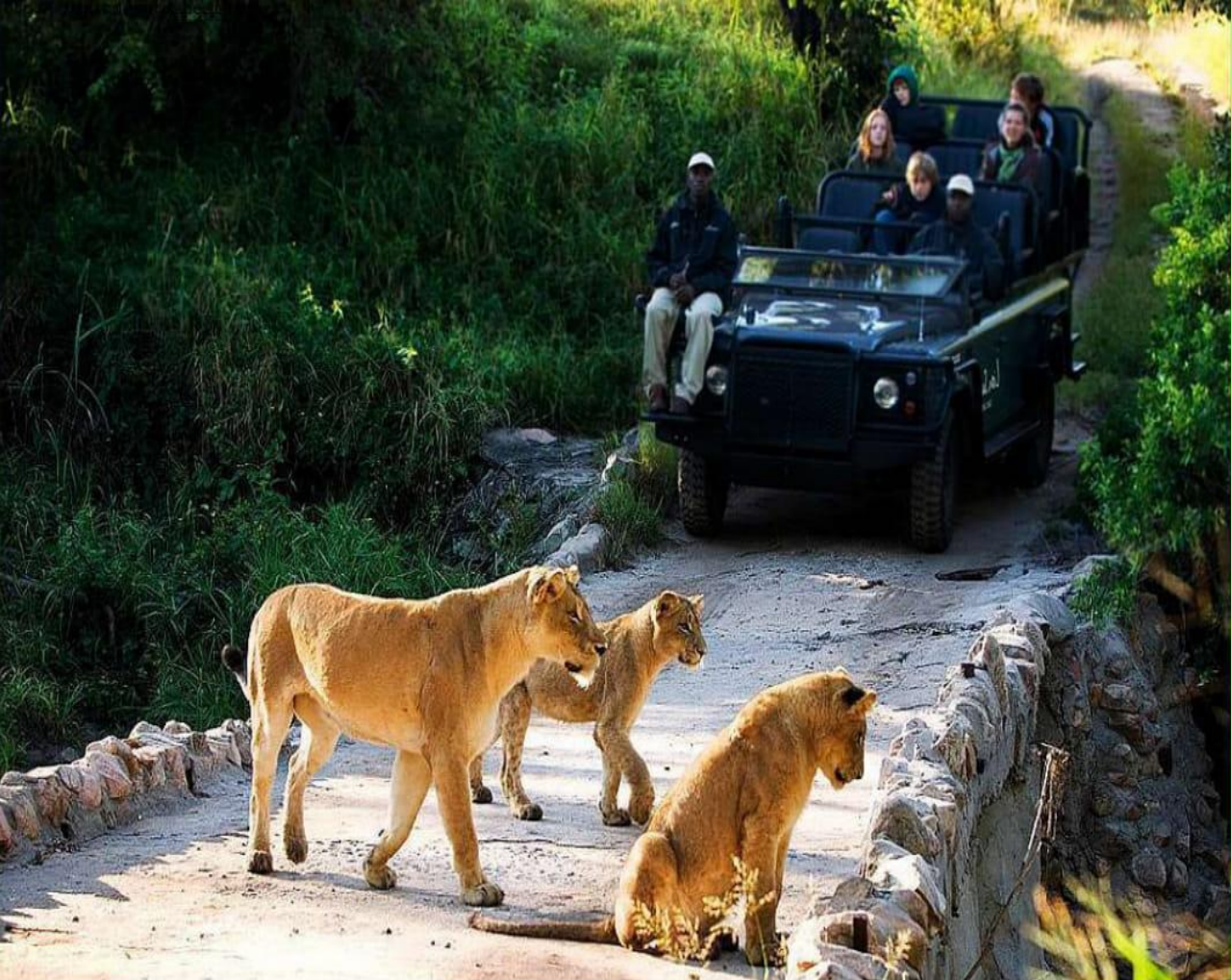
Жер төресіндей көркем Кейп түбегінің саваннасында.