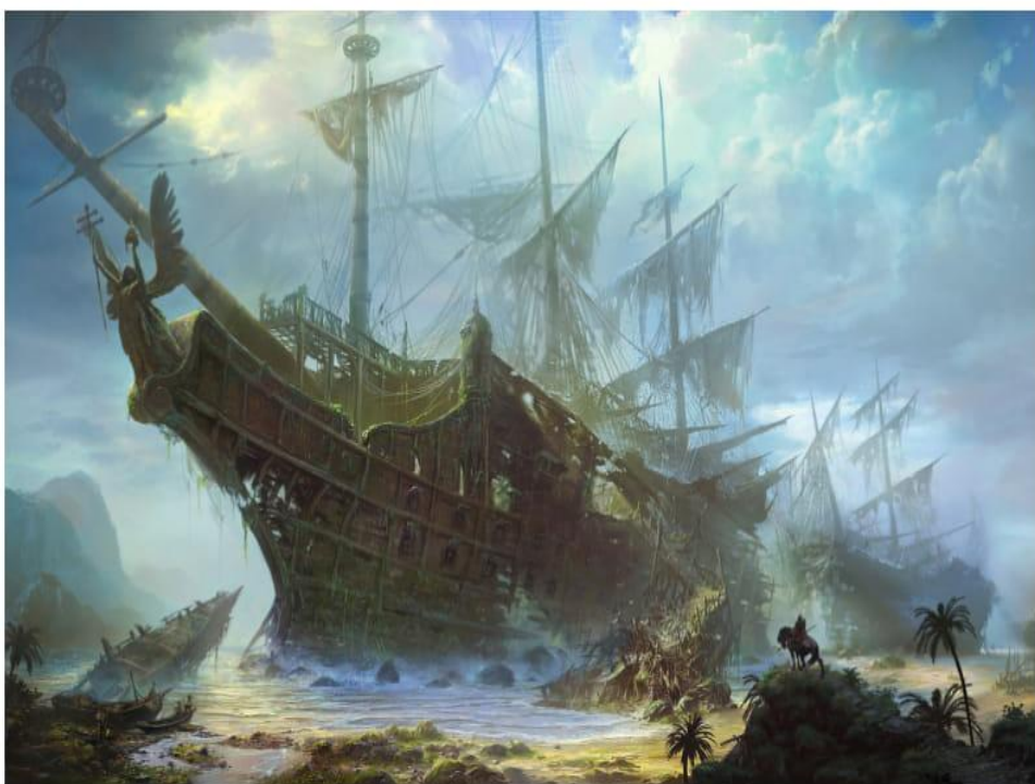
Осындай да алып кемелер болады екен!

Шүкір, тілек деген бізде жетеді ғой. Елдің тыныштығы, дос-жарандардың амандығы, бала-шаға, немерелердің болашағы дегендей, біз де білетін бірер дұғамызды ішімізден қайырып, бет сипадық.