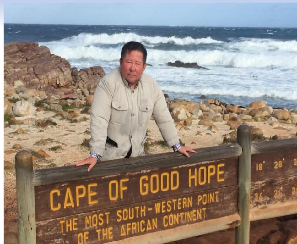
Жер шетіне қойылған арнайы белгі.

XV ғасырдың соңына қарай Португалия корольдігі Африканы айналып, Үндістанға теңіз жолын ашу әрекетімен жанталасады. Сол үшін мықты кемелерін жарақтап, білікті экспедициялар жасақтап, оларды бірінен соң бірін алыс сапарға аттандырумен болады. Амал нешік, үмітін желкен, жігерін қайық еткен небір аймүйіз теңізшілер еліне қайтып оралмай, адам естімеген алыс жақтарда опат болып жатады. 1487 жылы мұндай алмағайып тапсырма капитан Диасқа да жүктеледі.