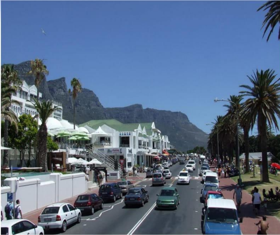
Қала көшелерінде үнемі салқын самал есіп тұрады.

Алты құрылықтың кітапханашылары мен аузы дуалы қайраткерлері бас қосқан конференцияны бетке алып, бес адамдық қазақстандық делегация да шаршап-шалдығып жеттік бұл қалаға. Арада бір күн тынығып, былайша айтқанда, жаңа климатқа бейімделіп, кейінгі үш күнде мынау жаһандық өзгерістер заманындағы кітапхананың жұртшылықты ақпараттық қамтамасыз ету миссиясы, цифрлық технологияның басымдығы жағдайында дәстүрлі кітап оқу үрдісін үзіп алмаудың жолдары, оқырманға қызмет көрсетудің соны тәсілдері, сондай-ақ әлемдік ақпарат алмасулар мен көне қолжазбаларды сақтаудың заманауи әдістерін талқылауға арналған түрлі секциялар жұмы-