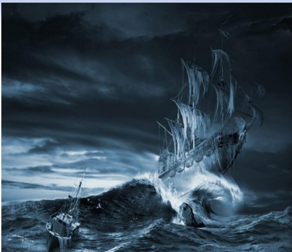
«Аруақ кемелер» кейде толқынның жалында да көрінеді деседі.

Маяк 1860 жылдың мамыр айында пайдалануға беріледі. Ол Мүйістің ең жоғары нүктесінде, мұхит деңгейінен 271 метр биіктіктен орын тебеді. Маяк сол кездегі дүниежүзі бойынша мықты құрылыстың бірі ретінде тіркеледі. Ол 80 мың шырақтан, 80 шақырым қашықтықтан жарқырап көрінетін болған, сөйтіп, Оңтүстік Африкадағы ең жарық шамшырақ саналған.