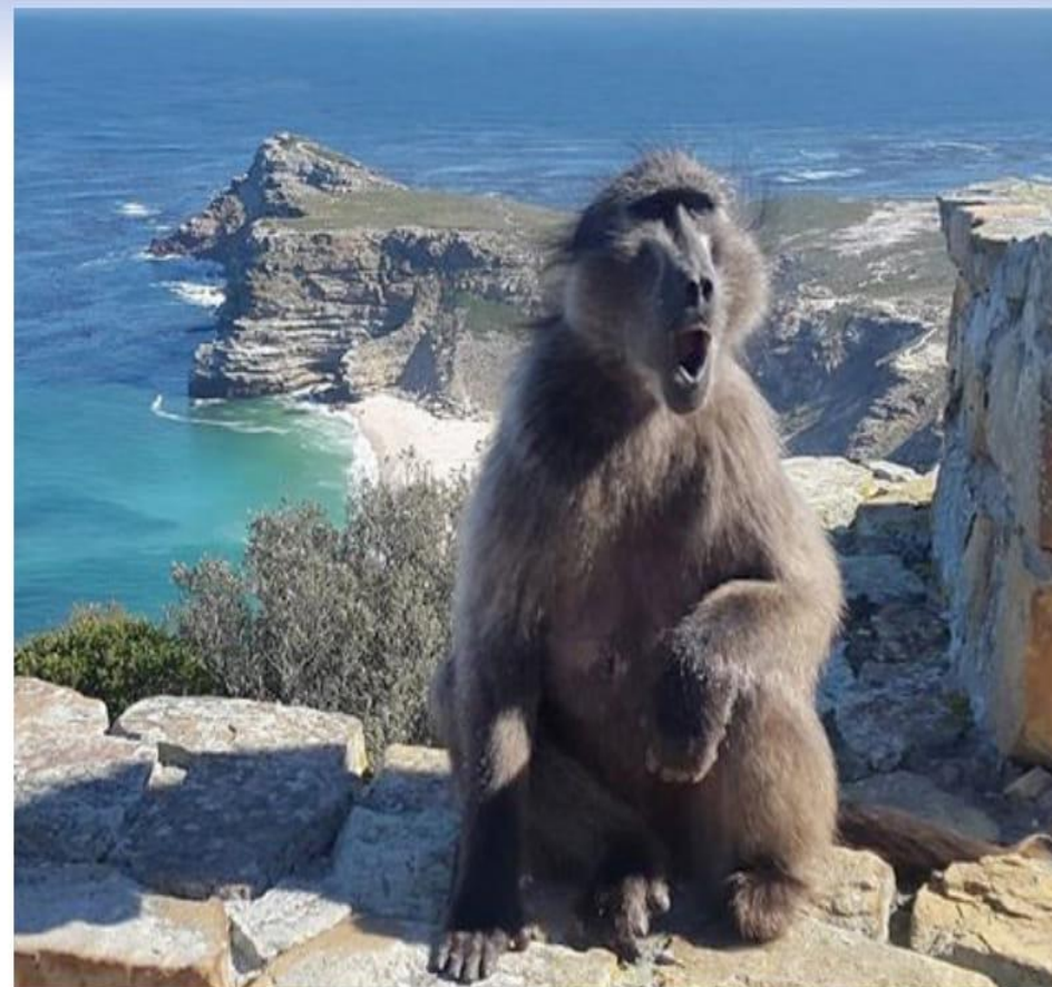
Бабун дейтін «зорлықшыл» маймыл — осы!

берген. «Бұл жақта қаңғып жүрген қандай орыс» десек, КСРО құлап, дүние астан-кестені шығып жатқан тоқсаныншы жылдардың басында Украинаның Донецкі қаласынан жайлы жер, жарқын тұрмыс іздеп осы жаққа жетіпті. Содан, орыстілді маманға зәру боп отырған туристік фирмаға орналасып, абыроймен жұмыс жасап жатқан көрінеді. Бұл өңір жердің көркі екеніне көз жеткізген соң жергілікті бір қоңыр қызбен бас құрап, бала-шаға өсіріп, мықтап орнығып қалыпты.