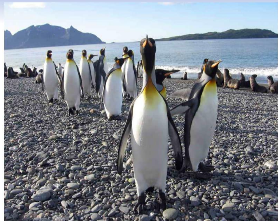
Баяғы бір замандарда Антарктидадан ауып келген пингвиндер.

Қырғыстанған шоқатты, ойқы-шойқы қалың адырмен келе жатырмыз. Түстік көкжиекте бір-біріне иек арта жағаласқан таулар тізбегі Үміт мүйісіне дейін бізбен жарысқан. Жолай «Мыс Доброй Надежды» атты мемлекеттік қорықтың жерін жағалап өттік.