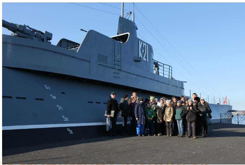
В Мурманске посетили монумент «Алеша», памятник «Ждущая» и музей в подводной лодки К-21