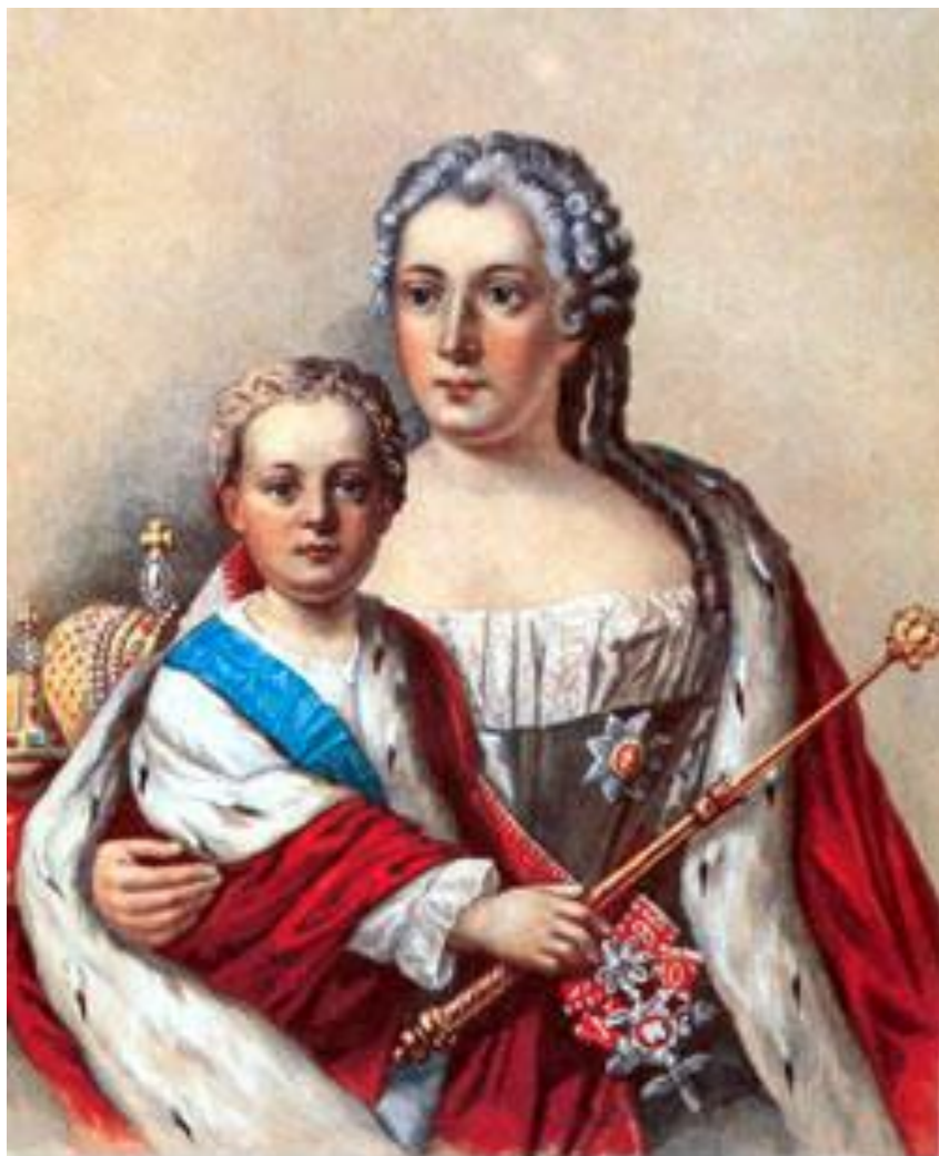
Иоанн VI Антонович (1740-1764)

1740-1741 гг. - Иван VI Антонович (Анна Леопольдовна) (1740-1741 гг.)