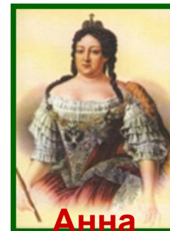
Анна Иоаннов на 1730-1740