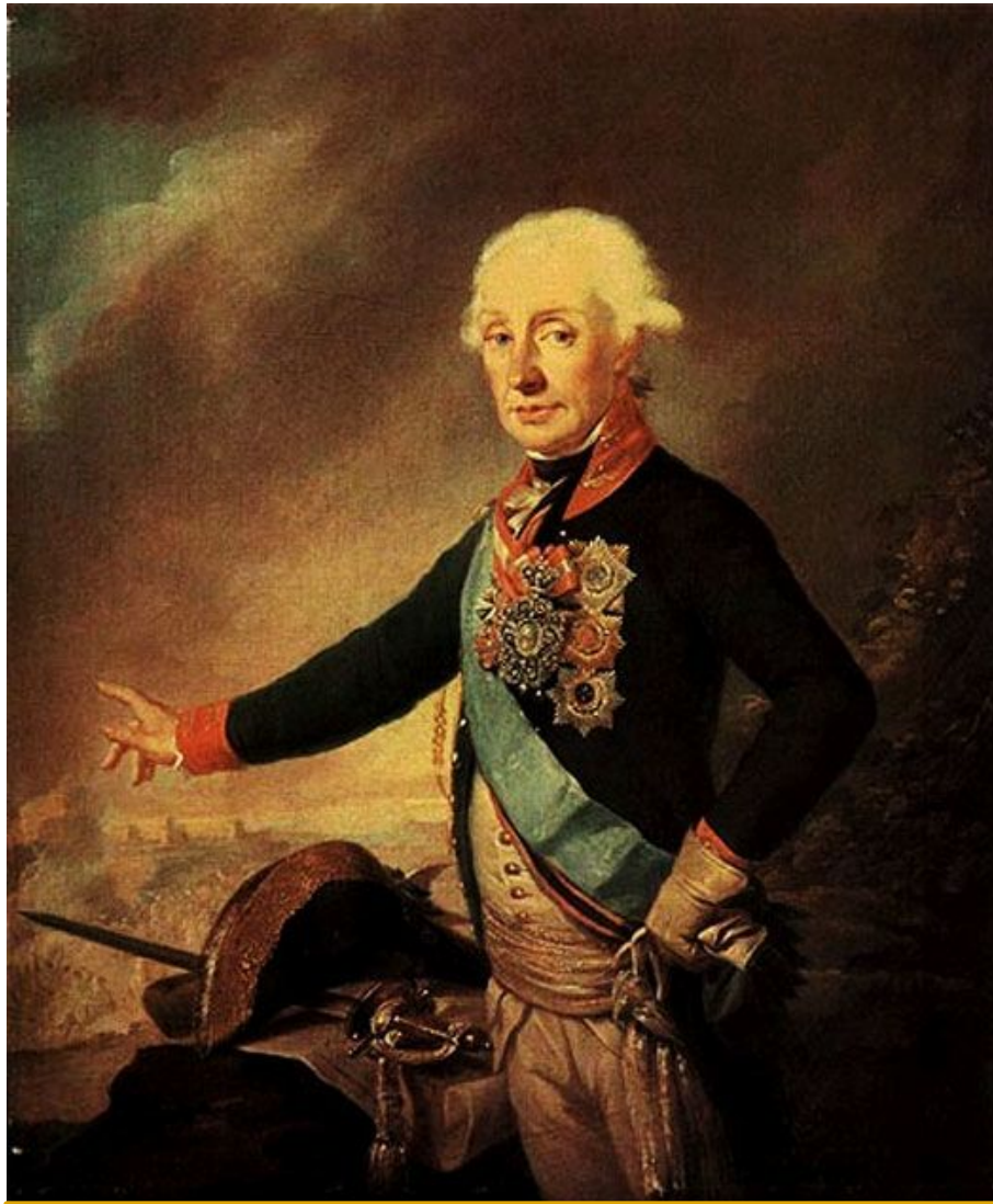
Суворов А. В.

В сражениях Семилетней войны происходит становление талантливых русских полководцев П.А. Румянцева и А.В. Суворова.