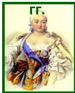
Елизавета Петровна 1741-1761 гг.