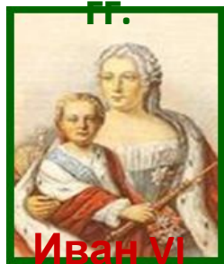
Иван VI Антонов ич и Анна Леополь довна 1740-1741