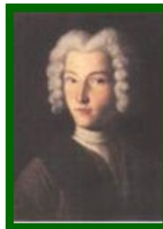
Петр II 1727-1730