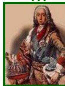
Петр III 1761-1762 гг.