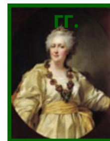
Екатери на II 1762-1796 гг.