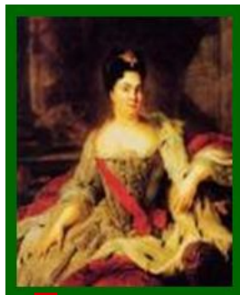
Екатери на I 1725-1727