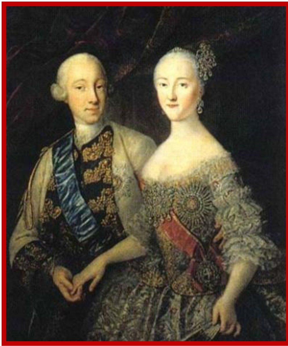
Пётр и Екатерина: совместный портрет