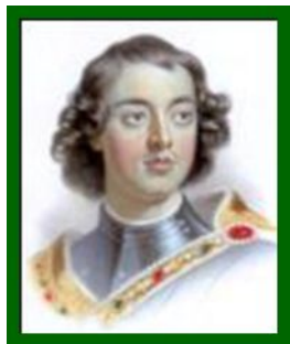
Петр I 1682-1725