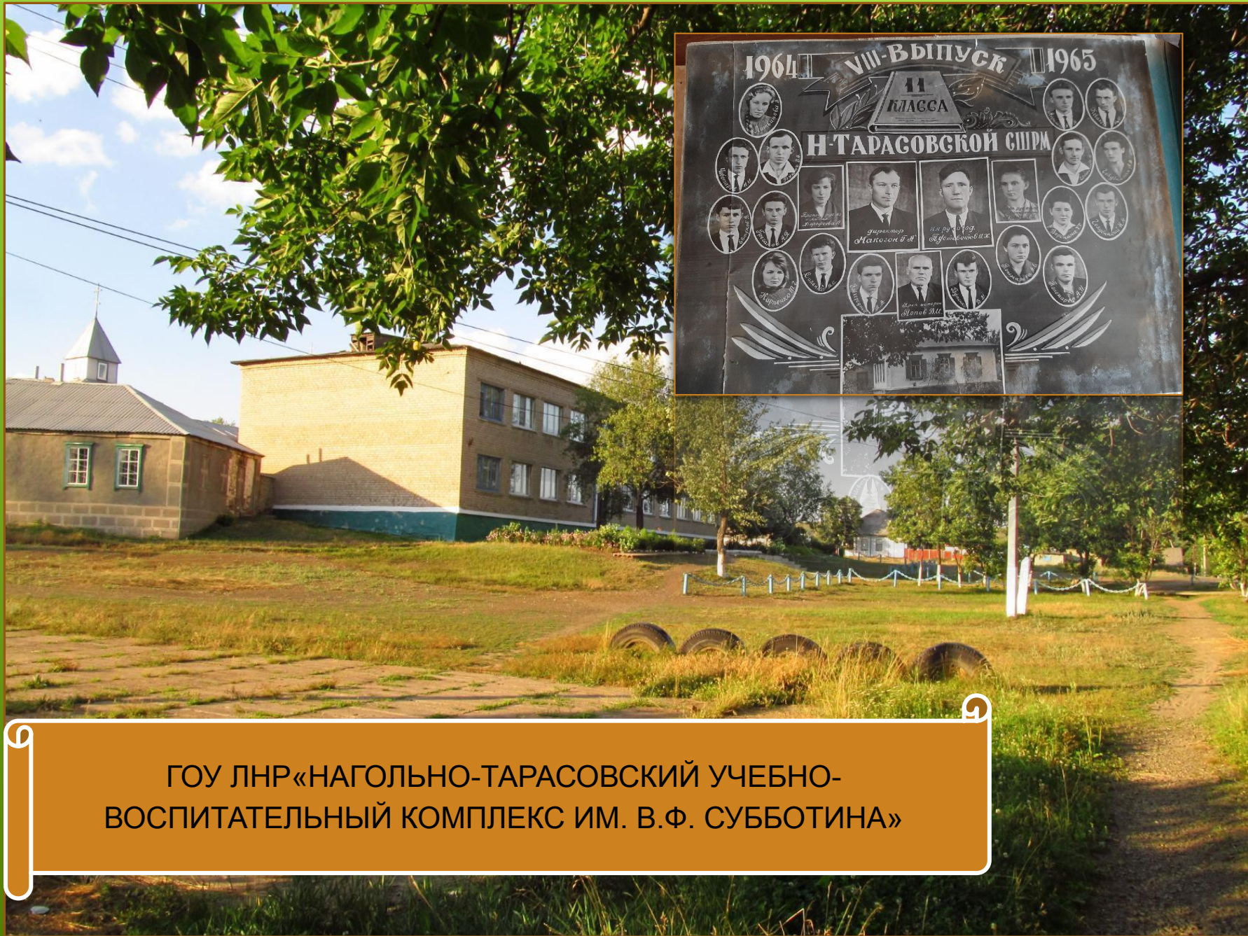
ГОУ ЛНР «НАГОЛЬНО-ТАРАСОВСКИЙ УЧЕБНО-ВОСПИТАТЕЛЬНЫЙ КОМПЛЕКС ИМ. В.Ф. СУББОТИНА»