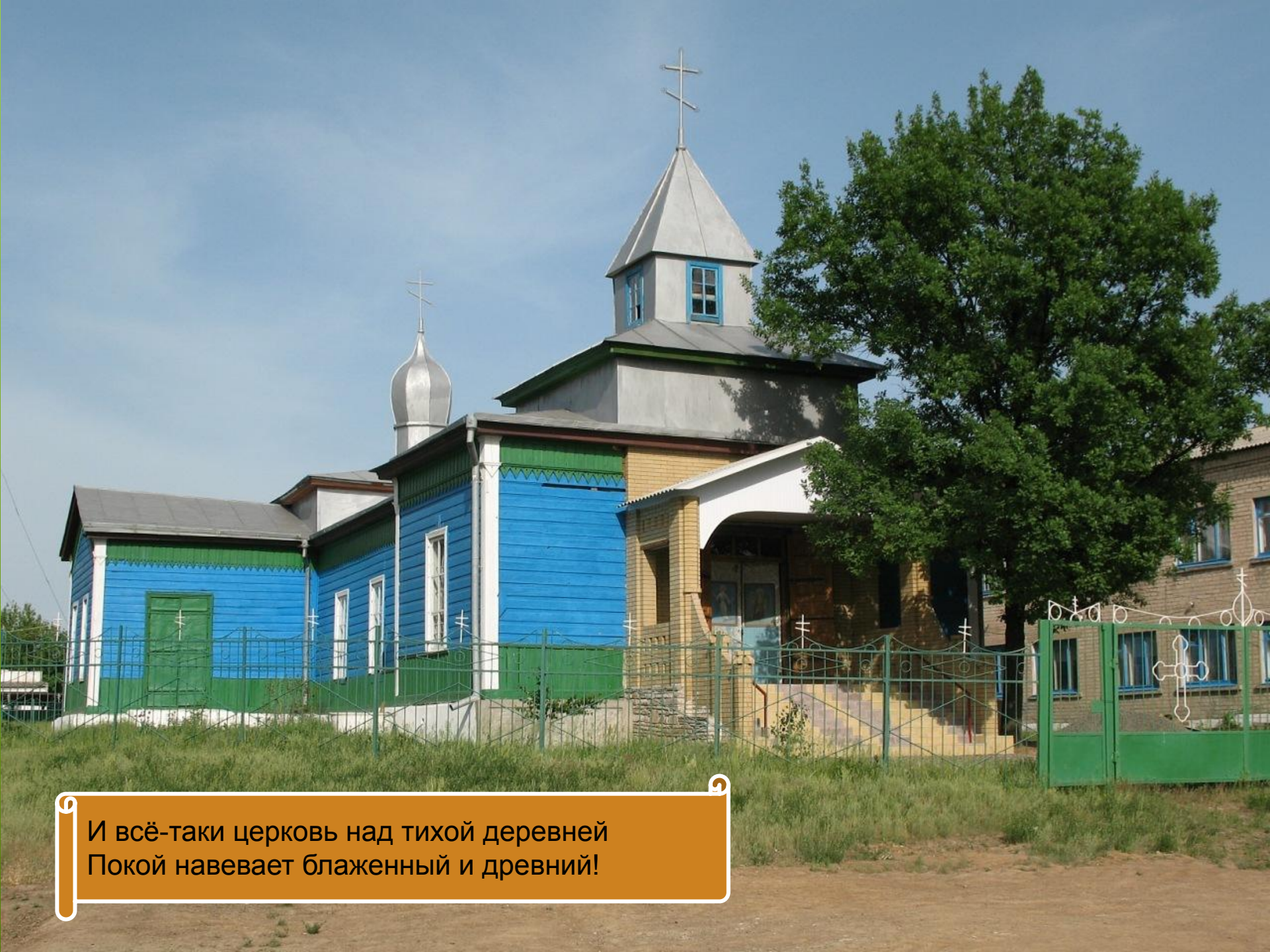
И всё-таки церковь над тихой деревней Покой навеваает блаженный и древний!