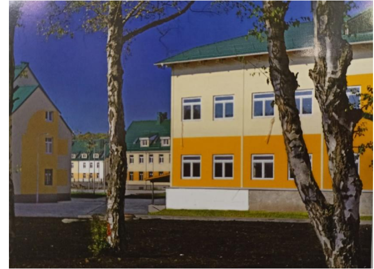
Общежитие для военнослужащих ВКО

Мне предоставили выбор в задании, а именно выбрать объект для работы. Все объекты находятся в Калининградской области. Мне дали выбрать одно из военных сооружений: общежитие для военнослужащих войск ВКО, учебный корпус. Я выбрал общежитие просто потому, что оно было первое. А так для меня было взяты за оба задания.