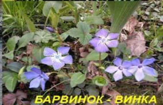
БАРВИНОК - ВИНКА