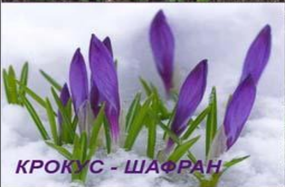
КРОКУС - ШАФРАН