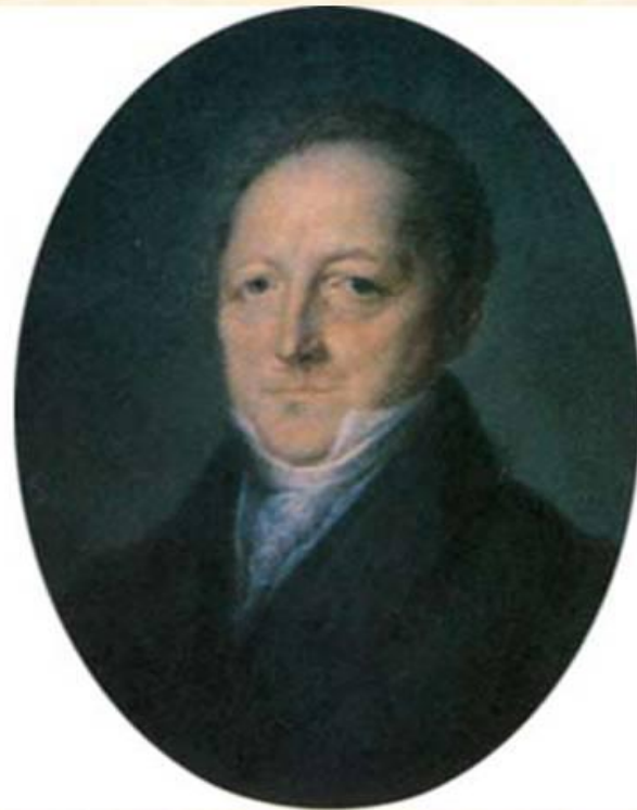
Отец Пушкина — Сергей Львович (1767—1848)