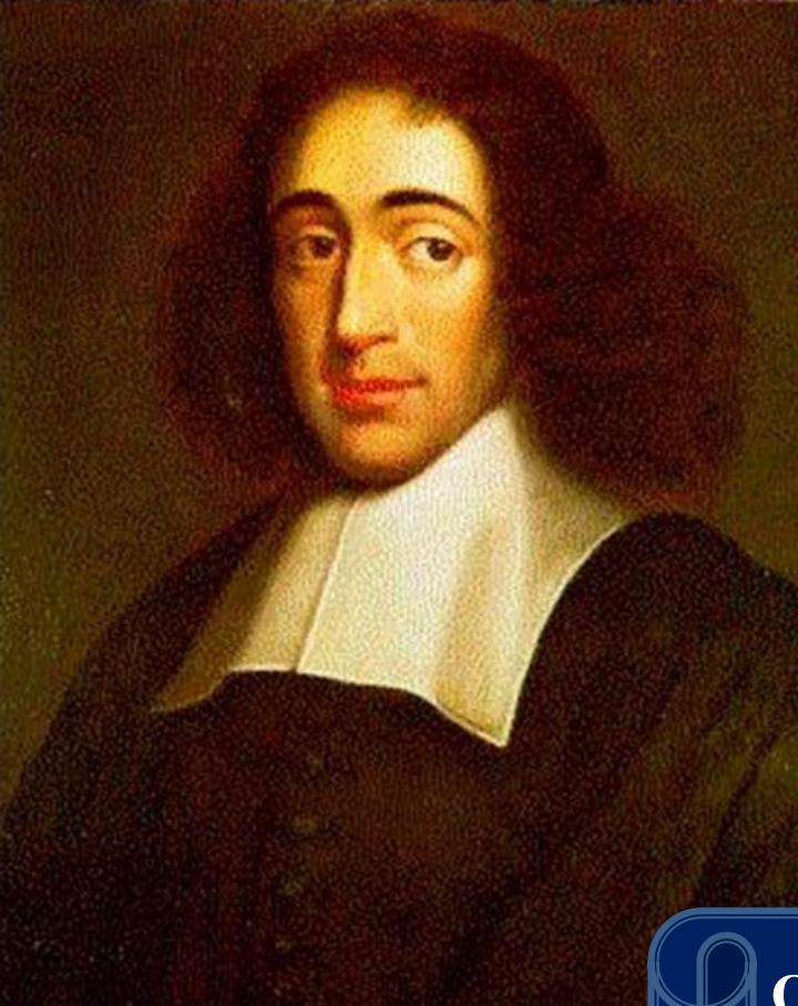
Бенедикт Спиноза (1632— 1677)

Под субстанцией я разумею то, что существует само в себе и представляется само через себя