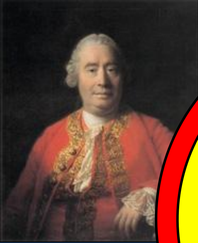
Давид Юм (1711-1776)

Умозаключение о наличии каузальной связи на основании последовательнос ти во времени – результат логической ошибки.