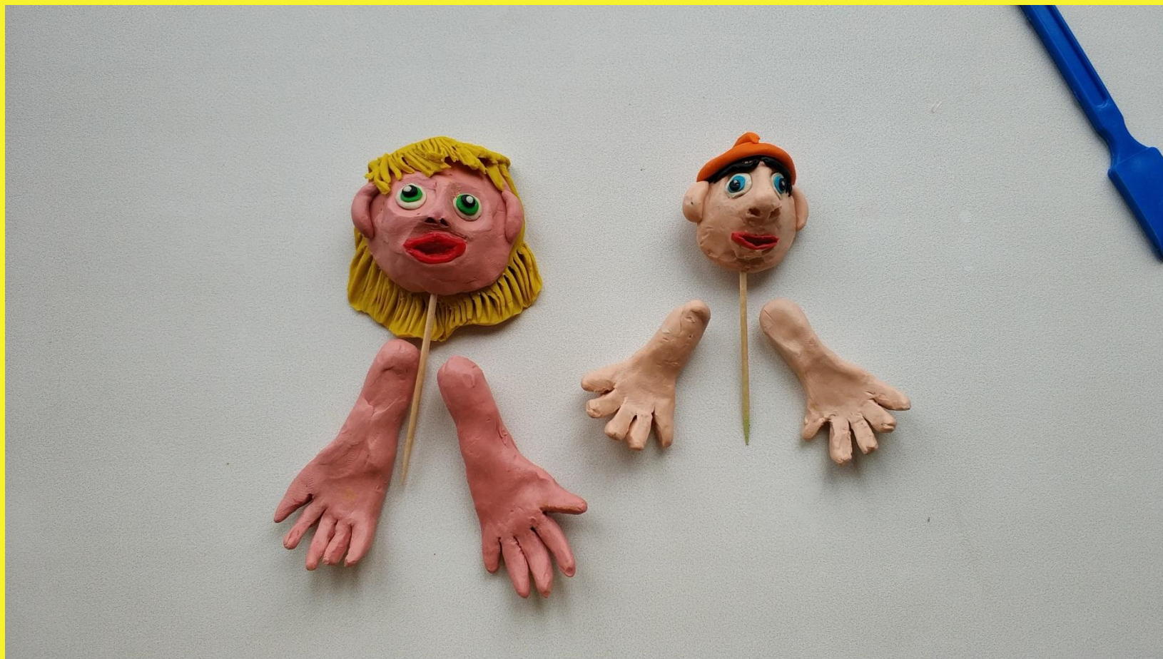
ФОТО ДЕВОЧКА И ПОЖАРНЫЙ