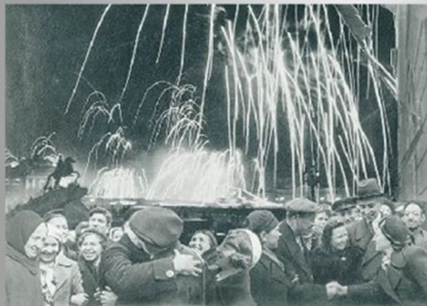
«БЕЛЫЙ ПОБЕДА ОДЕРЖАНА СОВЕТСКИМИ ВОЙСКАМИ ПОД ЛЕНИНГРАДОМ!»