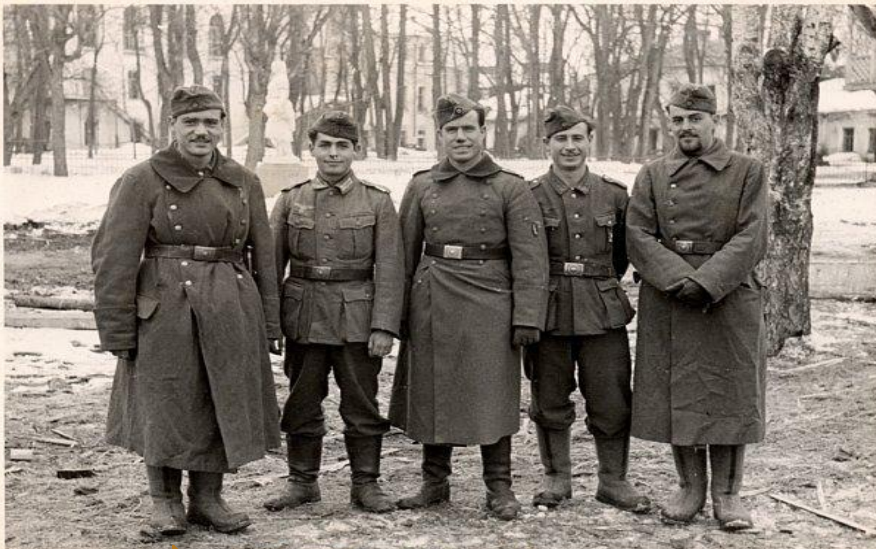
Novgorod - (Russia)