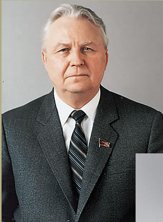
Михаил Сергеевич Соломенцев