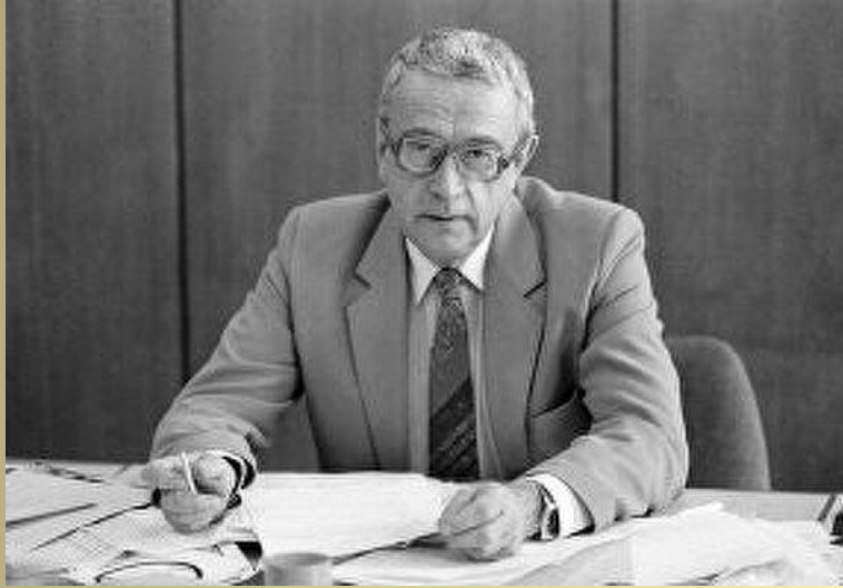
Егор Владимирович Яковлев

Гласность - политика СССР в духовной и культурной жизни страны, которая подорвала основные устои советского общества. В результате были созданы условия, когда в сознании населения зародилась и укрепилась мысль, что на Западе все намного лучше.