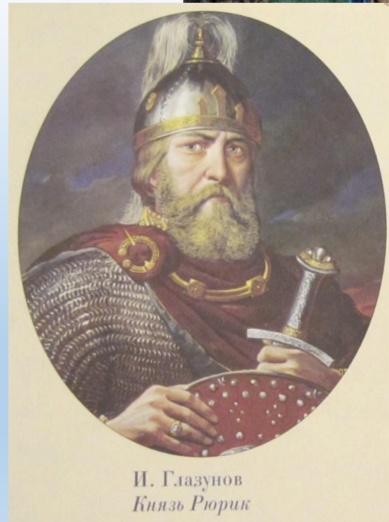
И. Глазунов Князь Рюрик