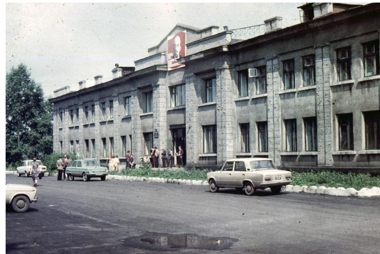
Шахта «Нагорная», г. Новокузнецк