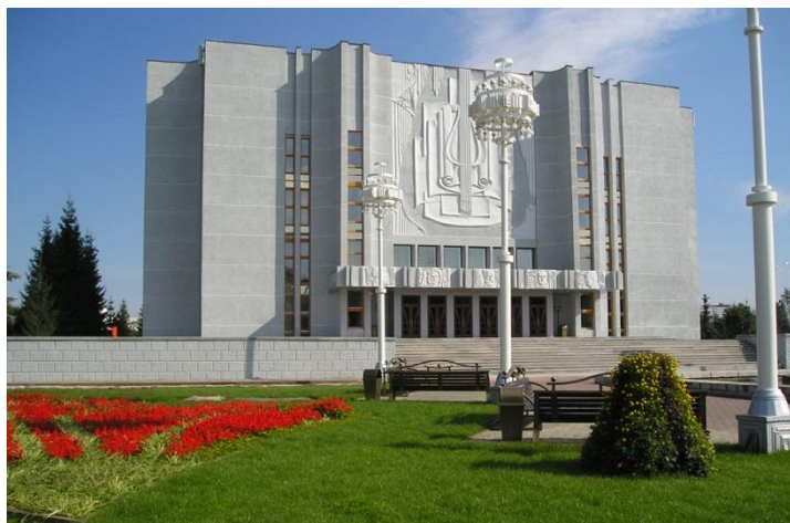
Областная филармония, г. Кемерово