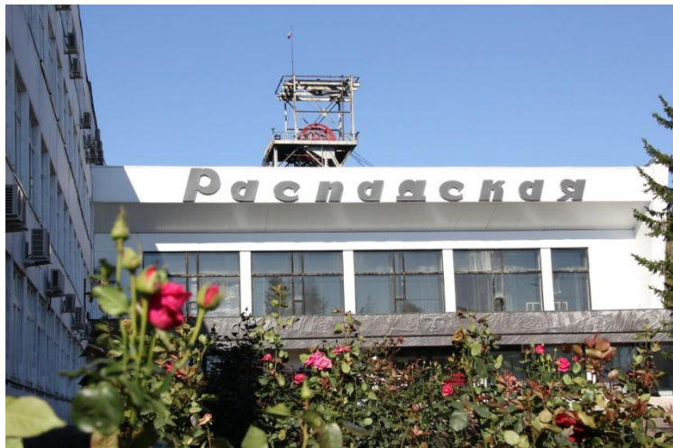
Шахта «Распадская», г. Междуреченск