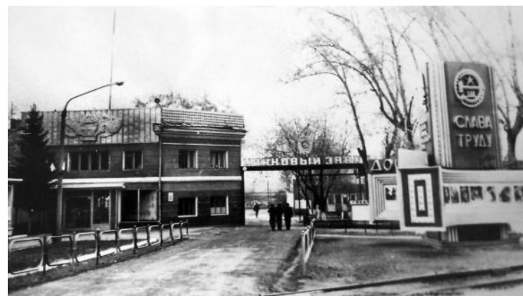
Беловский цинковый завод, г. Белово