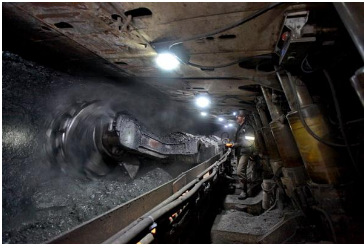
Шахта им. 7 ноября, г. Ленинск - Кузнецкий