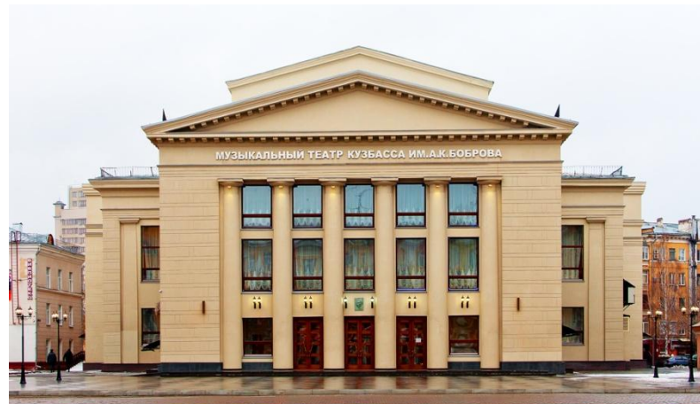
Театр оперетты, г. Кемерово