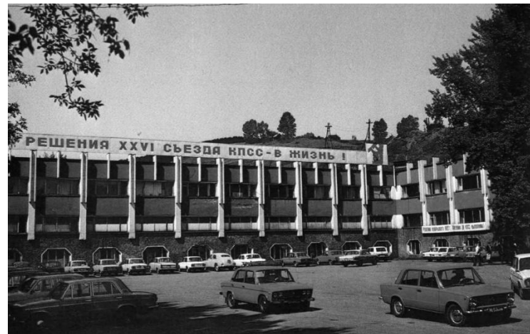
Шахта «Зыряновская», г. Новокузнецк