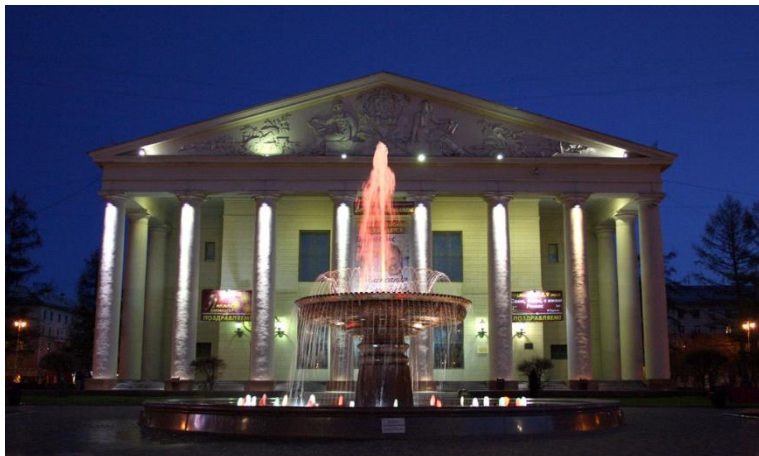
Драматический театр, г. Кемерово

К 1978 году в области насчитывалось 955 клубов, 1 213 библиотек, до 1200 киноустановок, 9 музеев, 6 театров.