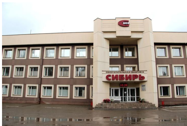
Центральная обогатительная фабрика «Сибирь» г. Мыски