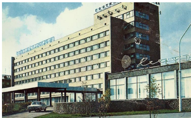
Гостиница треста «Кузнецкпромстрой», г. Новокузнецк