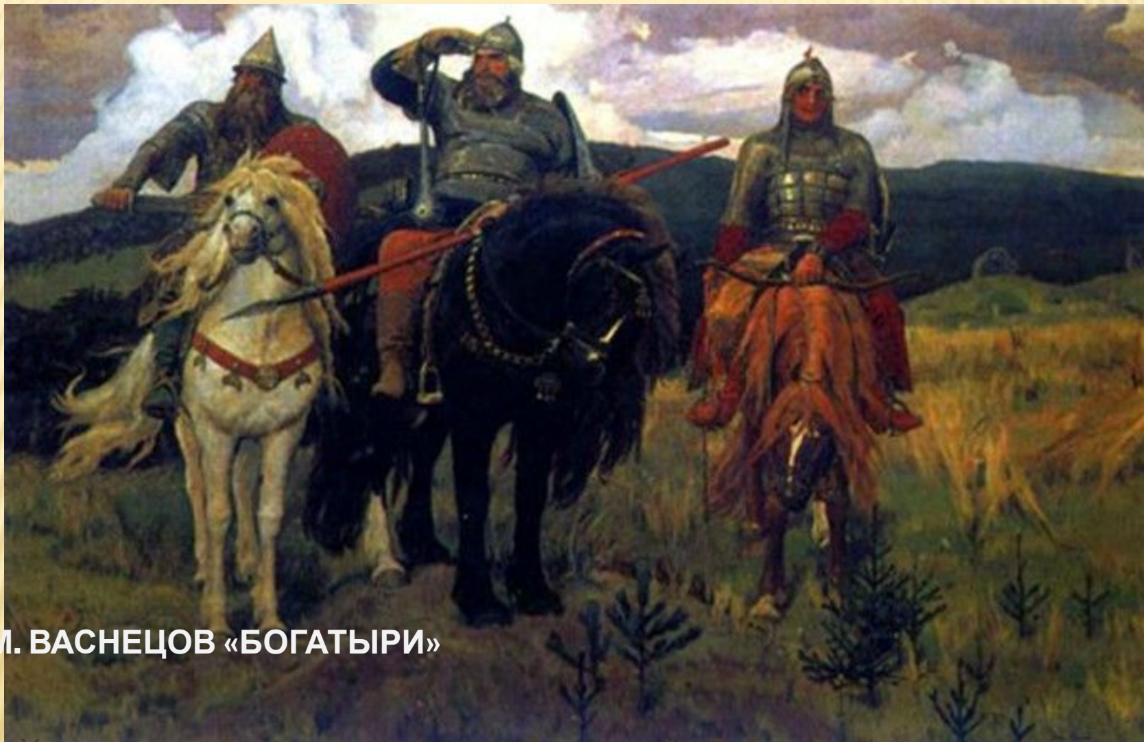
В. М. ВАСНЕЦОВ «БОГАТЫРИ»

Художник изобразил трех русских богатырей - Добрыню Никитича, Илью Муромца и Алёшу Поповича. Долгие годы они охраняли рубежи Руси от кочевников.