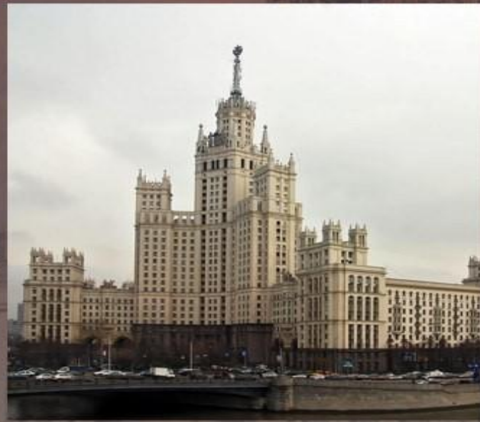
Жилой дом на Котельнической набережной