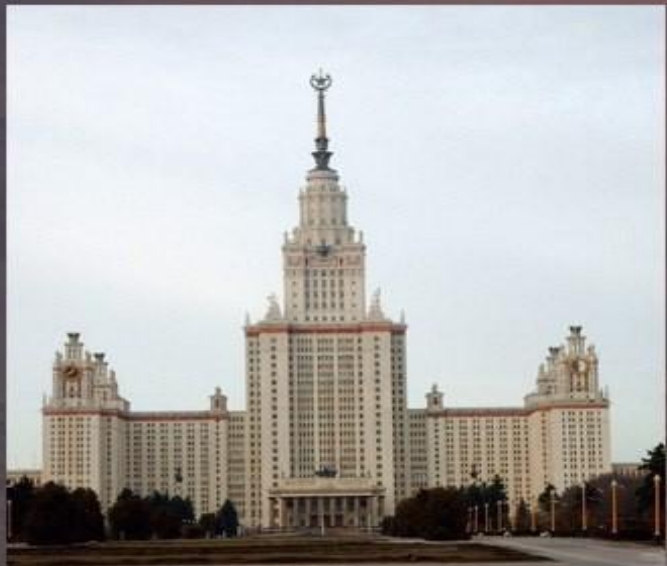
Главный корпус МГУ