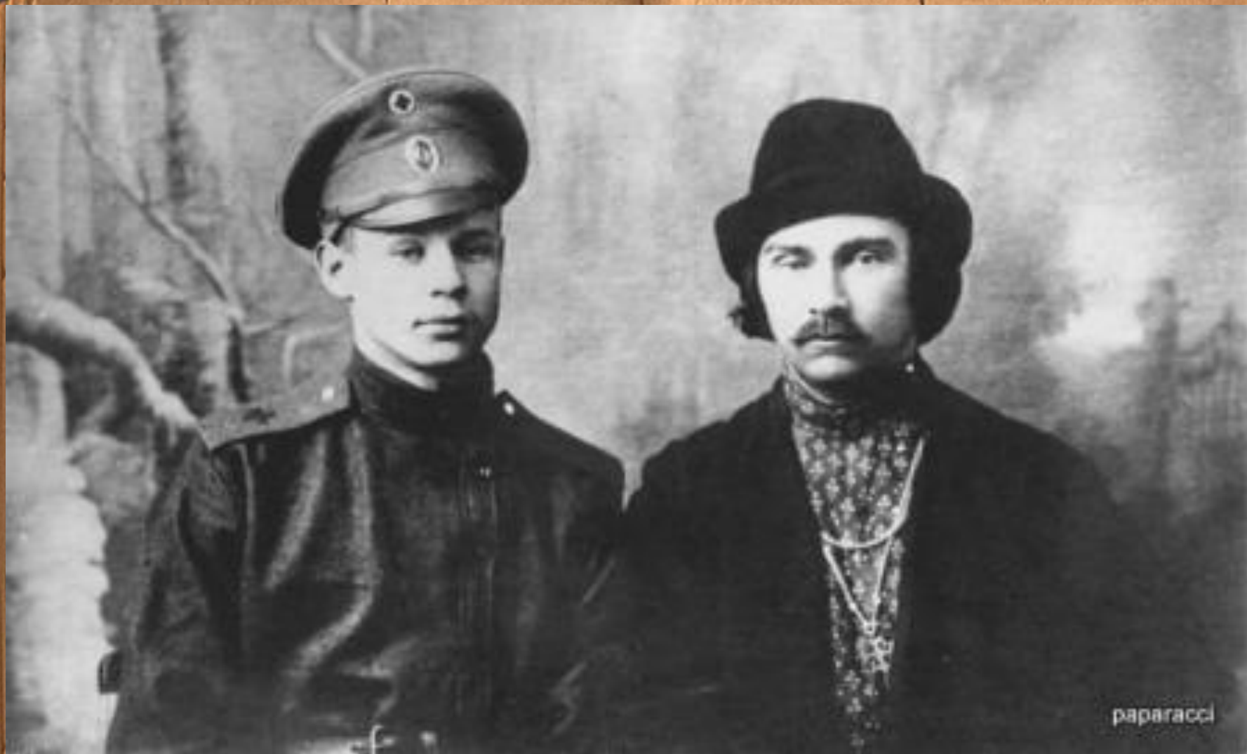
Есенин с Клюевым