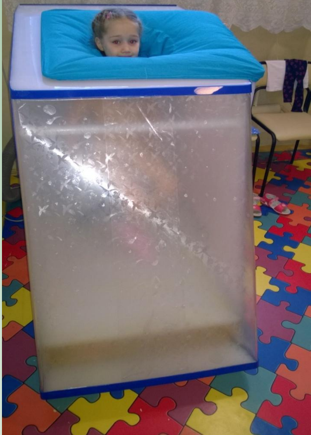
Сухая углекислая ванна