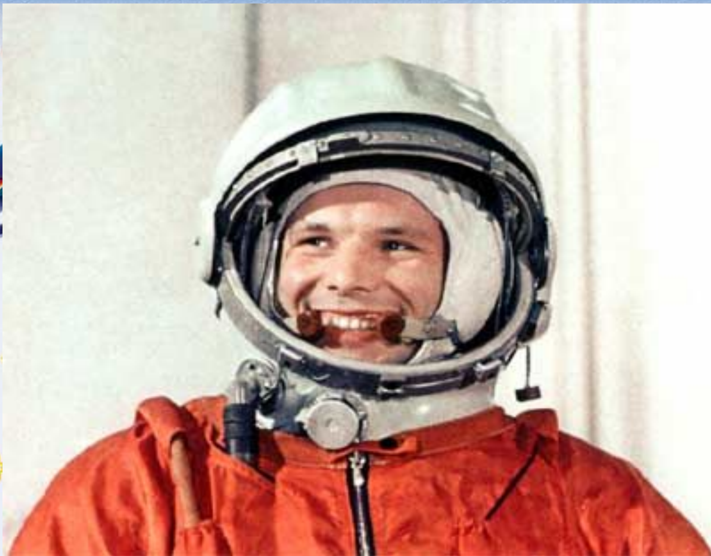
Юрий Алексеевич Гагарин