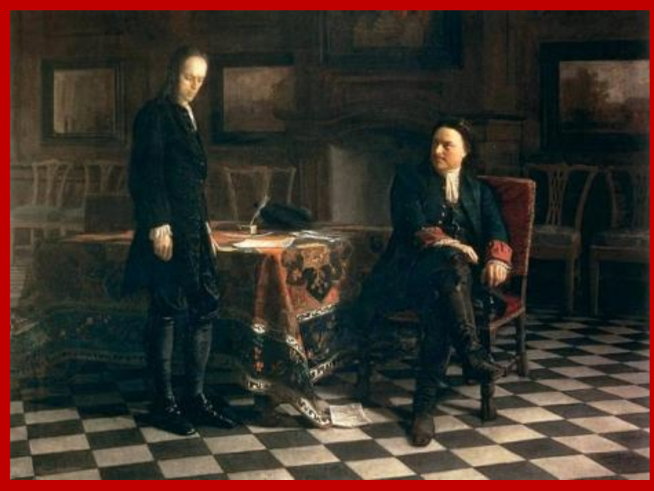
Николай Ге. Петр I допрашивает царевича Алексея Петровича в Петергофе