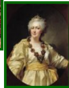
Екатерина II 1762-1796