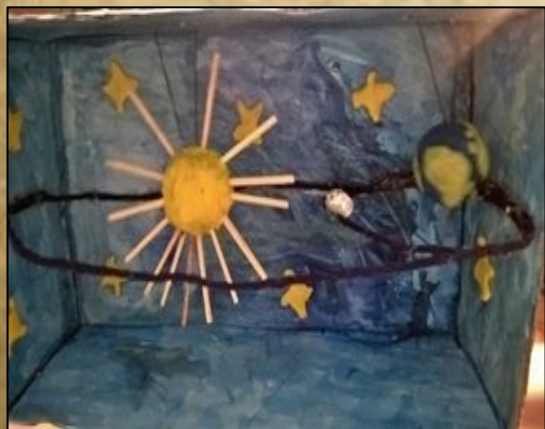
Наша поделка « Солнечная система »