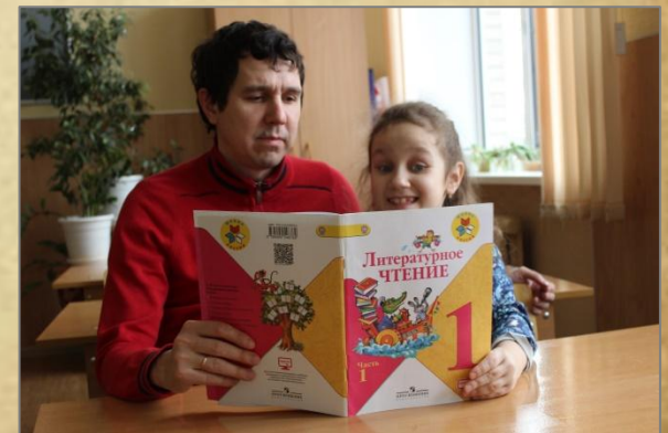
Готовимся к конкурсу чтецов.