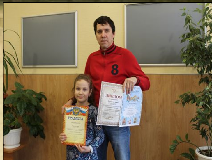
Мы активно участвуем во всех конкурсах , Наши достижения.