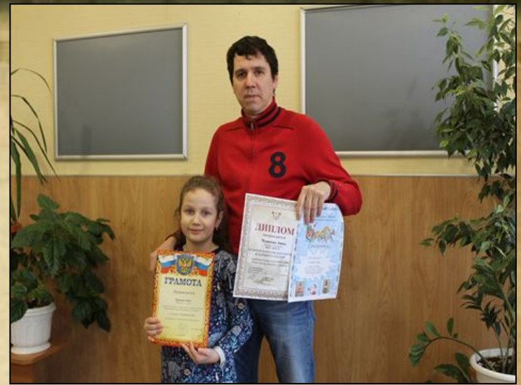
Мы активно участвуем во всех конкурсах , Наши достижения.