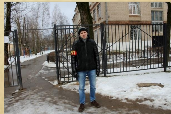
Участвует в акции «Отцовский патруль»