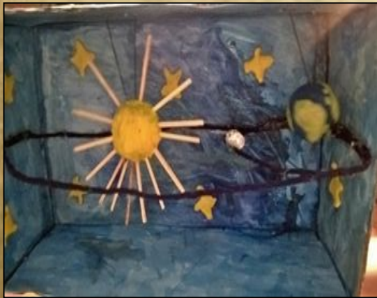
Наша поделка « Солнечная система »