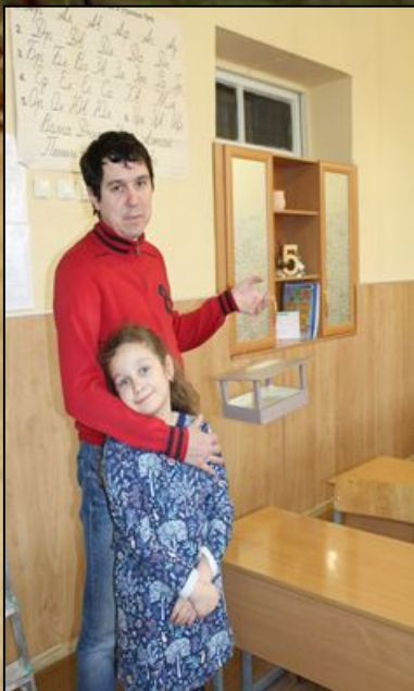
Акция « Покормите птиц зимой » Сделали с папой кормушку для птиц.