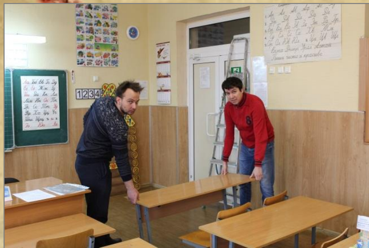
Помогает школе : участвует в ремонте класса, входит в состав родительского комитета .