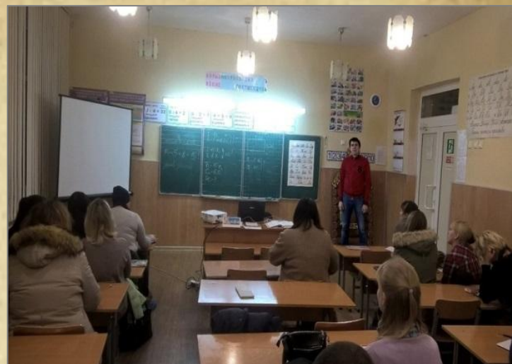
Выступает на родительском собрании