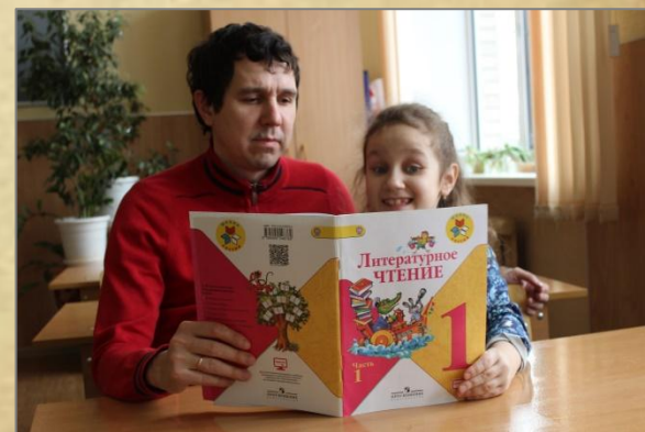
Готовимся к конкурсу чтецов.