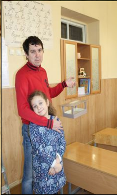
Акция « Покормите птиц зимой » Сделали с папой кормушку для птиц.