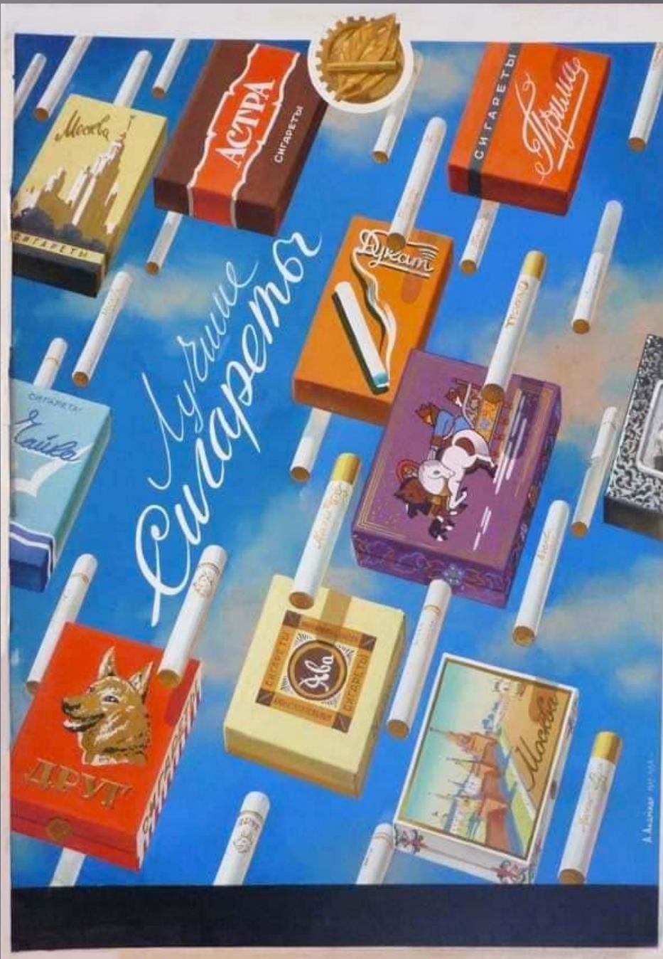
А. П. Андреади. «Лучшие сигареты», 1947–58 гг. Бумага, гуашь; 87х60