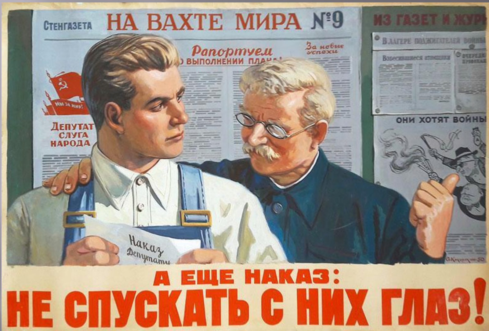
Кокорекин А. А. «А ещё наказ не спускать с них глаз» 1950. Бумага, гуашь; 79x117