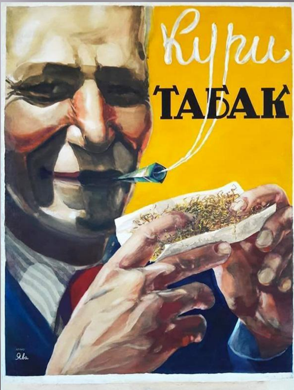
К. М. Кузгинов. «Кури те табак», 1940-50-е. Бумага, гуашь; 92x78