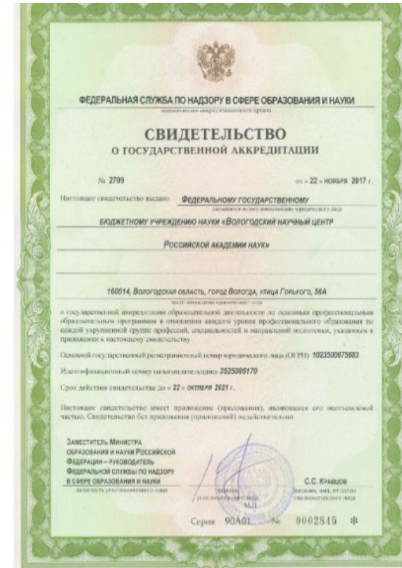
Свидетельство о государственной аккредитации (№ 2709 серия 90А01 № 0002845 от 22 ноября 2017 г.