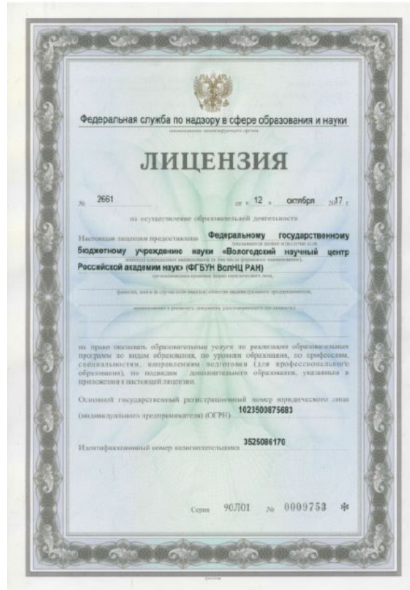
Лицензия на осуществление образовательной деятельности № 2661 серия 90Л01 № 0009753 от 12 октября 2017 г.