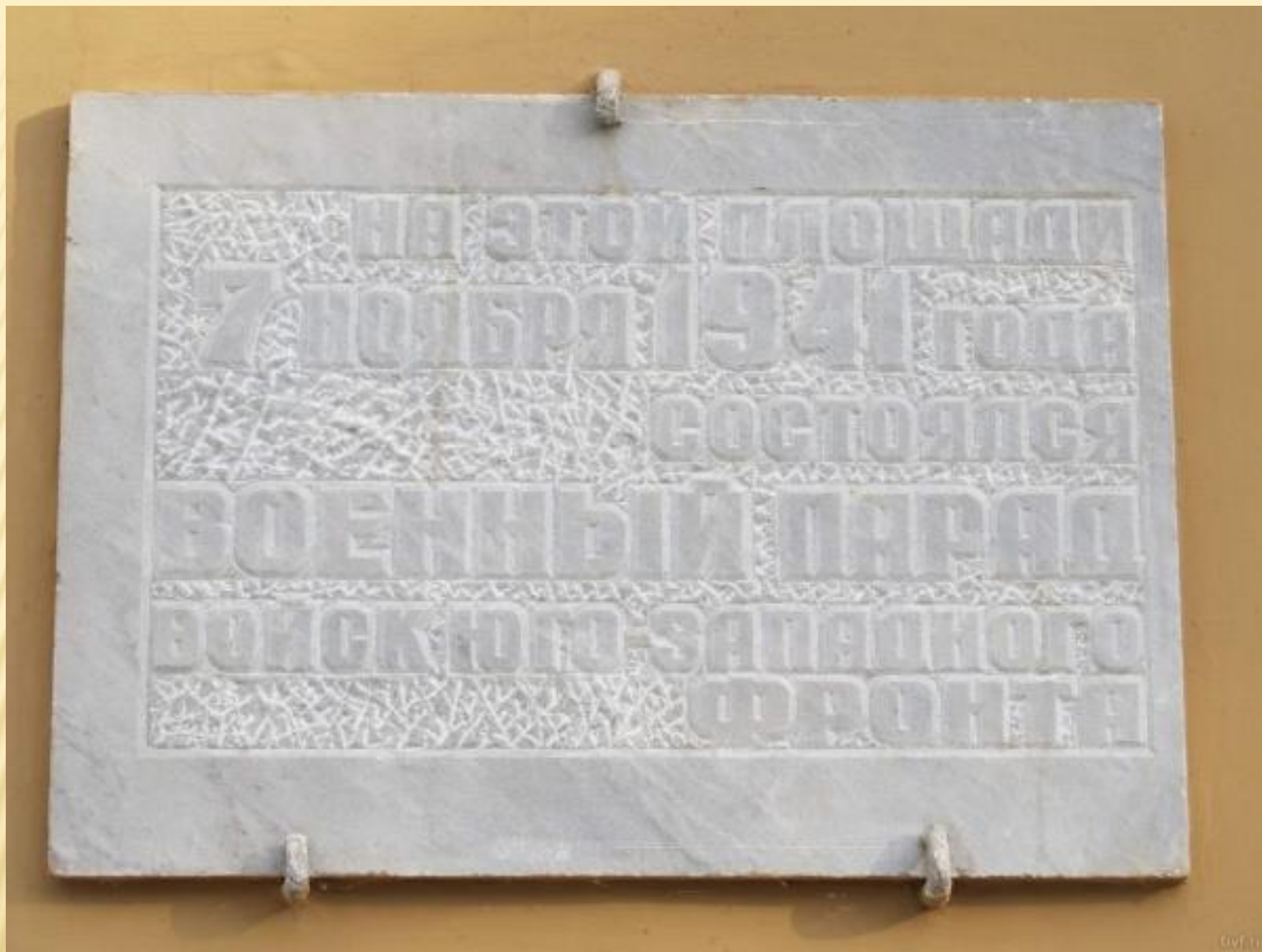
Памятная доска на фасаде здания Никитинской библиотеки