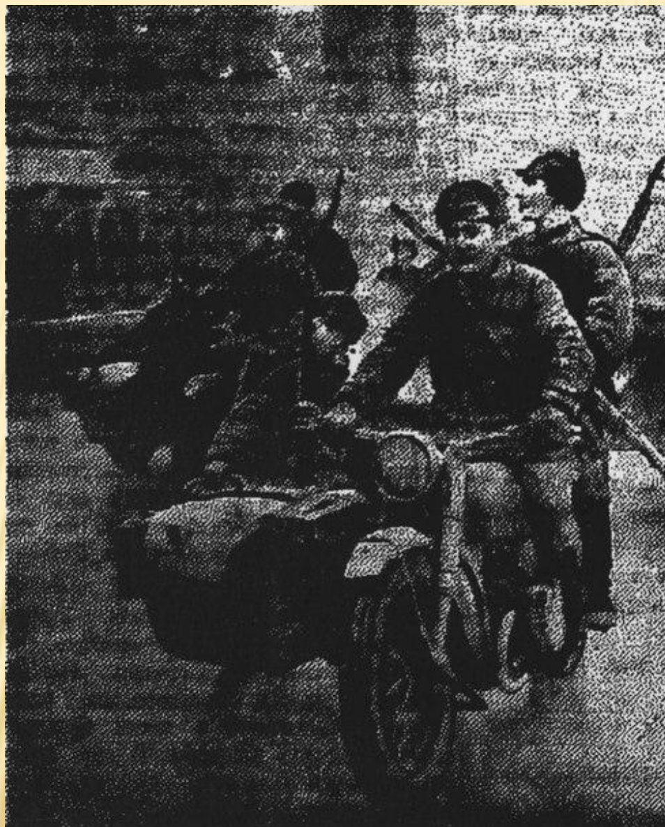
Мотоциклисты на параде 7 ноября 1941 г.