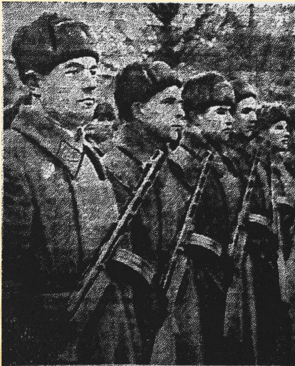
Бойцы 327-й стрелковой дивизии, вооруженные ППШ