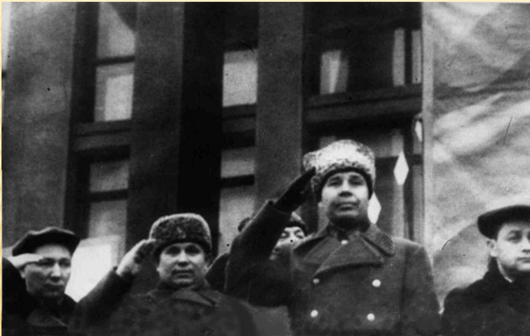
С трибун горожан приветствовали маршал С.К. Тимошенко и будущий первый секретарь ЦК КПСС Н.С. Хрущев.