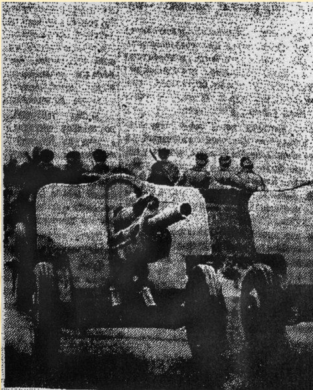
76-мм пушки (обр. 1939) в парадном строю