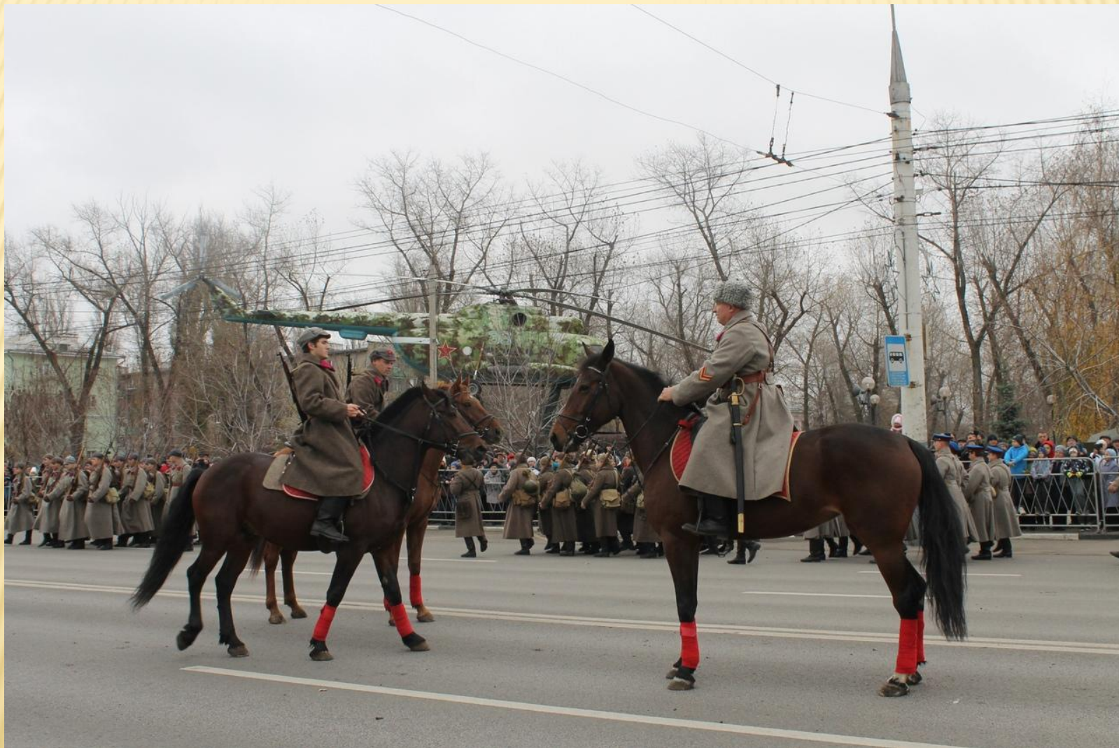
Фотография с реконструкции парада 7 ноября 1941 года в Воронеже 2016 год (напротив Музея-диорамы)