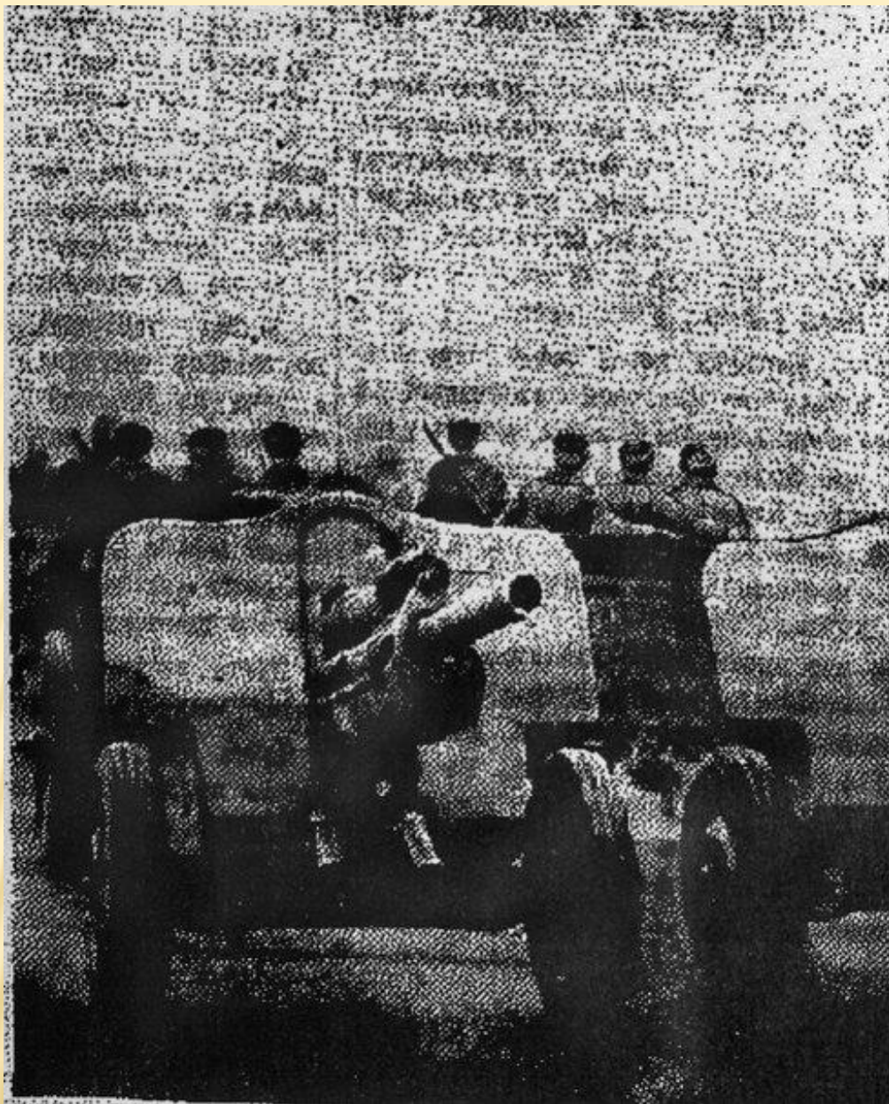
76-мм пушки (обр. 1939) в парадном строю