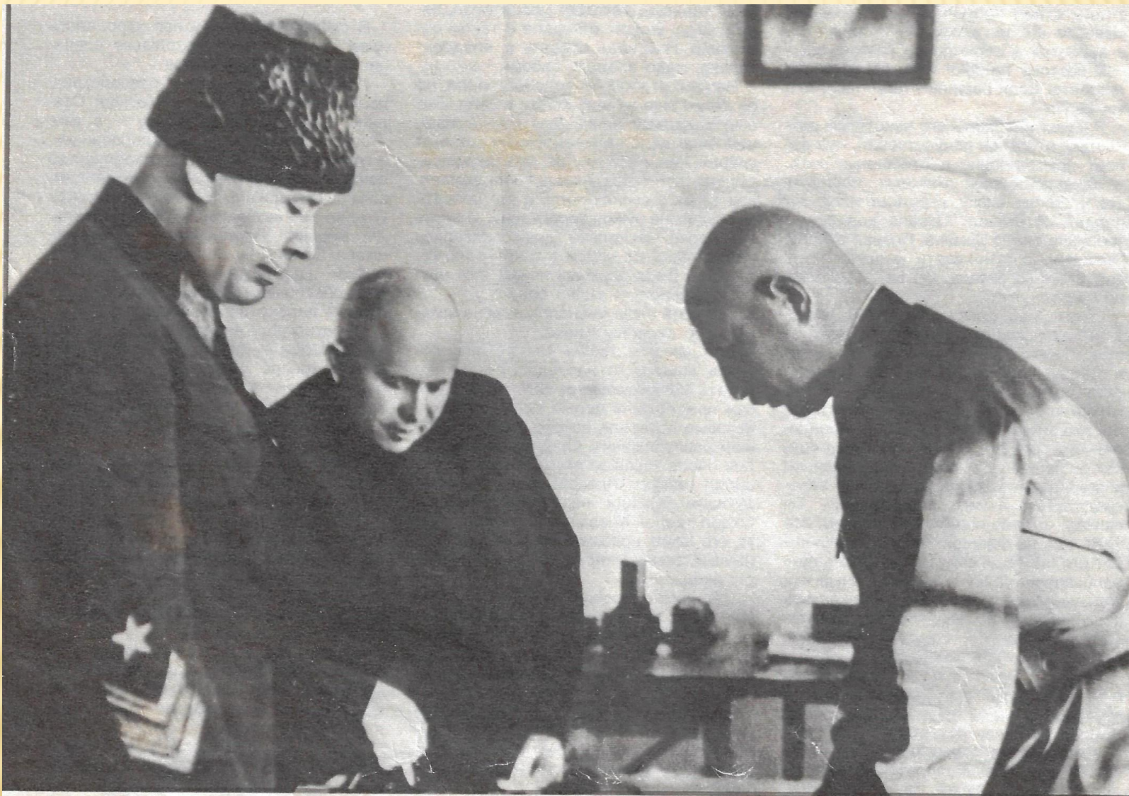
Маршал С. К. Тимошенко, член Военного Совета Н. С. Хрущев и начальник штаба Юго-Западного фронта И. Х. Баграмян. Воронеж, ноябрь 1941 г.