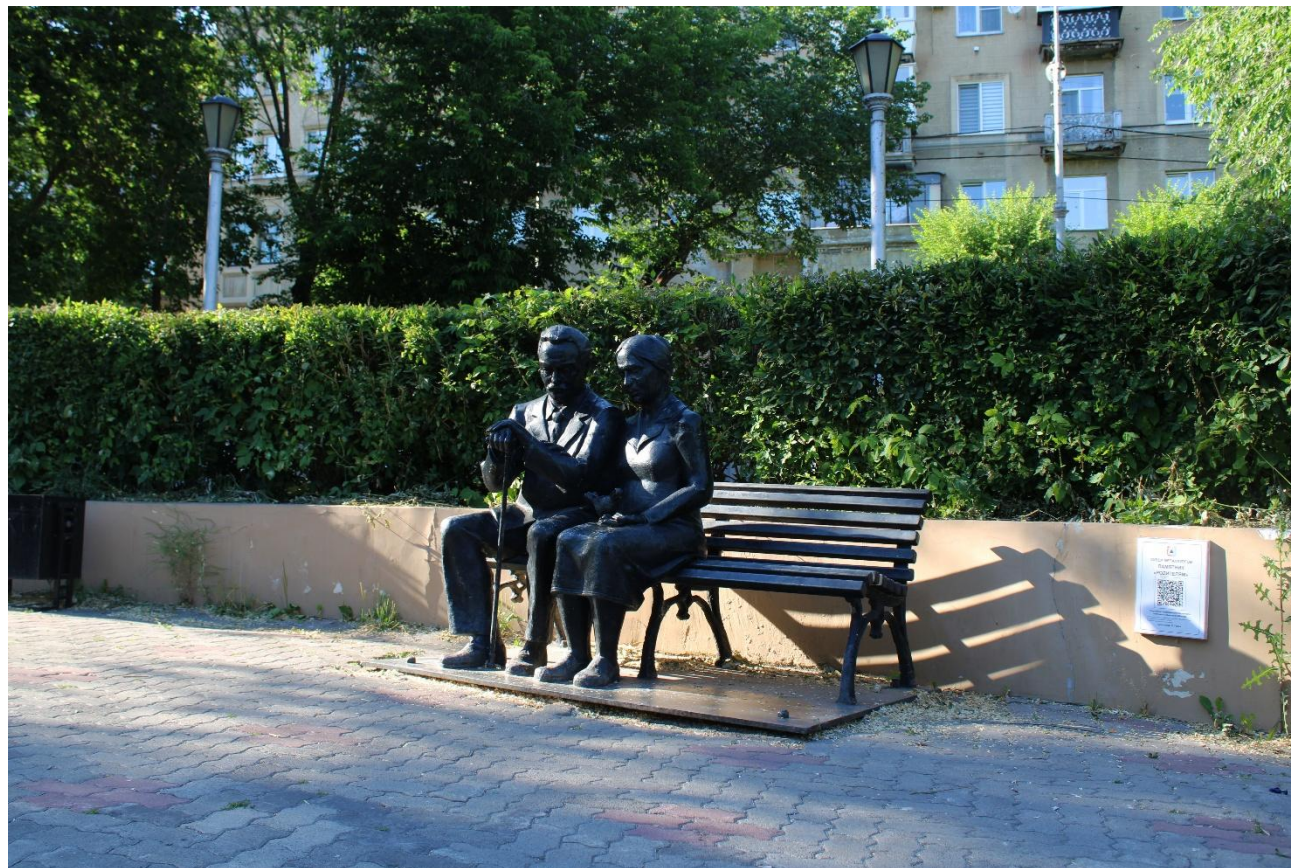
Фото 11:Общий план

Памятник Родителям относится к городской скульптуре нового поколения. Он представляет собой композицию, состоящую из двух скульптур людей, голубя и садовой скамейки.