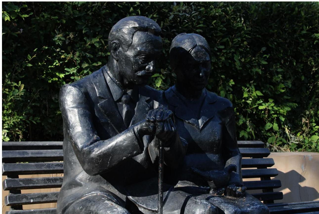
Фото 15: Фрагмент

Символический памятник, органично вписанный в ландшафт сквера, призывает не забывать тех, кто подарил нам жизнь, почитать своих родителей и заботиться о них.