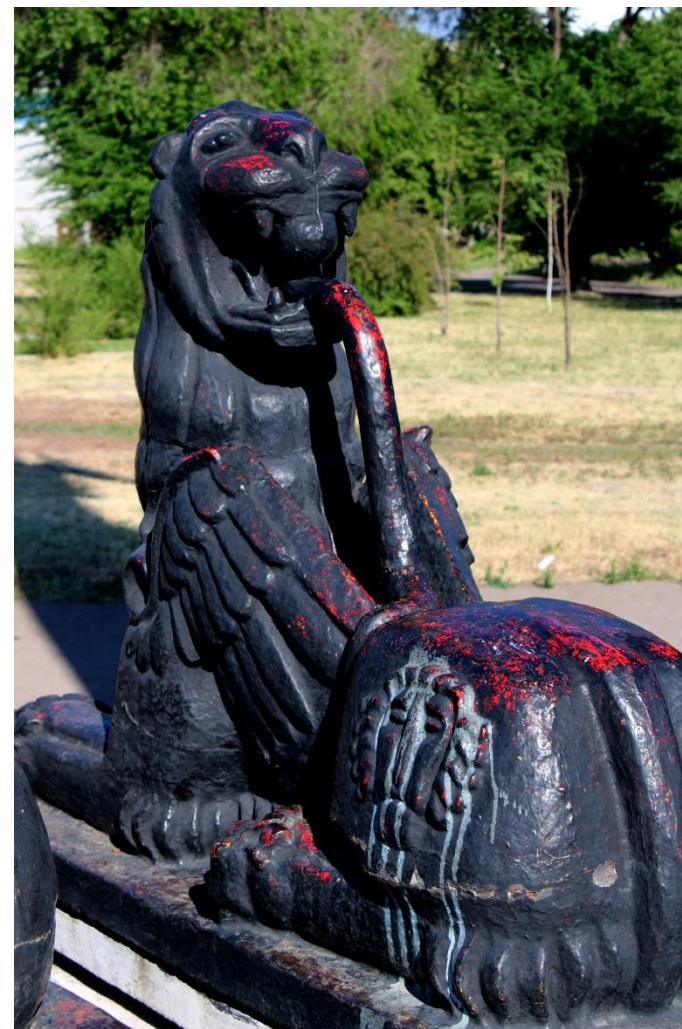
Фото 22: Фрагмент

Что особенно интересно, труд Ницше начал издаваться в 1883 году, значит, монумент был построен ровно на его столетний юбилей.