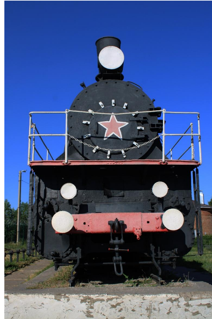
Фото 5: Фрагмент

Так же в описании Магнитогорского паровоза есть еще одна ошибка, только уже не случайная, а преднамеренная. Говорится, что паровоз был построен на Коломенском заводе в 1929 году. Это не соответствует действительности. Номер 58 говорит о том, что паровоз построен в 1917 году, прямо перед революцией и вовсе не Коломенским заводом, а в Луганске, на Украине. Именно Луганскому заводу и 1917 году постройки соответствуют серийные номера с 51 по 67.