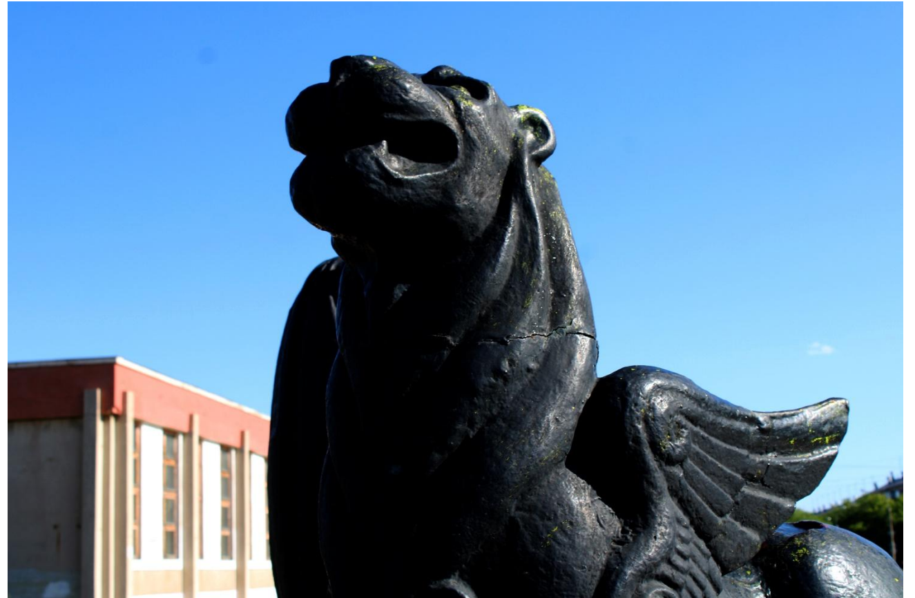
Фото 20: Фрагмент

Также монумент примечателен своей непохожестью на все остальные городские памятники, которые по большей части выполнены в реалистичном стиле, приземлённы и главным мотивом в них так или иначе является металлургия, они опираются на происхождение и историю города. Солнечные часы же выбиваются из этого ряда реалистичных памятников своей необычностью.