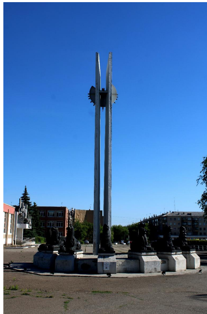
Фото 16: Общий план

Магнитогорск примечателен многими вещами. Город – завод, стоящий на границе Европы и Азии. Многие знакомы с тем фактом, что каждый третий снаряд и каждый второй танк были изготовлены из стали, добытой именно в этом городе. Много в этом городе и интересных архитектурных сооружений. В этой статье мы рассмотрим одно из них – декоративно – парковую композицию “Солнечные часы”, расположенную на улице Галлиулина, 17. Многие жители ее видели, но не знают, когда и кем она установлена и как по ней, собственно, определяется время.