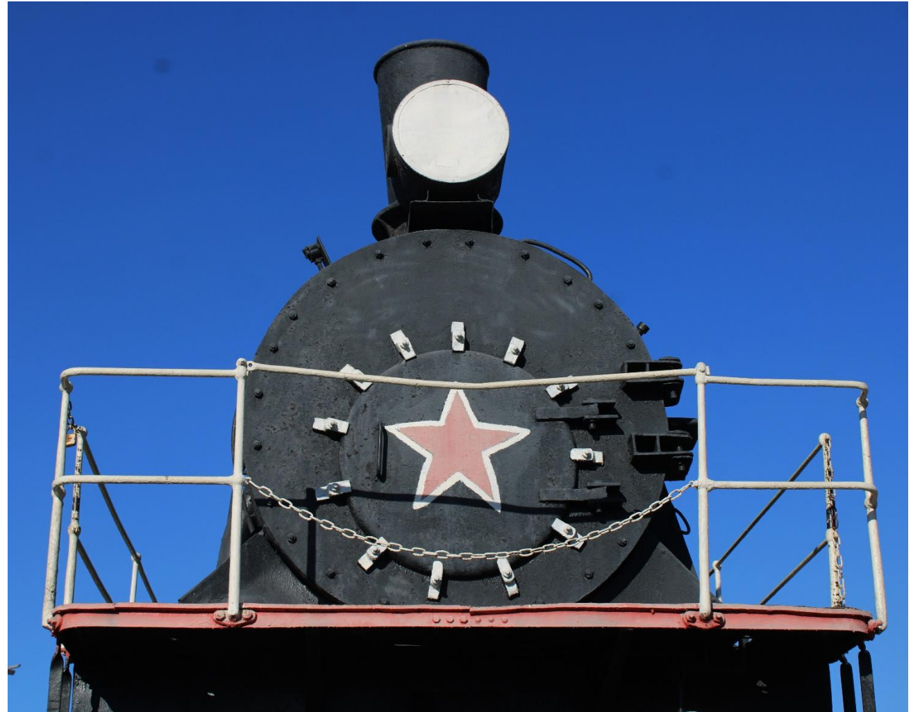
Фото 4: Фрагмент

Интересный факт: паровозы «серии Э» вошли в книгу рекордов Гиннеса, как самые массово выпускавшиеся, всего было произведено свыше 12 тысяч этих паровозов. Первый паровоз этого типа был построен в 1912 году, а завершился выпуск только в 1957. Паровая машина развивала мощность свыше 1000 лошадиных сил, а скорость на прямой доходила до 60 километров в час.