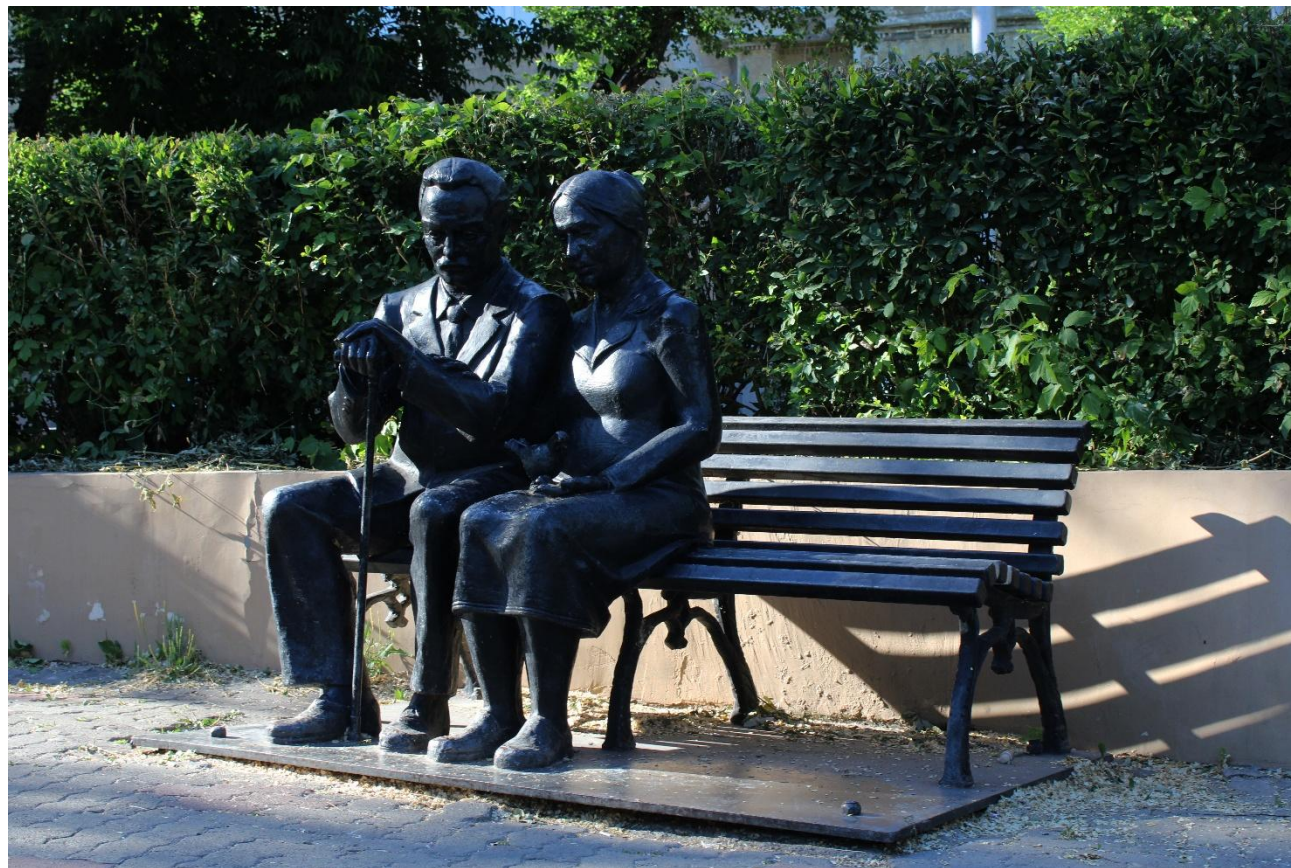
Фото 12: Средний план

Автор данного произведения Константин Гилев, молодой художник из города Златоуста, который победил в конкурсе на лучший проект "Памятника родителям", проведенный в Магнитогорской картинной галерее. Идея создания такого памятника принадлежит бывшему главе города Магнитогорска Евгению Карпову.