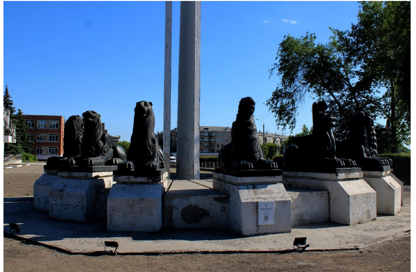
Фото 17: Крупный план

Сама композиция состоит из 9 смеющихся львов мальчика и стелы, на которой и находится циферблат часов. Примечательно, что изначально львов было изготовлено двенадцать, по количеству часов на циферблате. Неизвестно, было ли так задумано с самого начала, или же это вызвано некими обстоятельствами, но три льва в итоге “переехали” в детский лагерь “Озерное”.