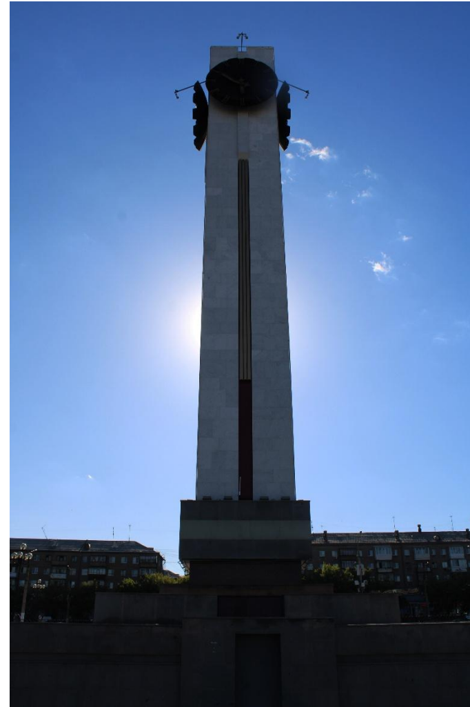
Фото 10: Крупный план

Куранты находятся прямо в центре города, напротив Белого дома. На площади Народных Гуляний под курантами проходит множество развлекательных мероприятий. Здесь проводят большинство городских праздников и гуляний, а также митинги, флэшмобы, парады и другие акции разнообразных тематик. В конце-концов, нет места встречи более удачного, чем под башней с часами. Популярней места, пожалуй, не сыскать во всем городе.