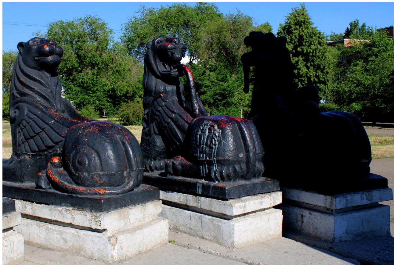
Фото 19: Фрагмент