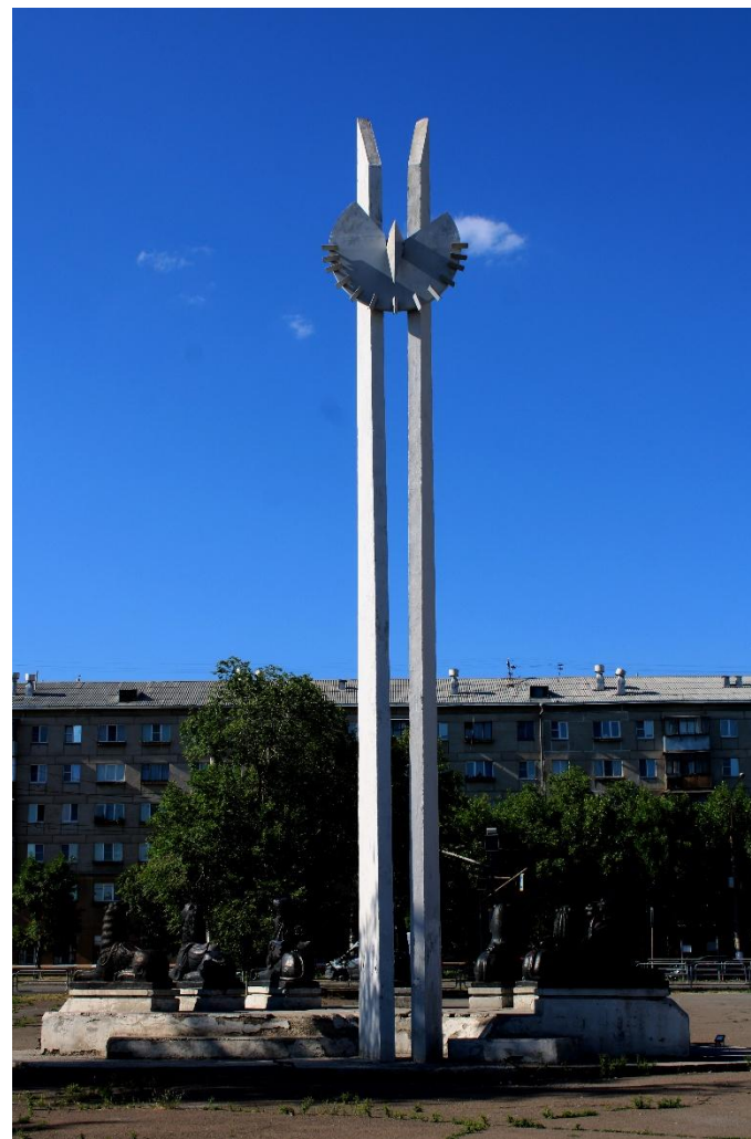
Фото 16: Средний план