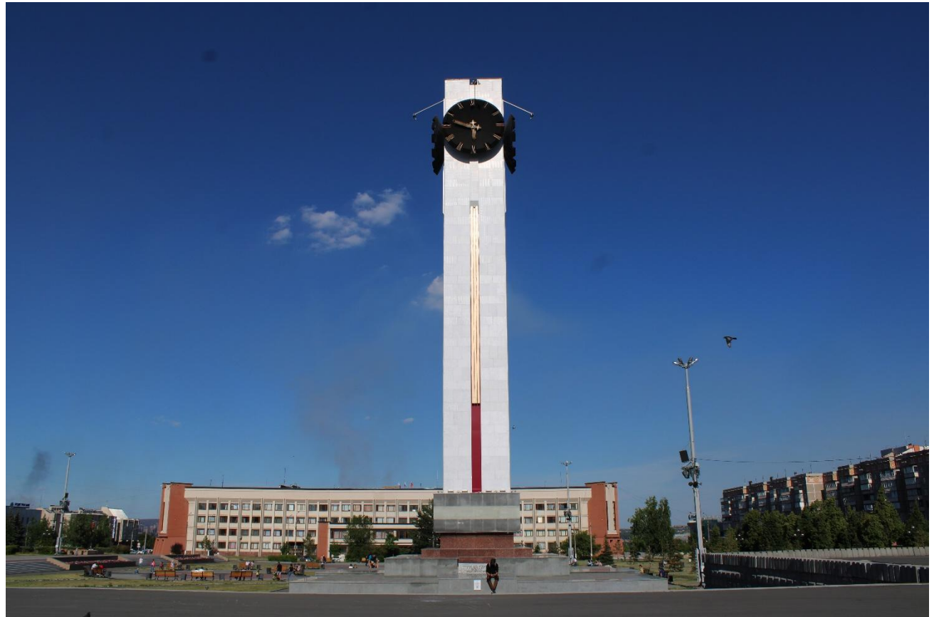
Фото 6: Общий план

Магнитогорск — город не самый старый, он появился лишь в конце 20-х гг. прошлого века, но уже успел обзавестись своими интересными и самобытными достопримечательностями. К примеру, 29-метровыми курантами, что расположены в самом центре напротив здания администрации.