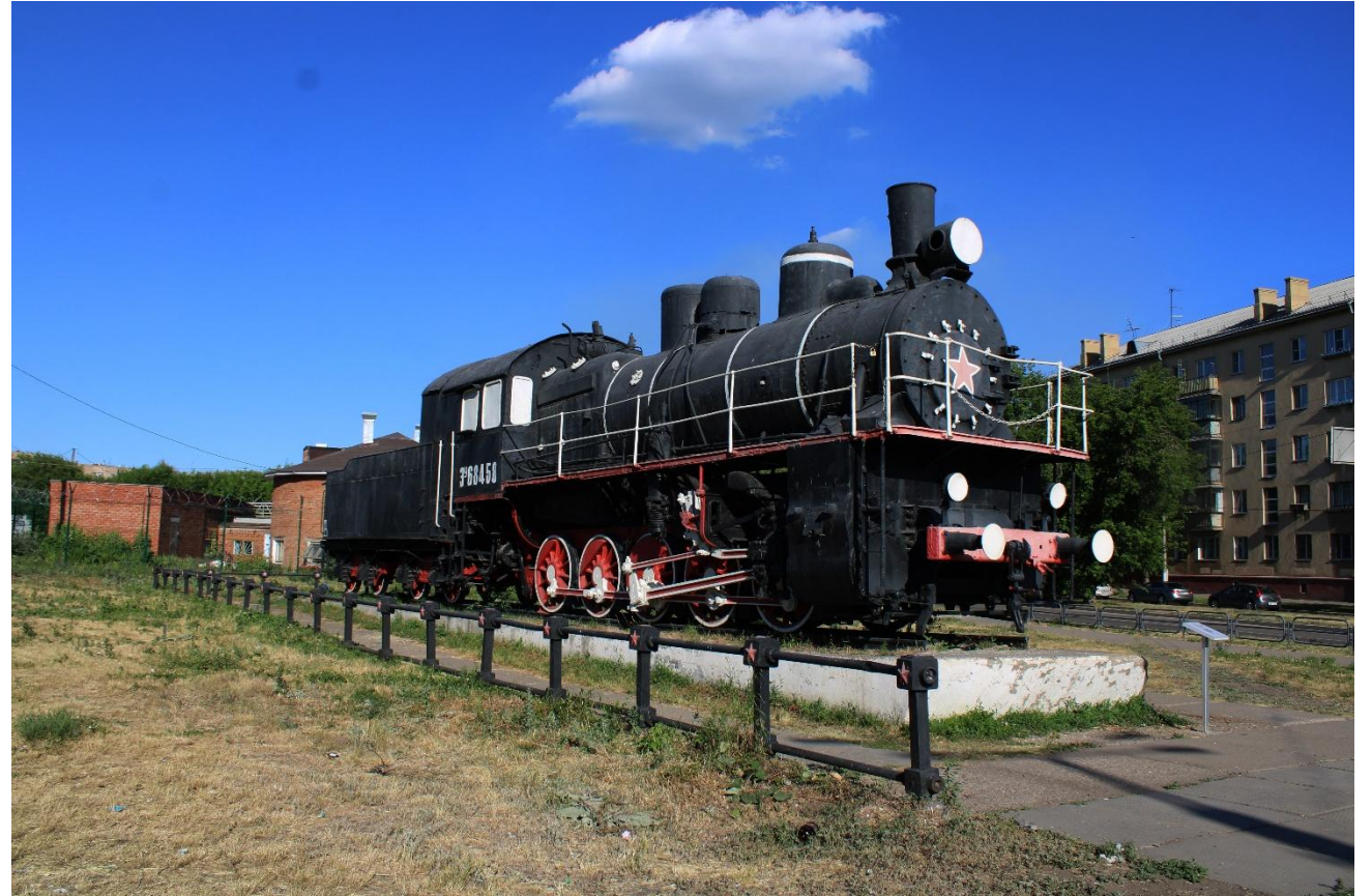
Фото 1 «Памятник паровоз»: Общий план

Паровоз «ЗУ684-58» был построен на Коломенском заводе в 1929 году. 30 июня 1929 года он, в числе первых, доставил поезд на станцию Магнитогорск. Много лет спустя именно этот день стали считать днем рождения города. В связи с празднованием 50-летия основания Магнитогорска было принято решение найти и установить этот паровоз на вечную стоянку на ст. Магнитогорск.