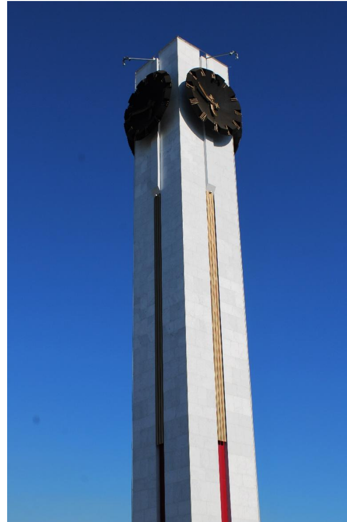
Фото 8: Фрагмент