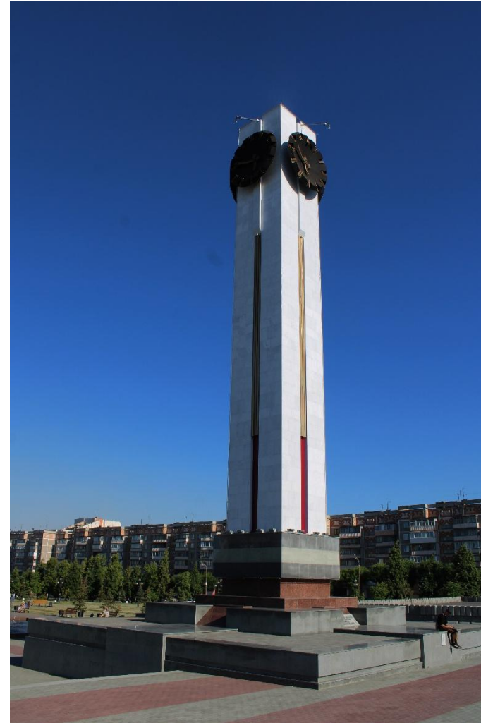
Фото 9: Средний план

Куранты по праву считаются культовым местом города Магнитогорска. 29-метровая башня, облицованная молочно-белым мрамором и красным туфом, выглядит невероятно величественно и помпезно. Её верхушку венчают четыре (по одному на каждую сторону) черных циферблата, достигающие в диаметре трех, а то и трех с половиной метров. По их массивной поверхности, покрытой автоэмалью, курсируют, отбивая минуты и часы, острые, позолоченные сусальным золотом, стрелки. Особенно чарующе куранты выглядят в ночное время, когда установленные над циферблатами фонари окидывают башню мягким светом