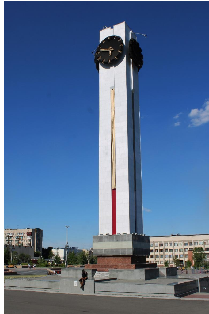
Фото 7: Средний план

Магнитогорска. А произошло это знаменательное событие в 1979 г.