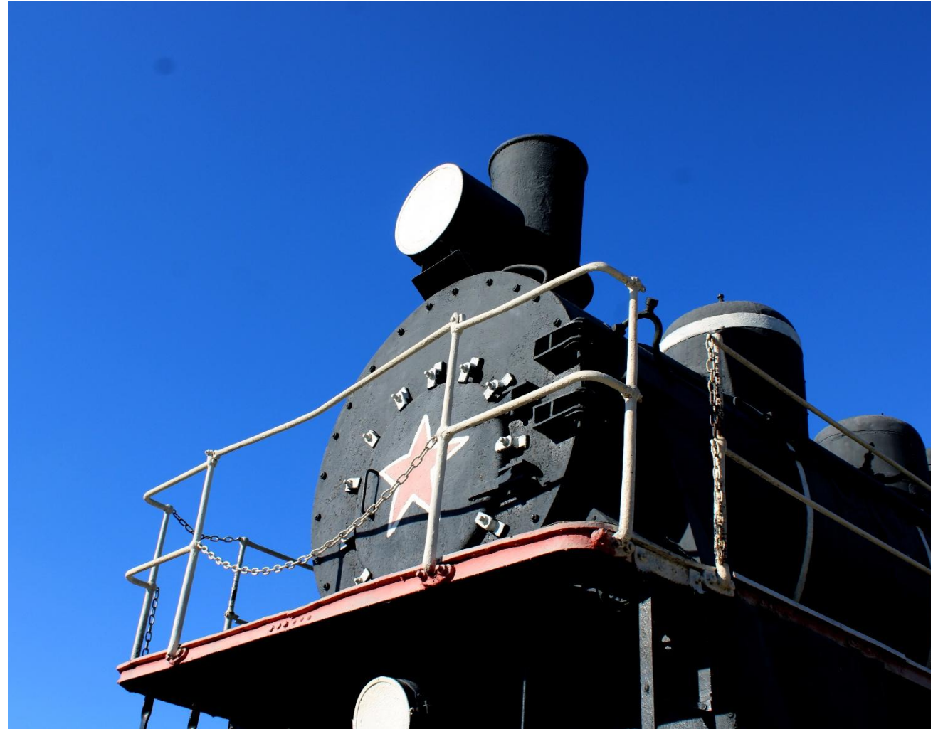
Фото 2: Фрагмент

Так в 1979 году паровоз стал памятником истории. Установлен он на низком постаменте из бетона. На левом борту у входа в паровозную будку укреплена мемориальная доска с текстом: «30 июня 1929 года этим паровозом в числе первых был приведен поезд на ст. Магнитогорск». Открыт памятник в июне 1979 года.