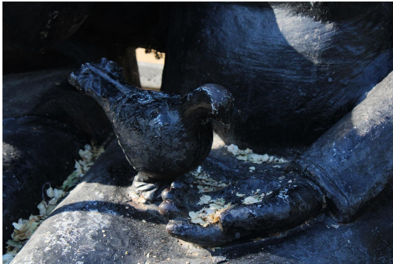
Фото 13: Фрагмент

Скульптурная композиция была установлена в сквере Metallургов в 2007 году. С тех пор пожилая пара, сидящая на скамейки в сквере, является символом уважения к старшему поколению и к родителям. Скульптурная композиция выполнена из серого чугуна и выглядит очень реально, даже чугунная голубка, сидящая на руках у женщины. Многие посетители сквера садятся на лавочку с пожилой парой и вспоминают своих родителей