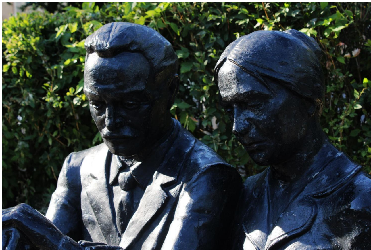
Фото 14: Фрагмент

Произведение, выполненное из чугуна, отличается реалистичностью воплощения образов. Композиция включает две человеческие фигуры — пожилых мужчину и женщину, сидящих на скамье. Их лица задумчивы, во взгляде — печаль и усталость. Женщина кормит с руки голубку, которая олицетворяет ребёнка, покинувшего семейное гнездо.