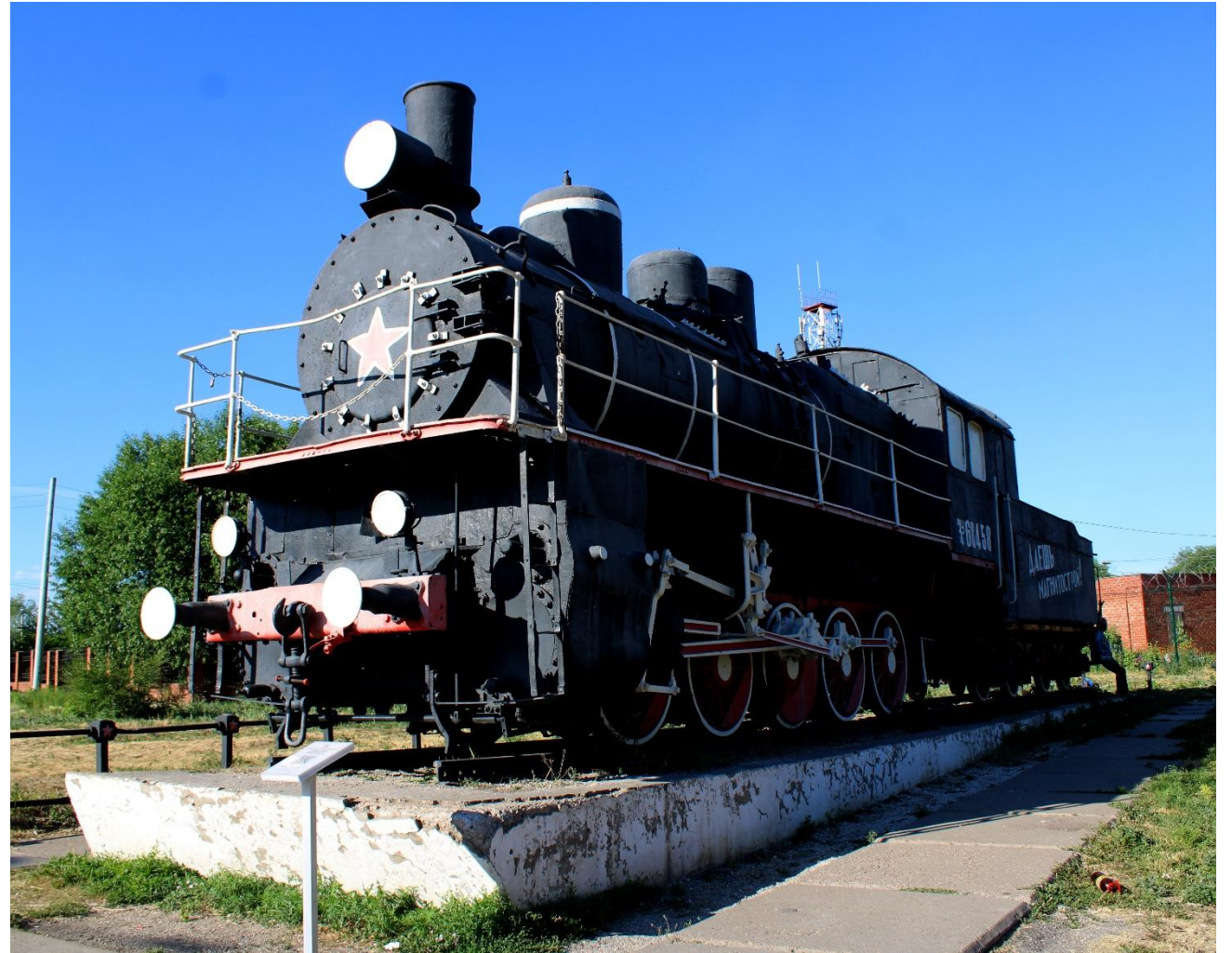
Фото 3: Средний план

Так что «первый» - название скорее условное и символическое, чем исторически достоверное. Тем не менее 30 июня, день прибытия первого поезда на станцию Магнитогорск, в дальнейшем стал отмечаться как «День города». И именно 30 июня 1979 года, в день 50-летнего юбилея Магнитогорска, паровоз занял место на привокзальной площади. Автором композиции стал местный архитектор В.С. Пономарев.